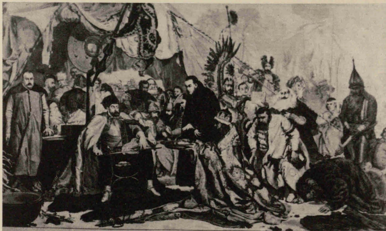
STEFAN BAJCZY POD PSKOWEM 1521 R.