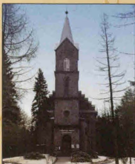
Kościół w Szklarskiej Porębie Górnej tel. (0...75) 717 22 82