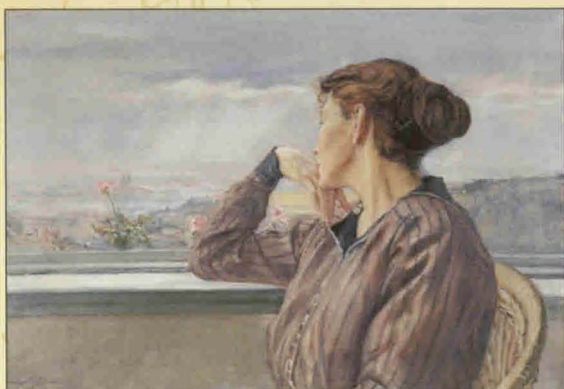
„Pożegnanie z Pragą” wł. prywatna