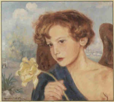
„Aniol z tulipanem“ wł. Muzeum Karkonoskie w Jeleniej Górze