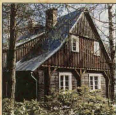
„Wlastimilówka“ Dom Wlastimila Hofmana tel. (0...75) 717 27 52