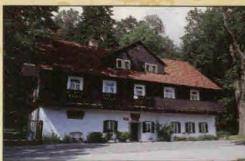
Muzeum Karkonoskie oddział: Dom Carla i Gerharta Hauptmanna tel. (0...75) 717 26 11