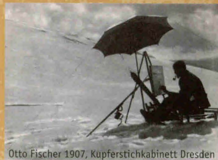
Otto Fischer 1907, Kupferstichkabinett Dresden

Biuro Wystaw Artystycznych ul. Długa 1 58-500 Jelenia Góra Tel. +48-75-75 266 69