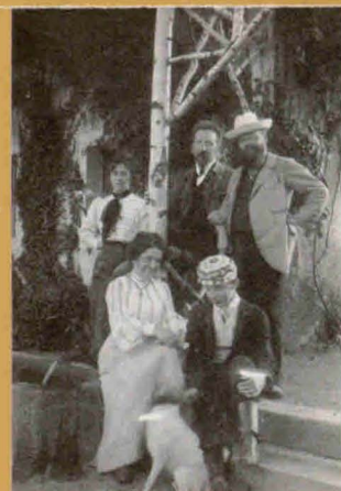
Carl Hauptmann, Wilhelm Bölsche, 1904

Wystawa prezentuje ponad stu artystów i formacji artystycznych XX wieku, związanych z Karkonoszami. Pokazywane tu – częściowo po raz pierwszy – obrazy, rysunki, rzeźby, fotografie, utwory literackie, filmy video, nagrania fonograficzne, rekwizyty teatralne, dokumenty osobiste jak również 150 tablic tekstu oraz pokaz slajdów opatrzone komentarzem dźwiękowym, objaśniają tło historyczne, drogi życiowe i koncepcje artystyczne poszczególnych twórców. Dwujęzyczny katalog obejmuje 400 bogato ilustrowanych stron i zawiera artykuły 32-óch polskich oraz niemieckich autorów.