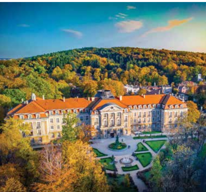
Dom Zdrojowy w Szczawnie-Zdroju