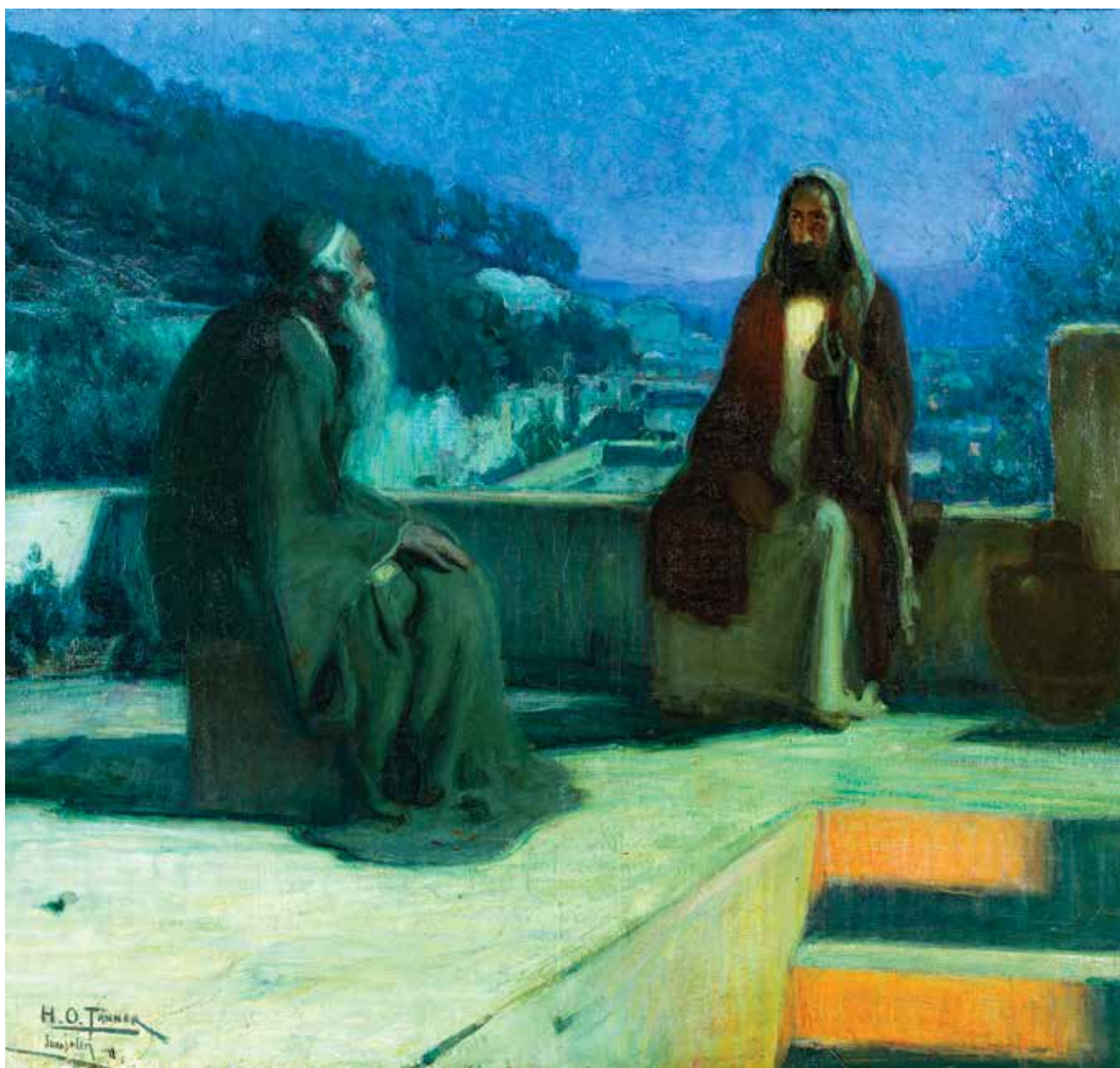
Nikodem odwiedzający Jezusa – Henry Ossawa Tanner, 1899 r., olej na płótnie, Akademia Sztuk Pięknych w Pensylwanii, Filadelfia

Oznacza to, że dotyczy wszystkich ludzi wszystkich czasów. Bóg kocha każdego człowieka jednakową miłością, w myśl słów Jezusa: „On sprawia, że słońce Jego wschodzi nad złymi i nad dobrymi, i On zsyła deszcz na sprawiedliwych i niesprawiedliwych” (Mt 5, 45). Jego miłość jest także bezwarunkowa. Bóg nie kocha człowieka dlatego, że ten stara się unikać grzechu, ale po prostu dlatego, że jest Ojcem. Jego miłość jest także niezmienna: „Każde dobro, jakie otrzymujemy, i wszelki dar doskonały zstępują z góry, od Ojca światła, u którego nie ma przemiany ani cienia zmienności” (Jk 1, 17). Z niezmienności miłości Boga wynika kolejny jej przymiot: jest to miłość wierna. Apostoł Paweł tłumaczył Tymoteuszowi: „Jeśli my odmawiamy wierności, On wiary dochowuje, bo nie może się zaprzecć siebie samego” (2 Tm 2, 13).