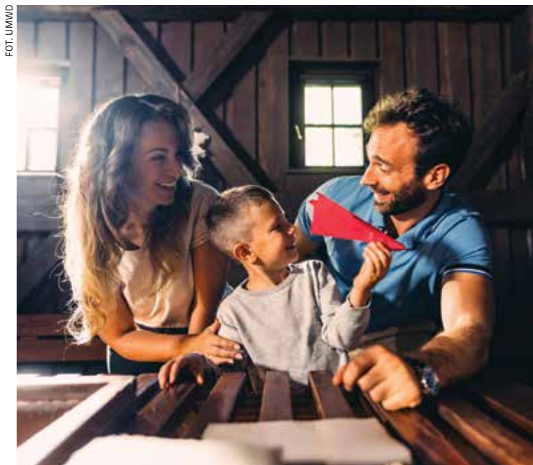
Muzeum Papiernictwa w Dusznikach-Zdroju