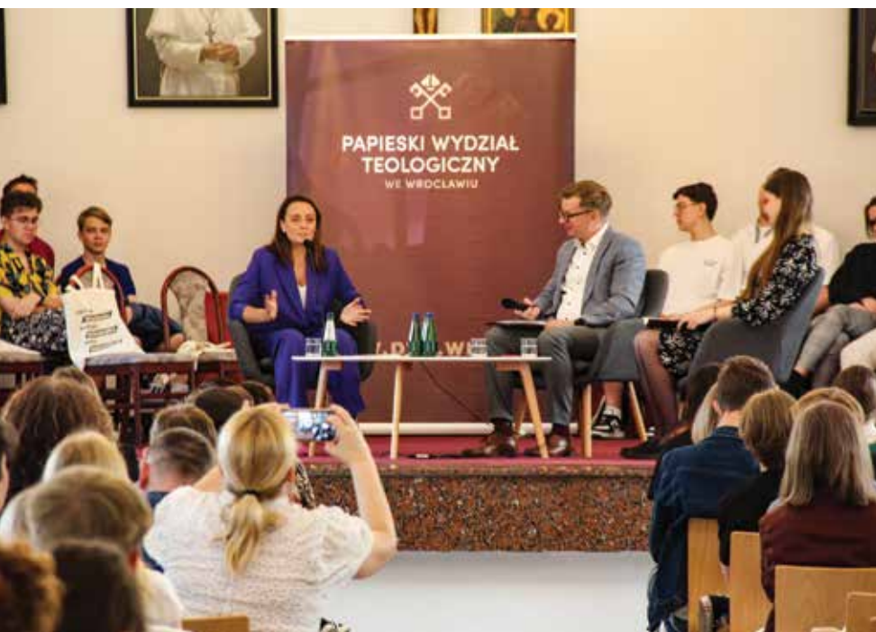
PWT WE WROCŁAWIU

Specjalność poświęcona naukom o rodzinie oraz ten kierunek w trybie studiów podyplomowych dają kwalifikacje, które uprawniają do pracy w poradniach rodzinnych, w centrach pomocy rodzinom, do prowadzenia zajęć w szkołach z dziećmi, młodzieżą i rodzicami z zakresu wychowania i edukacji prorodzinnej, do uczenia przedmiotu WDŻ w szkołach (pod warunkiem posiadania uprawnień