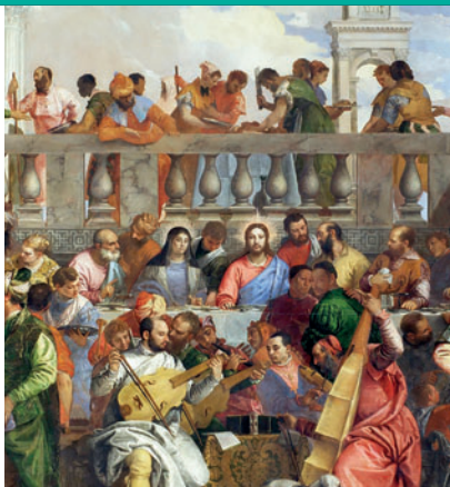
Okładka: Wesele w Kanie – olej na płótnie, Paolo Veronese, 1563, Luwr, Paryż, Francja