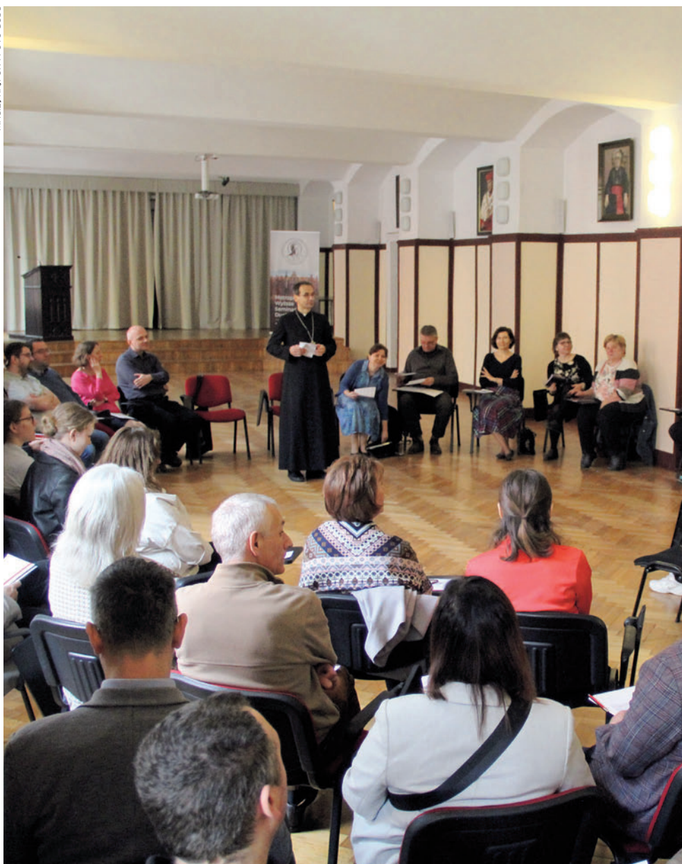
W kwietniu we wrocławskim seminarium odbyły się dwa podsumowujące spotkania z zespołami presynodalnymi. Wrocław, 6 kwietnia 2024 r.