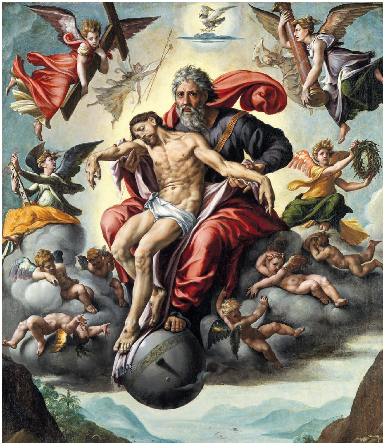
Trójca Świeta – olej na desce, Jan Cornelisz Vermeyen, ok. 1530–1540, muzeum Prado, Madryt, Hiszpania