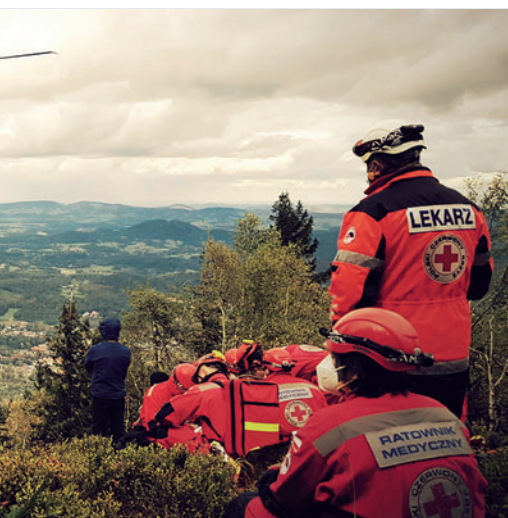
Ratownicy podczas ćwiczeń Renegade/Sarex, które odbywały się w 2020 r. w Karkonoszach

To prawda. Zmotywowanego i wyszkolonego ratownika-ochotnika nie da się kupić. Jego trzeba uformować od podstaw, a taki pełny proces trwa około 5 lat. Ratownictwo PCK to ludzie, którzy przez te wszystkie lata przewinęli się przez nasze jednostki. Dzięki nim jesteśmy dziś tu i teraz. I będziemy rozwijać te struktury dalej przez kolejne lata. ●