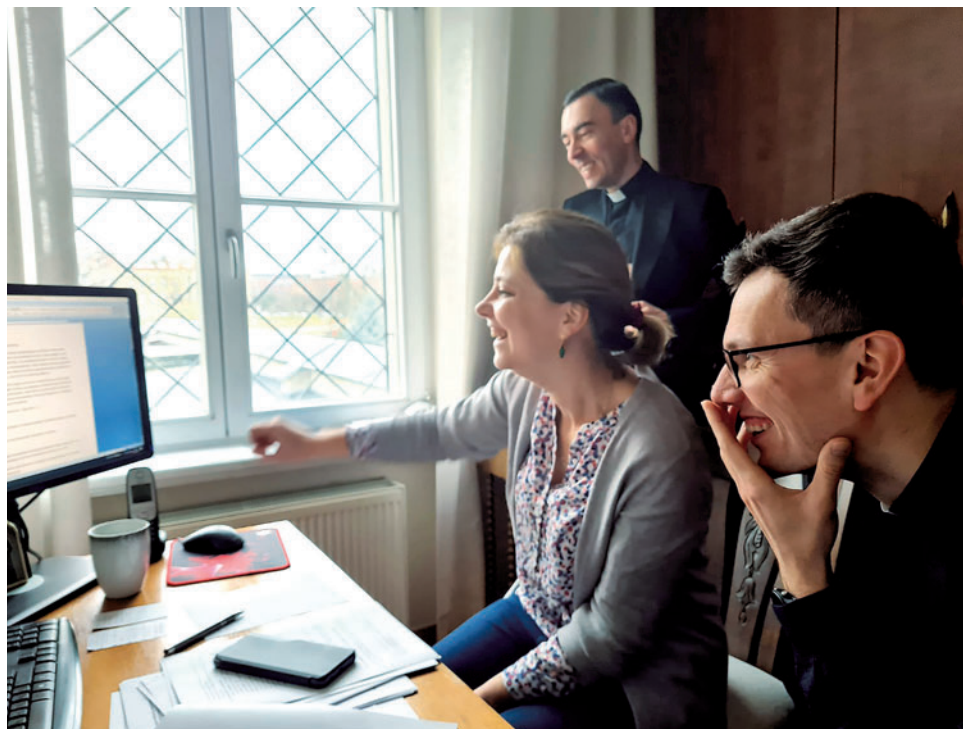
Prace w sekretariacie synodu toczą się w dobrej atmosferze. Tu powstają plany, analizowane są syntezy i organizowane wydarzenia

Drugi cel jest dopiero przed nami i też jest pracą na lata: przemyśleć kształt naszych struktur kościelnych, aby bardziej służyły temu celowi pierwszemu, czyli wierze. Dalej, procczo zarysować wizję przyszłości tak, aby nie działać w reakcji na pojawiające się problemy. Zwłaszcza że Pan Bóg nam tę wizję daje.