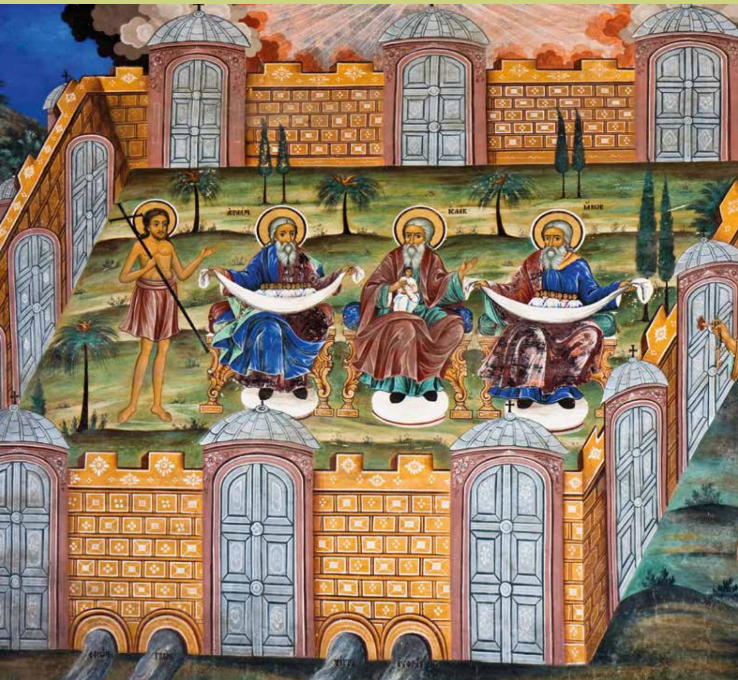
Chrystus w ogrodzie Eden z Abrahamem, Izaakiem i Jakubem oraz cztery rzeki wypływające z raju: Pizon, Gichon, Tygrys i Eufrat. Fresk, XIX wiek, monastyr Rylski, Bułgaria