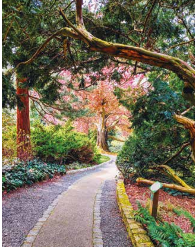
Uroki Arboretum Wojstawice można podziwiać o każdej porze roku