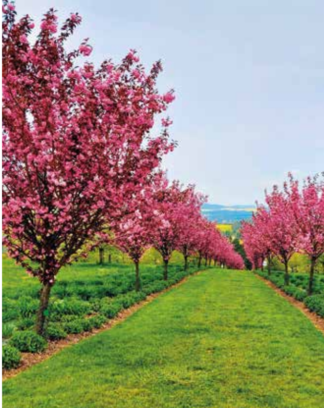
Alejką wiśni piłkowanej w Arboretum Wojstawice w Niemczy