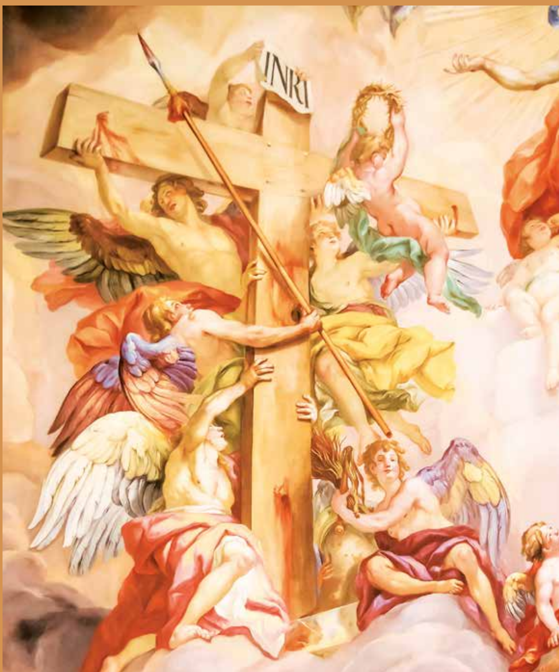
Fresk na kopule kościoła św. Karola Boromeusza w Wiedniu, 1726–1729, Johann Michael Rottmayr