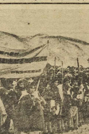
Pod hasłem: „Wszystkie siły dla zwycięstwa” naród koreański prowadzi wojnę wyzwolńczą przeciwko interwentom z USA i ich najemnikom. Na zdjęciu: Chłopi z wyzwolonych obszarów kraju wstępują w szeregi Armii Ludowej.

projekt też dla zjazdu KPD, podkreślając, że tezy zjazdu są nie tylko sprawą członków KPD, lecz stanowią również drogowskaz dla najszerzego mas ludowych. Tezy te dają obraz niebezpieczeństwa w obliczu którego znajduje się ludność Niemiec zachodnich, wskaźnik równocześnie drogę do stworzenia pokojowych, demokratycznych i niezależnych Niemiec. Obowiązkiem każdego członka KPD jest przekonanie masy ludowej o konieczności aktywnego udziału w walce o pokój. Reimann omówił następnie skutki remilitaryzacji Niemiec zachodnich. Remilitaryzacja ma na celu przygotowanie nowej wojny i odpowiada planom monopolu amerykańskiego. Nie wolno dopuścić do przekształcenia Niemiec zachodnich w główne ognisko wojny w Europie. Naród niemiecki musi wywalczyć — wraz z innymi milującymi pokój narodami — trwały pokój. W tym celu niemiecka klasa robotnicza i cały naród prowadzić muszą walkę o pokojowe uregulowanie kwestii niemieckiej w roku 1951. Jednym z głównych zadań najbliższego okresu jest przekształcenie i rozwinięcie ruchu „Bez nas” (ruch ten wyraża negatywne stanowisko wobec remilitaryzacji Niemiec zachodnich) — w ruch aktywnego oporu przeciwko remilitaryzacji.