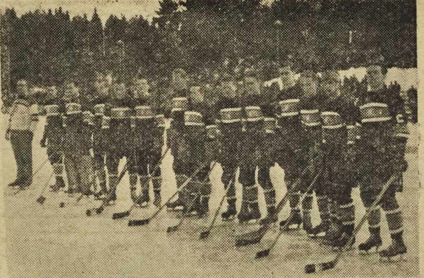
Zespół Czechosłowacji — akademicki mistrz świata w hokeju na lodzie

W koszykowej klasie A Dolnego Śląska padły ubiegłej niedzieli następujące wyniki: We Wrocławiu: Ognio pokonało wysoko wrocławską Gwardię 66:26 (33:10) a Stal-Pafawag wygrał z wrocławskim Górnikiem 42:36 (16:15). W Jeleniej Górze miejscowi Budowlani wygrali z Budowlanymi (Wr.) 57:25 (32:15).