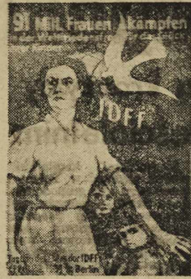
Plakat berlińskiej sesji SDFK głosi: 91 milionów kobiet walczą w światowym froncie pokoju o szczęście swych dzieci

Świat nie otrzaskał się jeszcze ze zgrozy wojennej, a już w listopadzie 1945 r. zjechały się w Paryżu przedstawicielki organizacji kobiet, żeby położyć fundamenty pod nową organizację międzynarodową, łączącą kobiety bez różnicy wyznania, narodowości, rasy i przynależności politycznej.