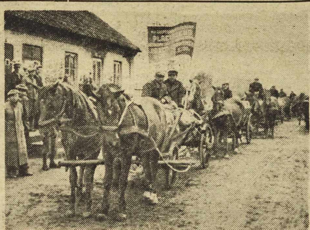
„Podniesimy plony zbóż z hektara” — z takim transparentem przywieźli chłopi zboże do magazynów Gminnej Spółdzielni „Samopomoc Chłopska” w Baboszwie w pow. płońskim.

My, chłopi z Kręczkowa, z radością, przyjęliśmy planowy skup zboża. Każdy z nas wie, że stała i opłacalna cena, jaką nam Rząd gwarantuje, broni go najskuteczniej przed wyzyskiem kulaka, przed odrobkiem i lichwą zdieryspekulanta. (Dokończenie na str. 2-ej)