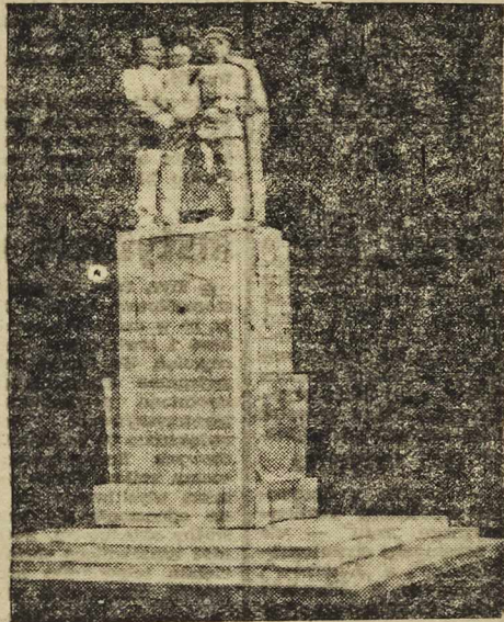
Makieta Pomnika Wdzięczności dla Armii Czerwonej w Legnicy

prosto i serdecznie. „W prastarej naszej Legnicy, którą wyzwolił dla nas żołnierz radziecki, musi stanąć pomnik”. I proszą, by każdy ofiarował na rzecz