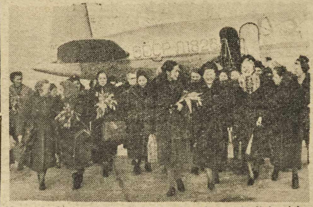
Na sesję Świat. Federacji Kobiet Demokr. w Berlinie zjeżdżają liczne delegacje. Powitanie na lotnisku Schoenfeld koło Berlina, delegatek chińskich i koreańskich.

Rzym. Robotnicy zakładów samochodowych „Fiat” w Turynie demonstracyjnie zastrajkowali na znak protestu przeciwko niewypłacaniu im premii oraz zmniejszeniu ilości godzin nadliczbowych.