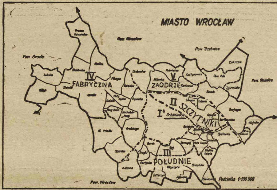
Mapka przedstawia nam nowe granice miasta, w których znalazły się już przyłączone osiedla. Stare granice są zaznaczone na mapce liniami kreskowanymi; zaznaczone na niej ponadto pięć nowych dzielnic, z zaprojektowanymi nazwami.

Spór na temat, czy Poznań, czy Wrocław jest większy pod względem obszaru — wrocławscy geodeci rozstrzygnęli na korzyść Wrocławia, stwierdzając, że stolica Dolnego Śląska, jest o kilka hektarów większa, niż Poznań. Po przyłączeniu do miasta nowych osiedli, Wielki