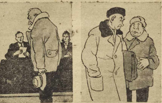
— Jak długo będziecie się uchylać od płacenia alimentów? — Już niedługo, panie sędzio. Wkrótce dziecko skończy 18 lat. — Jak przedstawia się u was sprawa łaźni? — Wszystko w najwłaściwym porządku. Łaźnię urządzamy regularnie kierownikowi gospodarki komunalnej na posiedzeniach MRN-u, a mieszkańcy myją się u domu.