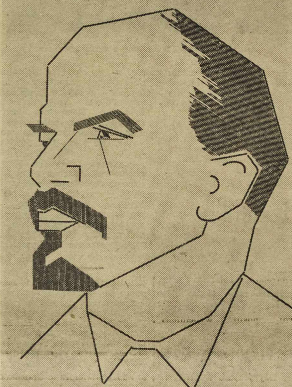
Projektował: Bolesław Smereczński kl. II Skladał: Stanisław Białowos kl. III Odbijał: Stefan Lubowicz kl. III Uczniowie Państw. Główn. Przem. Poligraf. w Nowej Rudzie — R. 1949/50

Broszura Lenina „Socjalizm i wojna” ukazała się we wrześniu 1915 r. również w języku niemieckim. Taki właśnie egzemplarz z dedykacją podarował mi Lenin — pamiętam wieczór w zurychskim Domu Związków-ców. Udało mi się przewieźć cenną księżeczkę, wraz z innymi zabronionymi w Niemczech pismami przez graniczną kontrolę celną. Ta piękna pamiętka jak i cała moja biblioteka marksistowska, wpadła niestety w ręce gestapo podczas ostatniej wojny.