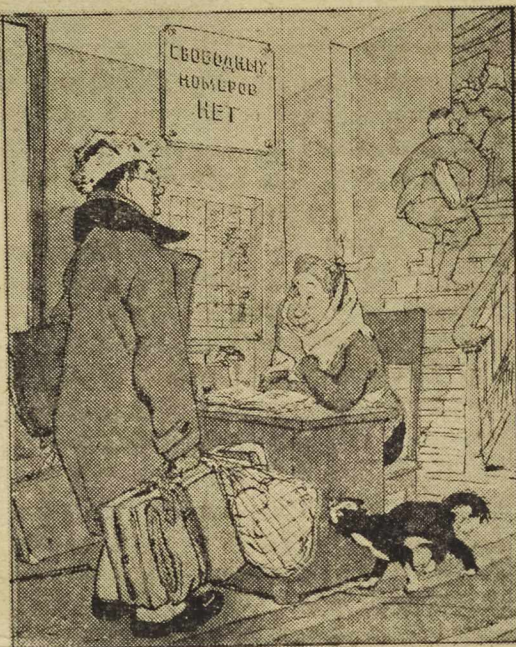
— Skandal! W naszym hotelu nigdy nie ma wolnych pokoi. Zobaczcie, że złoże na wosk gazalnię u przewodniczącego MRN. — Proszę bardzo, pierwsze piętro, pokój numer 10.