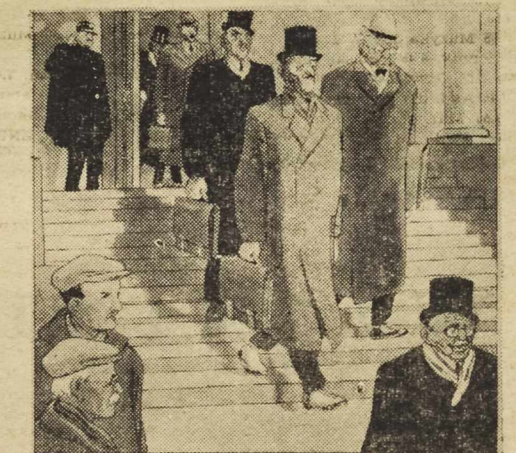
Podstuchano w Paryżu: — Jak ci się zdaje, który z nich jest ministrem handlu? — Moim zdaniem oni wszyscy handlują ojczyzną.