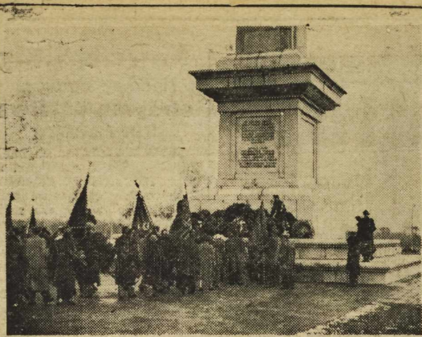
Dnia 17 stycznia br., w 6-tą rocznicę wyzwolenia Warszawy lud Warszawy manifestował swą wdzięczność i miłość dla wyzwolicieli, pokrywając pomniki i groby żołnierzy radzieckich i polskich wienkami i nęcącymi kwiatów. Na zdjęciu: Delegacje społeczeństwa składają wieniec na cmentarzu żołnierzy radzieckich.