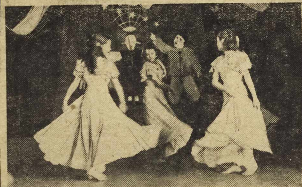
Na zabawie noworocznej dla dzieci pracowników Spółdz. Wyd. „Czytelnik” we Wrocławiu w dniu 7 bm. wystąpił m. inn. dziecięcy zespół taneczny Młodzieżowego Domu Kultury. Na zdjęciu — popis młodych baletnic.