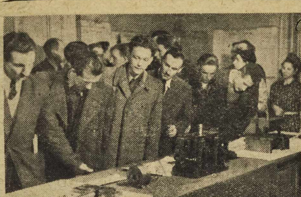
W ub. niedzielę w świetlicy Dyrekcji Państw. Przemysłu Miejsowego odbyła się konferencja racjonalizatorów i przodowników pracy DPM, po czym otwarta została wystawa pomysłowa racjonalizatorskich. Na zdjęciu — uczestnicy konferencji zwiędają wystawę.