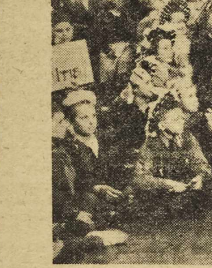
...Ani jedna buzia nie odwróci się od sceny. Ani jedno oko nie drgnie...

rolegają się dzwonił uprzejmy w ciszy mroźnego poranka. Duży autobus PKS jest pełny. Po chwili — rozbrzmiewa wesołym gwarem. A kiedy