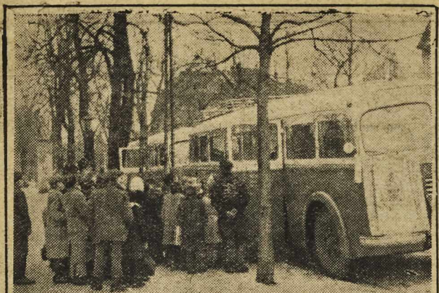
Autobusy przybyły do celu. Mali widzowie licznych imprez za chwilę wysypią się przed gmach, w którym czeka na nich tyle niespodzianek... (Do reportażu na str. 2-giej)