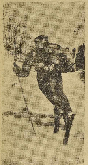
Zawodnicy polscy trenują pilnie przed Akademickimi Mistrzostwami świata

Hokeiści wrocławskiej Gwardii wyjeżdżają w dniu dzisiejszym do Wąbrzycha, gdzie wezmą udział w turnieju zorganizowanym przez tamtejszego Włóknarza. Po turnieju gwardziści udadzą się do Karpacza na kilkudniowy oboz kondycyjny.