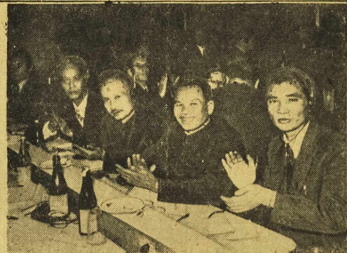
Obrazy Światowej Rady Pokoju. Na zdjęciu: delegacja Wietnamu.

W tych dniach zamknięta została Wystawa Techniki Budowlanej w Warszawie. Ponad 150 tysięcy zwiedzających obejrzało wystawę w ciągu 43 dni jej trwania. Oprócz szerokiego rzesz społeczeństwa Warszawy, wystawę zwiedziło wiele wycieczek z całego kraju.