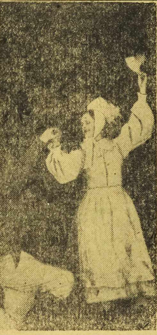
W Miasteczku Pogłębia Przyjaźni Polsko - Radzieckiej Ministerstwo Kultury i Sztuki zorganizowało w Warszawie pokaz osiągnięć najlepszych Państwowych Ognisk Choreograficznych i Muzycznych z Poznania, Jarostawia, Grodziska i Zbąszynia. — Na zdjęciu: fragment „Tańca Wielkopolskiego” w wykonaniu zespołu ogniska choreograficznego z Poznania.

Jedziemy do Warszawy radiofonizowanymi pociągami