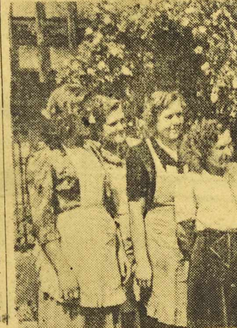
Dom Wypoczynkowy „Młoda Gwardia” w Szklarskiej Porębie. Wczasowicze korzystają z górskiego słońca.