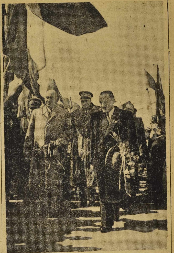
Ludność stolicy witała serdecznie powracającego z N. R. D. Prezydenta Bolesława Bieruta. Na zdjęciu — Prezydent po opuszczeniu pociągu na Dworcu Głównym.

Warto dodać, że szyb „Jan” jeszcze przed kilku miesiącami nie wykonywał planów. Mechanizacja, coraz lepiej rozwijające się współzawodnictwo, ścisła współpraca kierownictwa, organów partyjnych i związkowych, oraz ambicja załogi postawiły szyb „Jan” na czołowe miejsce w Zagłębiu Wałbrzyskim. Na pierwsze miejsce w kraju wysunęła się załoga szybu w wykonaniu zobowiązań 1 Majowych. (ki)