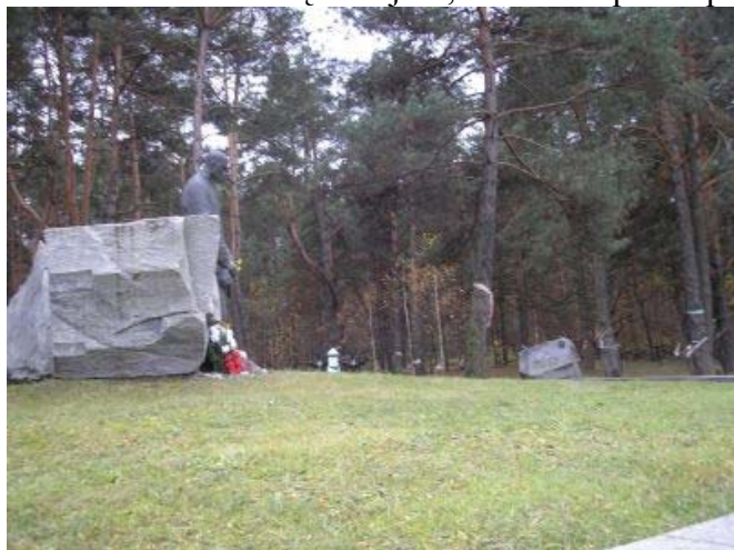
Pomnik więźnia przy drodze w głąb lasu.