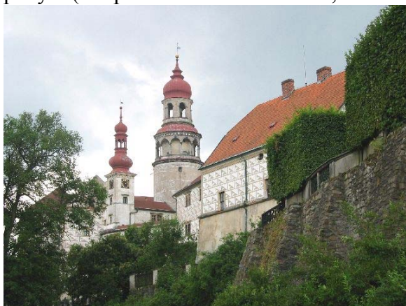
Nachodski zamek.

Idąc w stronę Mladkova warto też skręcić ok. 500 m na szczyt Adama, fantastycznego punktu widokowego na Jesioniki z Pradziadem, potężnie prezentujący się z tej strony Masyw Śnieżnika ze swoim najwyższym szczytem Śnieżnikiem, Igliczną, Czarną Górą i rozpostartym u ich stóp Międzyziesiem, góry: Żółte, Białskie, Bardzkie, Bystrzyckie i Orlickie. Na Adamie znajduje się schronisko, niestety, zamknięte podczas naszego pobytu (Kasparova Chata na Adamu, tel: 0446 95288).