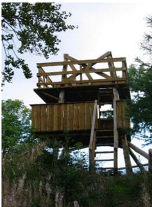
Wieża na Stożku Wielkim.

Na razie jednak czas ruszać w dalszą żółtym szlakiem i po godzinie dostrzegamy Sokołowsko to dość duża wieś leżąca w będąca uzdrowiskiem. Dawniej leczono tu specjalizuje się w profilaktyce i leczeniu światłości miejscowość przeżywała przede mann Brehmer uruchomił tu pierwsze na