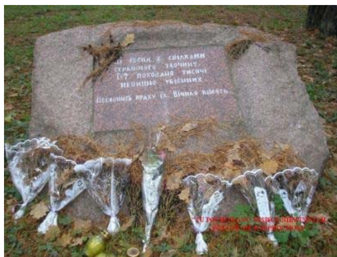
Tu pochowano tysiące niewinnych. Pokłoń się ich prochom.