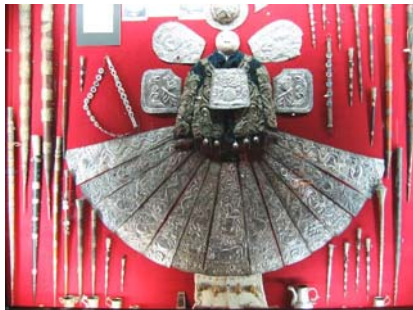
Srebrna dekoracja tułowia.