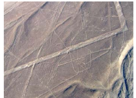
Ryty z Nasca

Autostrada – ale nie w rozumieniu europejskim, po prostu dobra szosa, wiodła wśród pustynnego krajobrazu, dzięki czemu plaże mają tu nawet do kilkunastu kilometrów szerokości. Rzecz jasna, nikt się na nich opala ani nie kąpie. I tu ogromne zaskoczenie: widok jak z Sahary, Tunezji czy Algierii – rozległy zbiornik wodny otoczony soczystą zielenią, wśród której stoją budynki usług turystycznych, zaś w tle wydmy dochodzące do... 300 m wysokości! Stanowią one teren atrakcyjnych przejażdżek specjalnymi pojazdami wielosobowymi i wszędolazami. Widoki z nich są przepyszne. To oaza Huacachina.