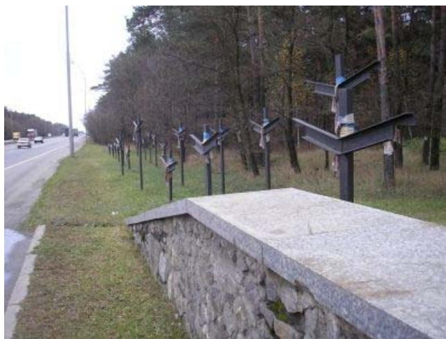
Krzyże przy pomn. więźnia. Szosa z Kijowa do Browarów.