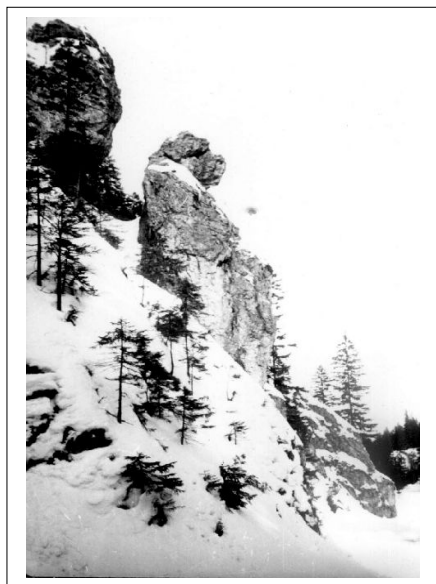
Pies w zimowych Koryciskach.

– I myśmy wtedy śpiewali tęskną pieśń o Teksasie, my wychowani na... socjalizmie. To i tak dobrze, że nas wówczas nie wsadzili do..., ale sądzę, że to była zakazana piosenka. Rano wychodzimy, a na dworze się wypogodziło, no i jest