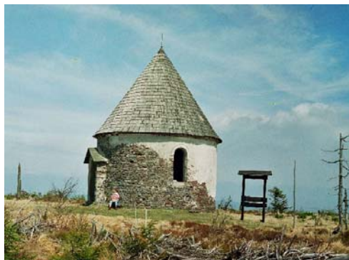
Kunštatske kaple.

nich jest udostępnionych do zwiedzania, np. forty artyleryjskie przy zielonym szlaku Nachod-Dobrošov, a przy „Jiraskovej ceste” – „pechotni srub RS 90/1” pod Komařim Vrchem (zorganizowano w nim małe muzeum czynne od kwietnia do września w soboty i niedziele od godz. 8 do 17, wstęp „co łaska”), twierdzę „Hanicka” (od czerwca do końca września czynna w godz. 9-15, wstęp: 30 Kč, 15 Kč dla dzieci i studentów). Cała linia umocnień sprawia niesamowite wrażenie na turyście. Została nazwana „bezbronnymi strzelnicami”, ponieważ czescy żołnierze musieli wycofać się po aneksji ich kraju przez Niemcy w 1938 r.