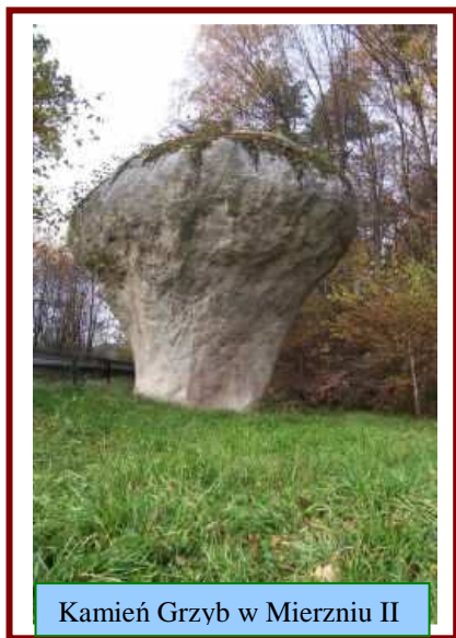
Kamień Grzyb w Mierzni II

Diabli Kamień położony jest w odległości około 1 km na południe od szczytu Wału i 300 m na zachód od przebiegającego jego północnym zboczem żółtego szlaku turystycznego z Siemiechowa.