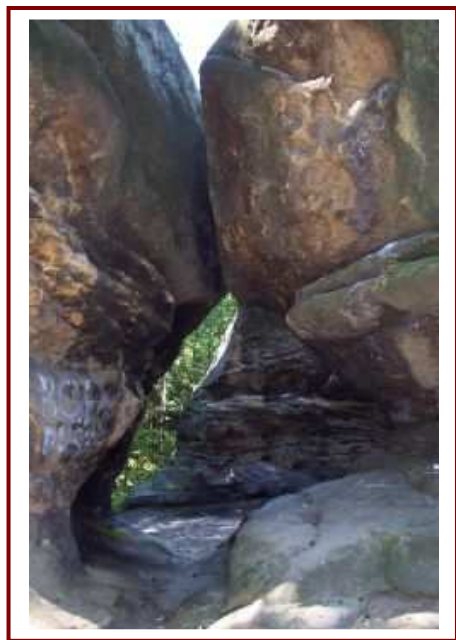
Korytarz w grupie grzybów Kamieni Brodzińskiego

Są to Diable Skały na Bukowcu i Kamień Grzyb na Bukowcu k/Wiśnicza, chronione jako rezerваты przyrody. Pomnikami przyrody są natomiast Diabelski Kamień koło Szczyrzyca, Diabli Kamień koło Folusza, Kamienie Brodzińskiego, Diable Boisko oraz grzyby w Zegartowicach i Tarnawie. Dziewięć scharakteryzowanych wychodni leży przy szlakach turystycznych, zaś jedenaście poza nimi. Sądzić należy, iż informacje krajoznawcze tu zawarte wzbogacą turystyczną wędrówkę na tym nietypowym i nieco egzotycznym przez swoją zawartość szlaku przyrody nieożywionej.