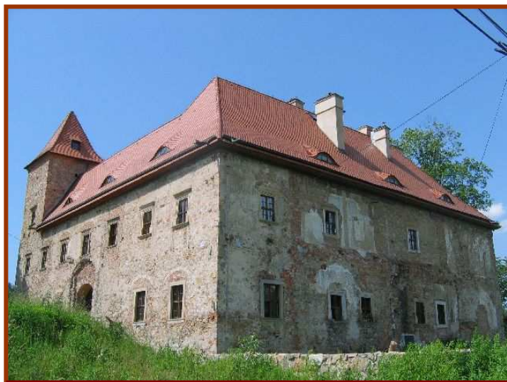
Dwór Czarne w Jeleniej Górze

RADZIWIŁÓWKA. Trzyszczytowe wzniesienie 465 m nad Jedlicą, tworzące zwężenie jej doliny wspólnie z będącym na drugim brzegu Brzeźnikiem 555 m. Nazwa odosobowa od nazwiska ks. Antoniego Radziwiłła, pierwszego polskiego właściciela góry i folwarku. Niewiele mamy w Sudetach obiektów posiadających polskie nazwy odosobowe z takim rodowodem. Dlatego ta nazwa zasługuje na wyróżnienie.