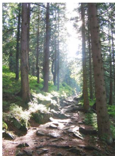
Na szlaku pod Pilskiem.