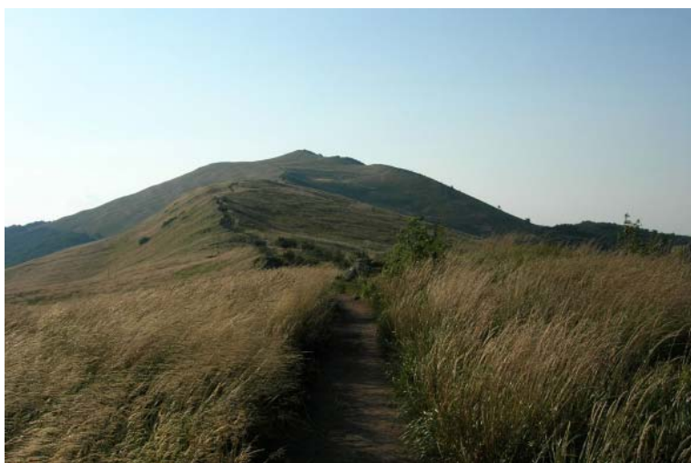
Połonina Wetlińska.

a dasz mi wieczną młodość białego motyla