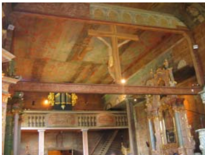
Wnętrze kościoła w Haczowie.

Krynica ze swoją ponad 200-letnią historią w pełni zasługuje na określenie - „perła polskich uzdrowisk”. Znana jest w Polsce i za granicą z malowniczego położenia w Beskidzie Sądeckim, w dolinie Krynicy i jej dopływów, i niemniej malowniczych krajobrazów, niepowtarzalnego klimatu, licznych zabytków architektury uzdrowiskowej i mnóstwa obiektów leczniczych. Przede wszystkim jednak jej największym skarbem są źródła wód leczniczych, odkryte w XVII w. i eksploatowane do dziś. Któż nie zna lub nie słyszał o „Krynicy”, „Zuberze” czy „Wodzie Jana”. Krynicyckie szczawy są wręcz niezastąpione w leczeniu chorób układu trawienia, układu moczowego, cukrzyca, otyłości, chorób kobiecych, układu krążenia, narządów ruchu i reumatycznych czy wreszcie chorób układu oddechowego. Na miejscu czynne są cztery pijalnie, w których chorzy serwują sobie wodną kurację. Jedna z nich mieści się w renesansowym Starym Domu Zdrojowym, druga – w Parku Zdrojowym, trzecia – w Parku Słotwińskiego; czwarta to Pijalnia Główna. Stosunkowo od niedawna do Krynicy gromadnie zjeżdżają także panie, aby na farmie piękności – w nowoczesnym ośrodku dr Ireny Eris – pielęgnować i utrwalać swą urodę. Kto nie leczy się – wali zimą do Krynicy na narty. Stoki są tu