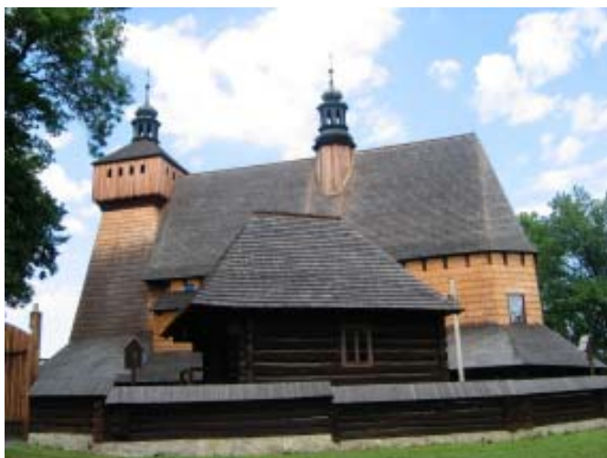
Kościół w Haczowie – z listy Światowego Dziedzictwa UNESCO.