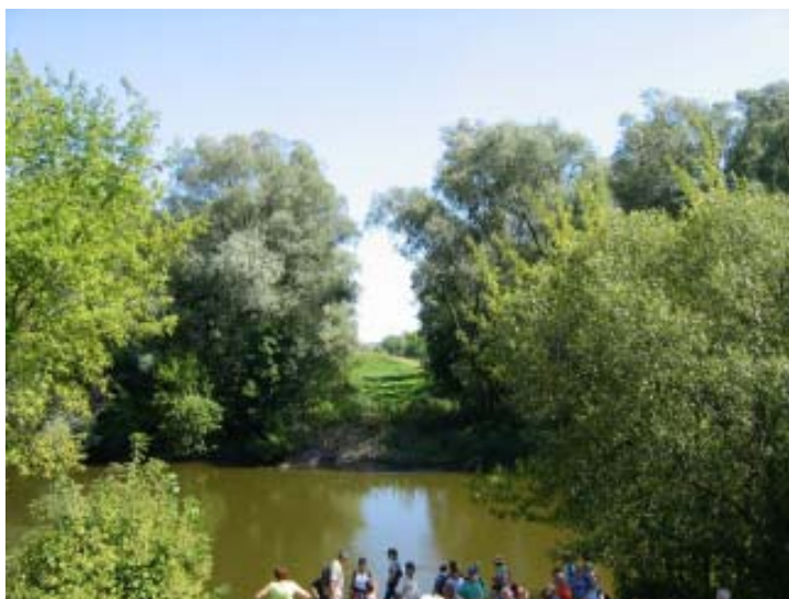
Był tu most... dziś za Bugiem leży Białoruś.