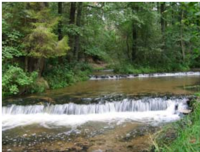
Szумы na Tanwi.