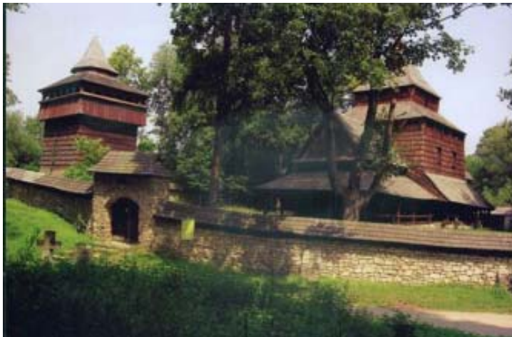
Zespół cerkiewny RADRUŻ.

Na północ od Horyńca leży wieś Werchrata z murowaną cerkwią przypominającą sylwetką bazylikę Św. Piotra w Rzymie. Nieopodal w lesie znajdziemy zaś resztki prawosławnego sanktuarium oo. Bazylianów na terenie nieistniejącej już wsi Monastyrz. Zaś na wschód od Werchraty leży wieś