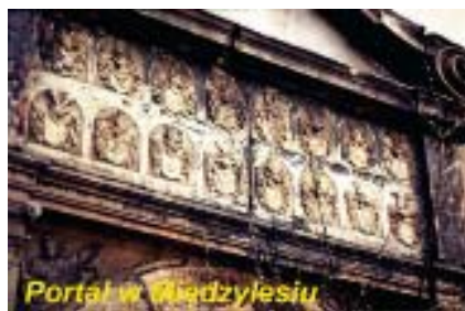
Portal w Międzyzlesiu