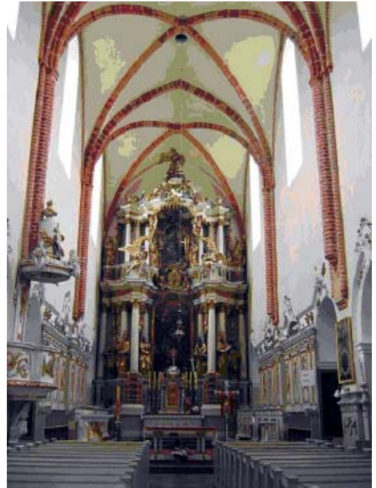
Wnętrze kościoła w Gościkowie-Paradyżu