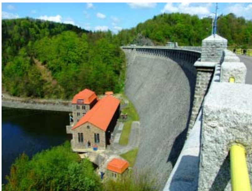
Tama na Bobrze w Pilchowicach.

nie popisała się KUNM z wałbrzyjskim ‘galgenbergiem’, którego obdarzono nazwą „Góra Powstańców” (sic!!). Licząc ostrożnie, tych szesnaście toponimów stanowi co najwyżej 30% wszystkich obiektów topograficznych w Sudetach o nazwie ‘Galgenberg’ lub pochodnej: Galgen Erlich, Galgen Heide, Galgen Hübel, Galgen Höhe, Galgen Grund, a nawet Galgen-wiese. Dla przykładu w Górach Kaczawskich wprowadzono dwie nazwy urzędowe: Głogowiec i Dudziarz, podczas gdy mamy tam aż siedem toponimów egzekucyjnych o nazwie ‘Galgenberg’. W tej sytuacji powoływanie się przez Trzcinińskiego na powojenne polskie nazwy i wyciąganie z tego wniosków jest zaska-