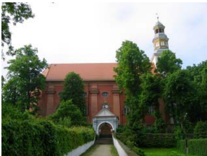
Kościół w Starych Bogaczowicach

Teraz w lewo dróżką w wyraźnym zakłęśnięciu i tuż pod grzbieciem dróżką w prawo. Zaraz pojawia się szlak żółty. Nim w lewo w dół do podwójnego rozdroża w szerokim siodele zwanym Skrzyżowanie Siedmiu Dróg (2.40 godz.). Stąd do Bolkowa 4.30 godz., z prawej dochodzą zn. zielone z Marciszowa. Dalej żółtym 25 min na szczyt, stromiejącą ścieżką, z której miejscami panorama, dość ograniczona, na Chelmiec, Borową, w lewo na Wałbrzych, na horyzoncie Góry Sowie. Po 30 min wchodzimy na siodło między kopułami: z prawej schodzi szlak niebieski z Przedniego Garbu (757 m). Teraz wszystkie trzy podchodzą w 5 min na najwyższy wierzchołek masywu (3.15 godz.).