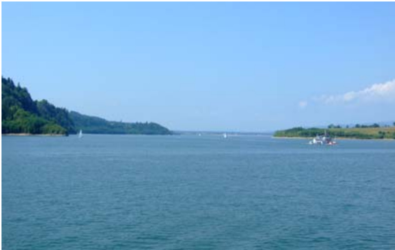
„Pienińskie morze”.

ków. Na terenach znanych niegdyś jako Ruś Szlachetowska ślady przeszłości zachowały się w drewnianym budownictwie – szczególnie ciekawy jest XVIII-wieczny kościół, użytkowany obecnie jako świątynia katolicka. Podobnie, jak w bieszczadzkiej Dukli, tam także kończy się droga. Rozległe, słabo zaludnione tereny, czyste górskie potoki, pasące się stada owiec – po gwarnej Szczawnicy Jaworki wydają się oazą spokoju. Uroki tego miejsca docenili także artyści – kilka lat temu powstała „Muzyczna Owczarnia”. Stary budynek urządony w oryginalnym góralsko-artystycznym stylu służy jako dom pracy twórczej, w prawie każdy letni weekend odbywają się też tam koncerty znanych wykonawców reprezentujących różne gatunki muzyczne. W tym rejonie znajduje się też dwa rezerwaty krajobrazowe. Na Białą Wodę, należącą już do Popradzkiego Parku Krajobrazowego, można wybrać się na relaksujący spacer wzdłuż potoku, wokół załamujących się malowniczo wapiennych skał. Wyprawa do Wąwozu Homole jest przeznaczona raczej dla osób nastawionych na górską wspinaczkę.