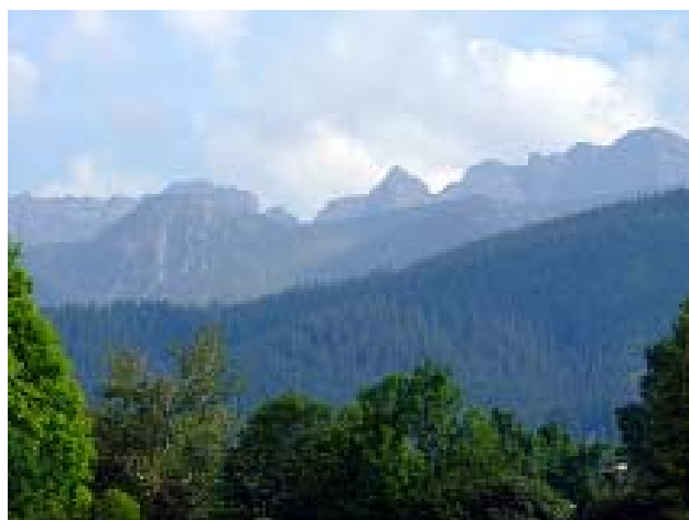
Tatry z Zakopanego.

Dwudniowy pobyt na terenie Węgier rozpoczęliśmy od wypadu nad Balaton. Jednak nie zrobiło na nas większego wrażenia to niezbyt czyste jezioro. Dotarliśmy jeszcze do malowniczej miejscowości Tihany, gdzie znajduje się malutki klasztor, miejsce pielgrzymek turystów. W Budapeszcie udaliśmy się natomiast na Wzgórze Zamkowe z cytadelą i Wzgórze Gellerta z ciekawymi Basztami Rybackimi.