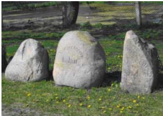
Pamiętkowe głązy w Nietoperku

Przyroda nie poskąpiła mu i jego okolicom swych obfitych darów. Rynna jezior łagowskich zalicza się do najpiękniejszych w Polsce. Wokół dorodne lasy, pełne grzybów i jagód, z dużym fragmentem lasu naturalnego. Łagów jest ulubionym miejscem pobytu wielu ludzi ze świata nauki, kultury i