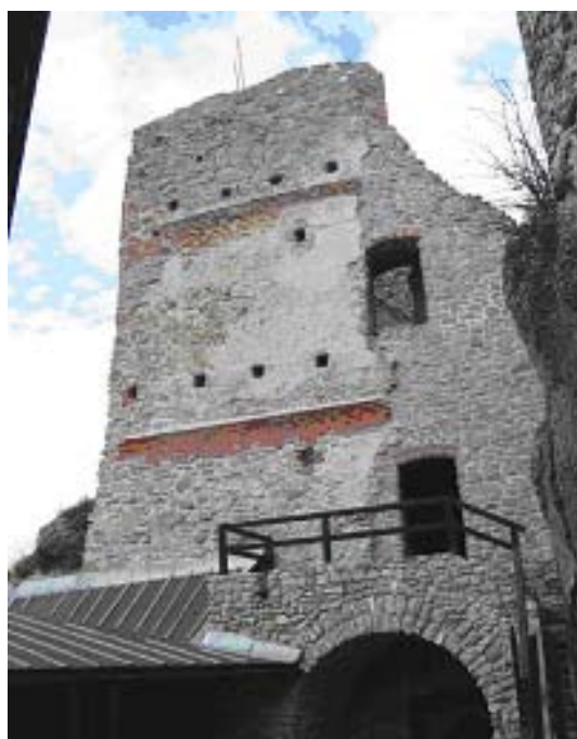
Fragment zamku Czorsztyn. Fot. Krzysztof R. Mazurski

Natomiast już parę kilometrów poza centrum, w Szlachtowej i Jaworkach, można poczuć się jak w Bieszczadach. Kresowy klimat tych miejscowości nie jest przypadkowy; do 1945 r. były one zamieszkałe przez Łem-