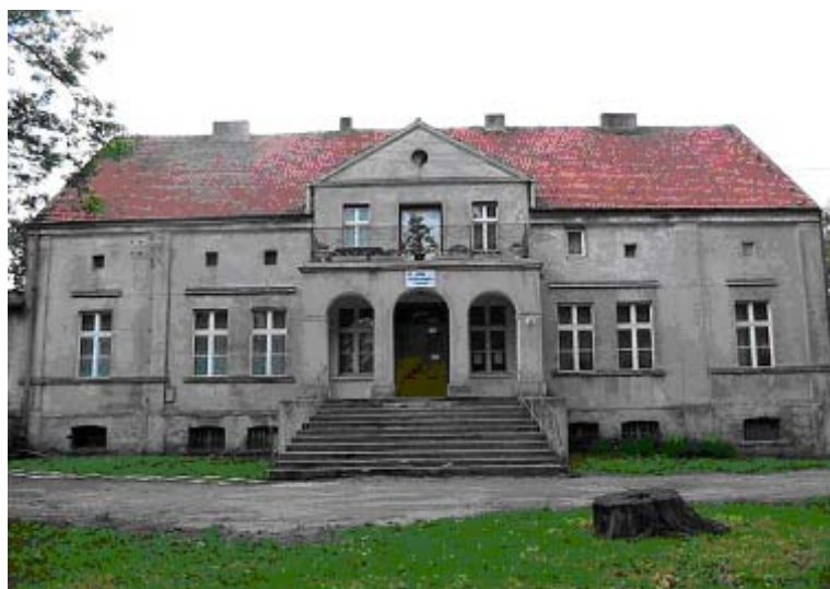
Gminne Centrum Informacji w Słaboszewku