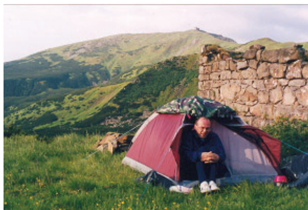
Rano na biwaku pod Popem Iwanem

W turbazie w Worochcie spotykamy „naszych”. Studenci z Krakowa przyjechali na trzy dni i chcieli szybko przejść główną grań. Trasą dokładnie jak my, ale jak doszli z Dzembronii przez Smotrecia na główną grań, to natknęli się na totalny brak widoczności i pogubiwszy ścieżkę wrócili z powrotem do Dzembronii. Tam cudem załapali się na „okazję” i dotarli do Worochty. Ponieważ w niedzielę musieli być w Polsce (był piątek), jutro wracają. Bagatela, przejechać 600 km, by wejść na pośredni szczyt! Mnie by trafił... nie powiem co.