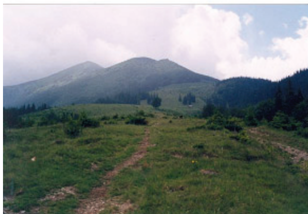
Pozegnanie ze Smotreciem