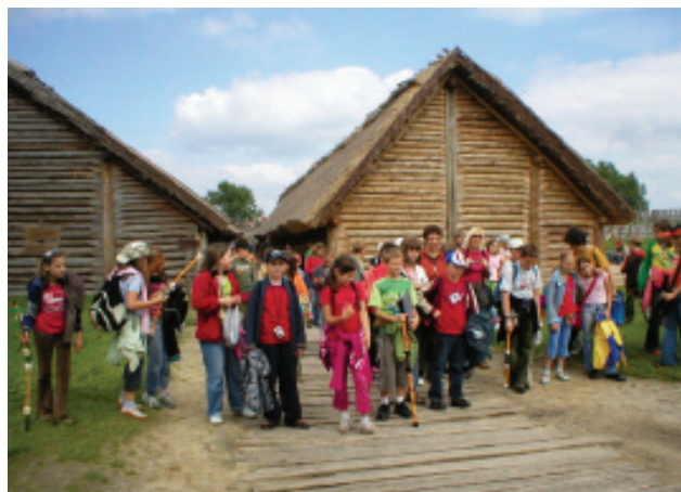
Muzeum w Biskupinie to cel licznych wycieczek szkolnych.

Należą do nich muzea i rezerваты archeologiczne: