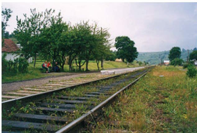
Uśpiona stacyjka w Łazeszczynie

Rano nie ma wody w kranie. Rzeka brudna, zatkało filtry. Faktycznie, Prut ma kolor kawy z mlekiem i to kawy ukraińskiej, czyli czarnogęstosmolistej. Odbieram samochód od miłych gospodarzy. Nawet zapalił bez problemów. Biorę butelkę wody ze studni (bez rannej kawy ani rusz!) i wracam do turbazy. Tam sympatyczna pani administrator nie ma wydać reszty z 50 hrywien za nocleg, biegam więc po dopiero co otwartych sklepach, ale nikt nie ma rozmiąć, bo w szufladach brak jeszcze utargu. Wracam i głośno domagam się reszty. Pani biegnie na górę po schodach i w końcu przynosi te 10 hrywien reszty. Żadne pieniądze, ale co tam, chcą do Europy, to niech się przyzwyczajają.