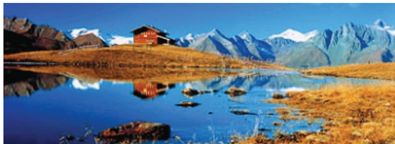
Widok z Parku Narodowego na Alpy we Wschodnim Tyrolu

T wierdzenie, że Austria jest krajem wędrówek, nie jest odkrywcze. Ale jeżeli powiemy, że ci, którzy odwiedzą Austriackie Wioski Wędrownie mogą odczuć „magię wędrowania...“, to jest to właśnie jedna z tych tajemnic, które należy zgłębić. Od siedemnastu lat Austriackie Wioski Wędrownie (Österreichs Wanderdörfer) należą do czołowych regionów urlopowych w Alpach. Każda z pięćdziesięciu tras wędrownych dzięki swojej niepowtarzalności oferuje wyjątkowe wrażenia wakacyjne i prawdziwy kontakt z przyrodą, która prezentuje się w całej swej krasie i niezatartym charakterze. Dla zapewnienia idealnego przeżycia każdemu miłośnikowi wędrówek w regionie Austriackich Wiosek Wędrownych istnieje sieć 40.000 km szlaków, które prowadzą od terenów nizinnych przez