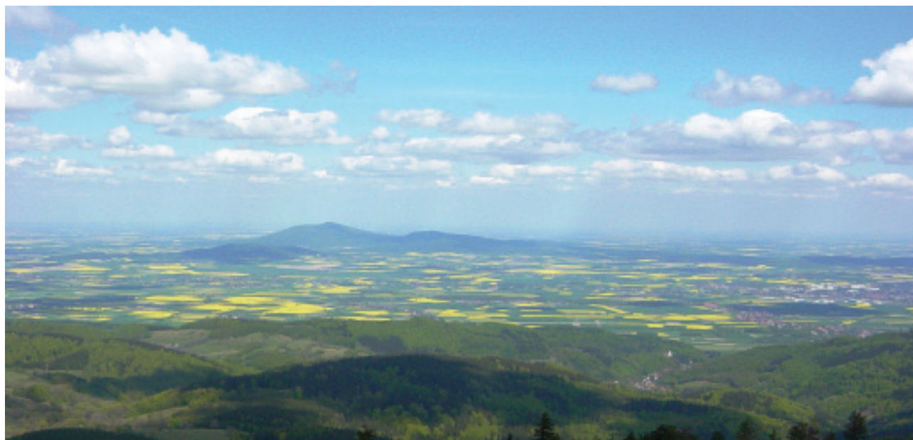
Widok na Ślęzę z wieży widokowej na Wielkiej Sowie w Górach Sowich.