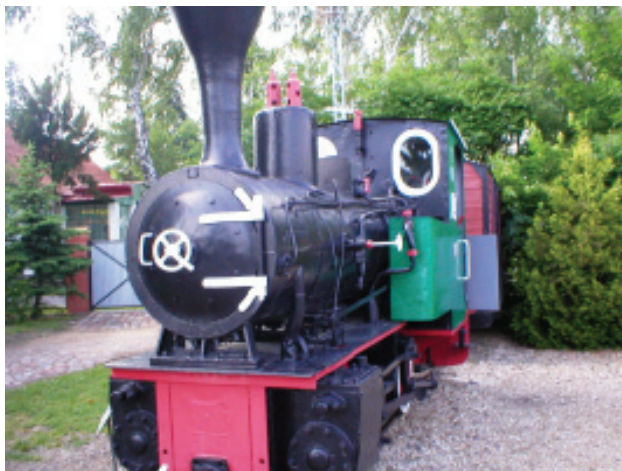
Muzeum Kolei Wąskotorowej w Wenecji.

Zabytki działalności gospodarczej i techniki wyróżniają się oryginalnością: