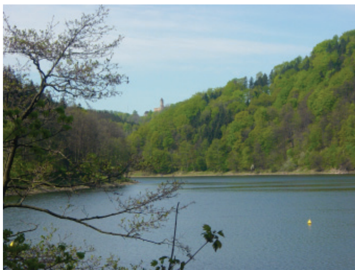
Zamek Grodno górujący nad Jeziorem Bystrzyckim.

Sztucznie połączone PTT i PTK utworzyły Polskie Towarzystwo Turystyczno-