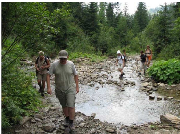
Przeprawa przez Lepietnicę.