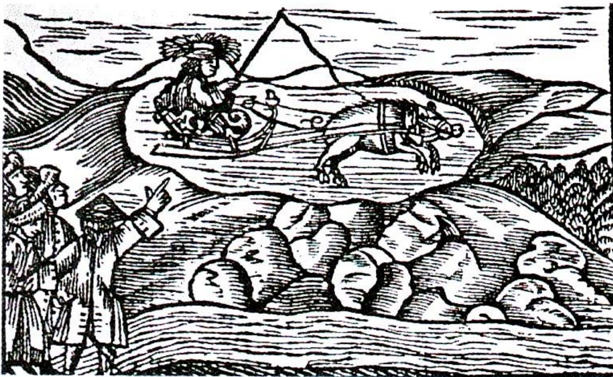
RYBECAL NA WIELKIM STAWIE (DRZEWORYT Z 1738 R.)

„Na Szlaku” - miesięcznik turystyczno-krajoznawczy. Czasopismo Oddziału Wrocławskiego PTTK,