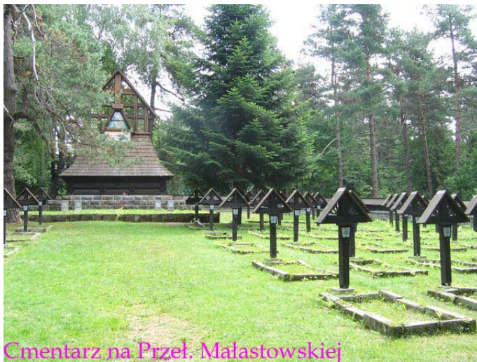
Cmentarz na Przeł. Małastowskiej

Kiedy podróżujemy w kierunku wschodnim od Nowego Sącza przez Grybów, Gorlice, Jasło, Krosno i Sanok w stronę Zagórza i Leska – wszędzie na południe od owej drogi rozciąga się Beskid Niski. Raz jeszcze zapraszam na tę wyjątkowo malowniczą ziemię.