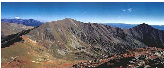
Bystra - na terenie Słowacji

Wspominając tę wyprawę, nie sposób zapomnieć niedospanych nocy w zakopiańskim Domu Turysty