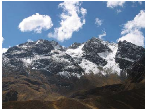
Na andyjskim szlaku

Dolina stromieje, wjeżdżamy na przełęcz 4350 m, gdzie fotostop i kolejne nabytki u przydrożnych Indian. Teraz jazda w dół i za Sicuani wciskamy się do Raqchi, na uboczu którego wznoszą się fragmenty, ale jakże imponujące, inkaskiej świątyni Wirakoczy.