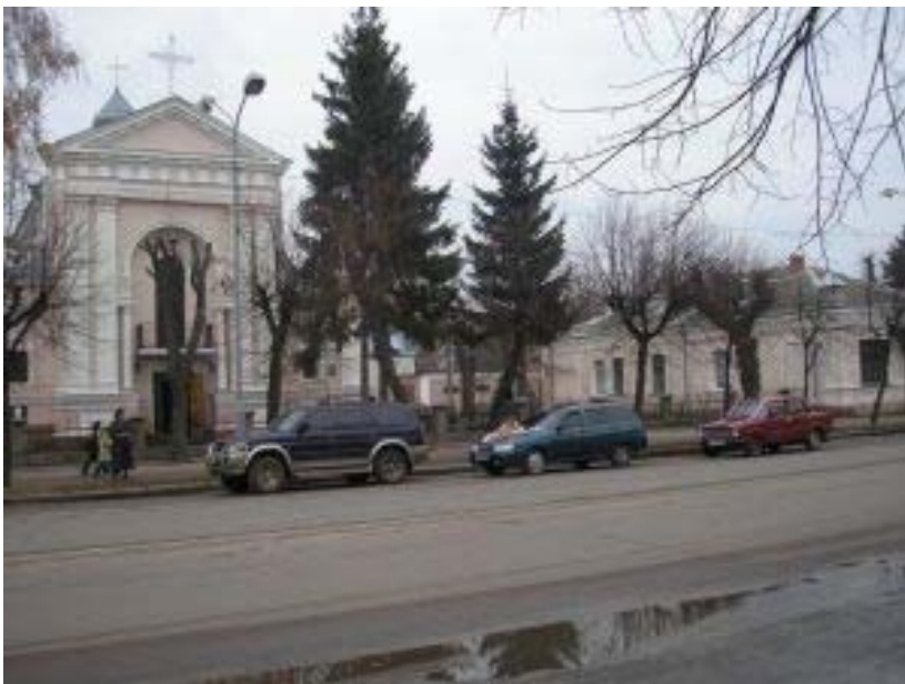
Z lewej kościół św. Barbary, po prawej Biblioteka

„Družba” do takowych zaliczyć by można: malutki pokoik za 102 hrywny (ok. 67 zł), koszmarnie zimny, obskurny, smrodny; łazienka z obrzydliwym sedesem, krzywą umywalką i typową zapyziałą „siedzącą” wanną. Ale jest „czarno-biały” telewizorek bez pilota, lampka nocna, a nawet telefon; i „kołchoźnik” na ścianie wisi, a jakże. Tylko umyć się chłodną porą trudno – według zapowiedzi zajętej chyba wyłącznie oglądaniem seriali dyżurnej „poziomowej” ciepła woda powinna być (za dodatkową opłatą) od 18.00 do ? i od 6.00 do 9.00. Nic z tego, mimo czekania – zgodnie z instrukcją, około ? godz., nim ta właściwa popłynie!