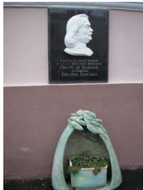
Tablica z Balzakiem