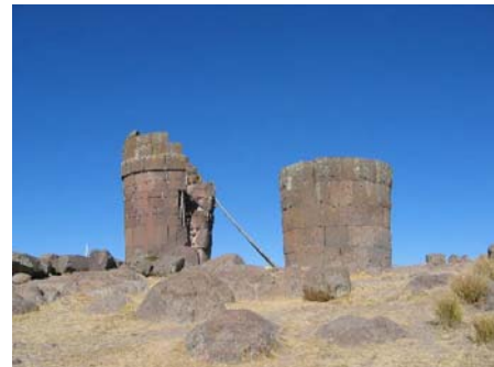
Grobowce w Silustani

Takie okazje trzeba uczcić – w hotelu czy lokalu, specjalnym trunkiem, który stał się wręcz narodowym. Na szczęście, pity w małych ilościach, przy lepszych obiadach lub na powitanie w hotelach. To pisco , powstałe w czasach pierwszych kolonistów, którzy próbowali zaprowadzić tu uprawę winnej latorośli. Nie udawało się jednak zrobić wina, wychodził raczej ocet niż ten szlachetny trunek. Zaczęto więc go ulepszać i na drodze eksperymentów ustalono główne składniki, przede wszystkim sok z limonki. Na to nakładana jest jakby czapeczka z ubitej pianki jajecznej, lekko posypanej cynamonem. Smak oryginalny – kwaskowo-słodki, barwa jasnołazurowa. Moc – trudno powiedzieć, gdzieś trzydzieści parę procentów. Dużo tego nie można wypić, ale może potrzebny jest do tego trening?