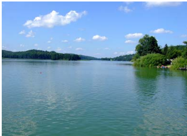
Jezioro Ostrzyckie.

wi oliwskiemu pięć wsi: Plawno (Chmielonko), Ostrzyce, Skowarcz, Dzierżążno i Wadzino. Choć większość badaczy dokument ten uznaje za falsyfikat, to jednak nadania te w większości zostały w okresie późniejszym potwierdzone. Wątpliwości budzić może jedynie fakt, czy chodzi o Ostrzyce i Dzierżążno na Kaszubach. Niektórzy prezentują pogląd, że może chodzić o Ostrowite, położone na Żuławach Steblewskich, na wschód od Skowarza (również darowanego cystersom), leżącego przy drodze Gdańsk – Tczew, lub też o Ostrowite, koło Pieniążkowa w pow. tczewskim. Także w przypadku Dzierżążna mogło chodzić o wieś położoną koło Morzeszczyna w pow. tczewskim.