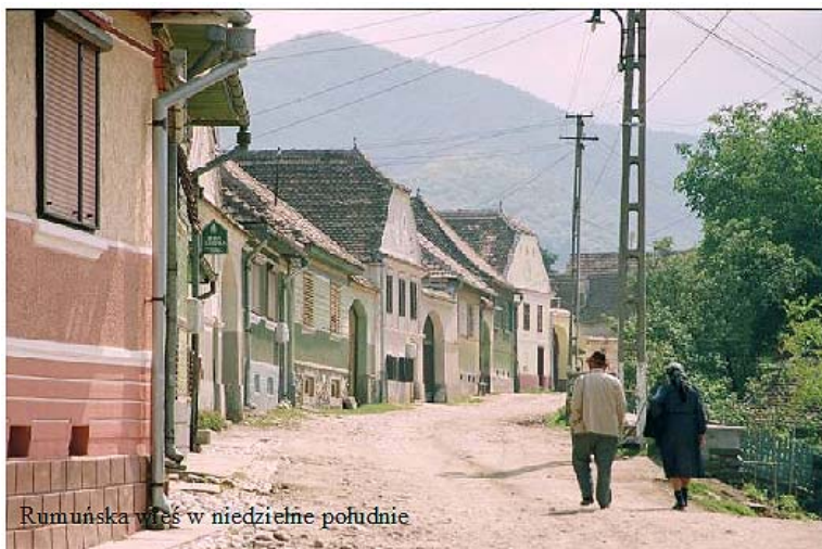
Rumuńska wieś w niedzielne południe

Fogaraska wioska Sebeșu de Sus wita nas niedzielną atmosferą. Atmosferą, której próżno by szukać u nas, chociaż jeszcze kilka lat temu chodząc po naszych górach ją spotykałem. Być może atmosferę czyni nie senność, ale architektura tego miejsca. Zwarta zabudowa gospodarstw i do każdego na podwórzu wiedzie brama. Podwórza brukowane, zwieńczone girlandami dojrzewających winogron. Bogactwa nie widać, ale wszędzie czysto i schludnie. Podjeżdżamy pod bramę domostwa, któ-