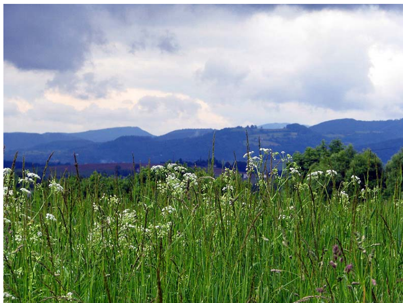
Widok od południa na Pasma Stożka i Czantorii

Fatalna pogoda spowodowała odwołanie planów wycieczkowych i zamiast powędrować w piątkowe przedpołudnie na Wielki Połom spędziliśmy je bardzo pracowicie nad mapami. Pewną atrakcją