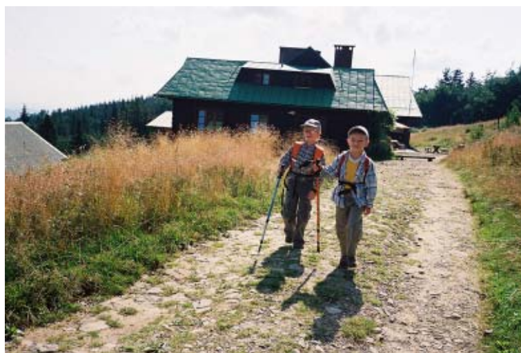
Wymarsz z Łabowskiej