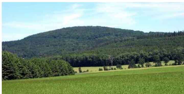
Nowosielska Kopa (383 m)

ze szlak zielony (od st. kol. Henryków na w miarę ruchliwej linii Wrocław – Kłodzko), na który weszliśmy za szosą, biegnie górą. Teraz wygodną drogą w mieszanym lesie, by po 15 min natknąć się na poprzecznie prowadzone zn. czerwone Ziębice – Strzelin. Teraz w lewo i po 10 min przekraczamy szosę Henryków – Przeworno, jak i inne tu mało uczęszczaną. Krótka w prawo i zaraz w lewo, znów w las. Lekko wznosimy się, ale najczęściej dość równo, niemal cały czas prosto na północ. U skrzyżowania osiągamy kamienny stół z ławkami (1.50 godz.). Odtąd łuki drogi stają się coraz głębsze, kilka niegroźnych podejść. Następuje szeroki trawers Buczka (335 m) ku zachodowi, podejście pod Kalinkę (386 m) i u jej podnóża napotykamy zn. niebieskie Przeworno – Witostowice – Henryków. Nimi w lewo i mijając też z lewej dwa wzgórza z trudnymi do odśledzenia grodziskami stajemy na szosie Witostowice – Przeworno. Kierujemy się nimi w lewo, zaraz kończy się las i przechodzimy przez przysiółek Zakrzów. Po 10 min jesteśmy znów w punkcie wyjścia.