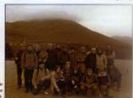
Najbardziej aktywny wyjazd był podjęciem na górę św. Patryka (Crawk Phibing 703 m n.p.m.)