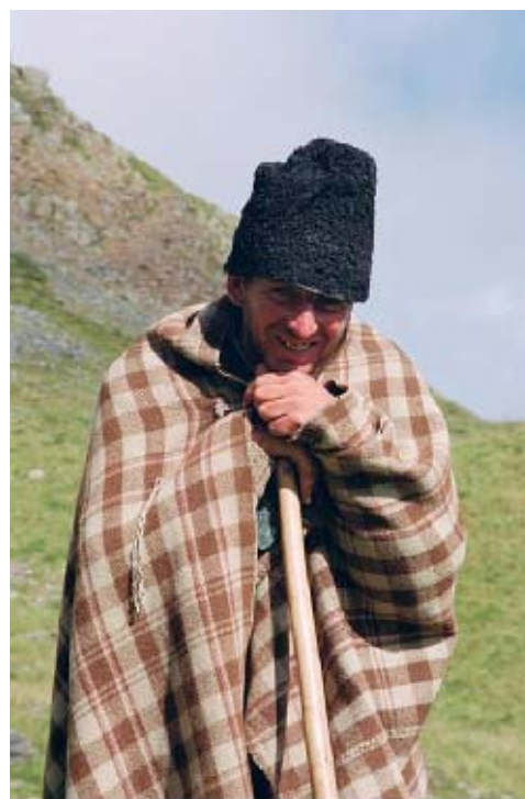
Rumuński, syn pacyczny autschien

Na południe natomiast rozciągały się pasma Karpat Południowych (Fogarasze są pierwszym górskim pasmem ograniczającym Transylwanię od południa. Wyrastają w płaskiej krainy na wysokość dwóch kilometrów, podobnie jak Tatry ponad Kotlinę Orawską). Linia horyzontu nad Transylwanią niczym praktycznie się nie różniła od tej nad morzem. Wyruszamy. Pogoda do wędrówki idealna: słońce, ale upału nie ma. Ale przecież mamy wrzesień i jesteśmy na wysokości ponad dwóch tysięcy metrów. Wędrówka odkrytą granią w tych warunkach pogodowych to prawdziwa przyjemność. W tej części Fogarasze przypominają nasze Tatry Zachodnie. Dochodzimy do jeziora Avrig. W okolicy pasą się owce, które w pewnym momencie przebiegają tuż przed nami. Na buli siedzi pasterz, wokół leniwie leżą jego pasterskie psy. Z lektury wiemy, że ich lenistwo jest pozorne, dlatego nie podchodzimy zbyt blisko. Pasterz jednak sam wstał i pomachał nam na powitanie. Psy były spokojne. Pasterz podszedł do nas i spytał, czy nie mamy papierosów. Tzn. podejrzewamy, że spytał, bo zrobił to w tylko sobie znanym języku. Daliśmy mu dwie paczki „popularnych”, i przystąpili do sesji zdjęciowej. Po tym miłym spotkaniu zeszliśmy nad brzeg jeziora. Gdzieś z gór spłynęły chmury. Artur, rozebrany do slipek, postanowił wziąć kąpiel: „ a bo to wiadomo. gdzie będzie następna okazja ”. Następni poszli dalej, czyli wzięli kąpiel bez slipek. Było to jedno z najprzyjemniejszych doznań w Fogaraszach!