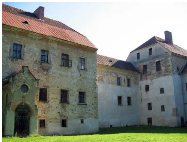
Dziedziniec zamku w Witostowicach

Wyruszamy z przyst. PKS w Witostowicach (tu można też zostawić samochód, jako że wędrówka ma charakter okrężny). Od niego odchodzi dróżka do arcyciekawego zamku z XIV w., otoczonego dwiema fosami i wałami. Jakiś czas temu prywatny nabywca (pewien wrocławski architekt) rozpoczął jego remont, ale nie przebiega on zbyt szybko. Krótka szosa w górę wsi cienistą aleją i przy niewielkim krucyfiksie z lewej skręcamy w pełną drogą w prawo. Teraz długo prosto, niemal poziomo – uwaga: po deszczu mokro, miejscami gęsta trawa! Z lewej ciemny grzbiet Wzgórz Strzelińskich, z prawej – widoki na