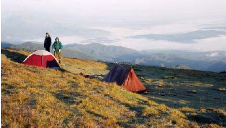
Poranek na przełęczy Surului