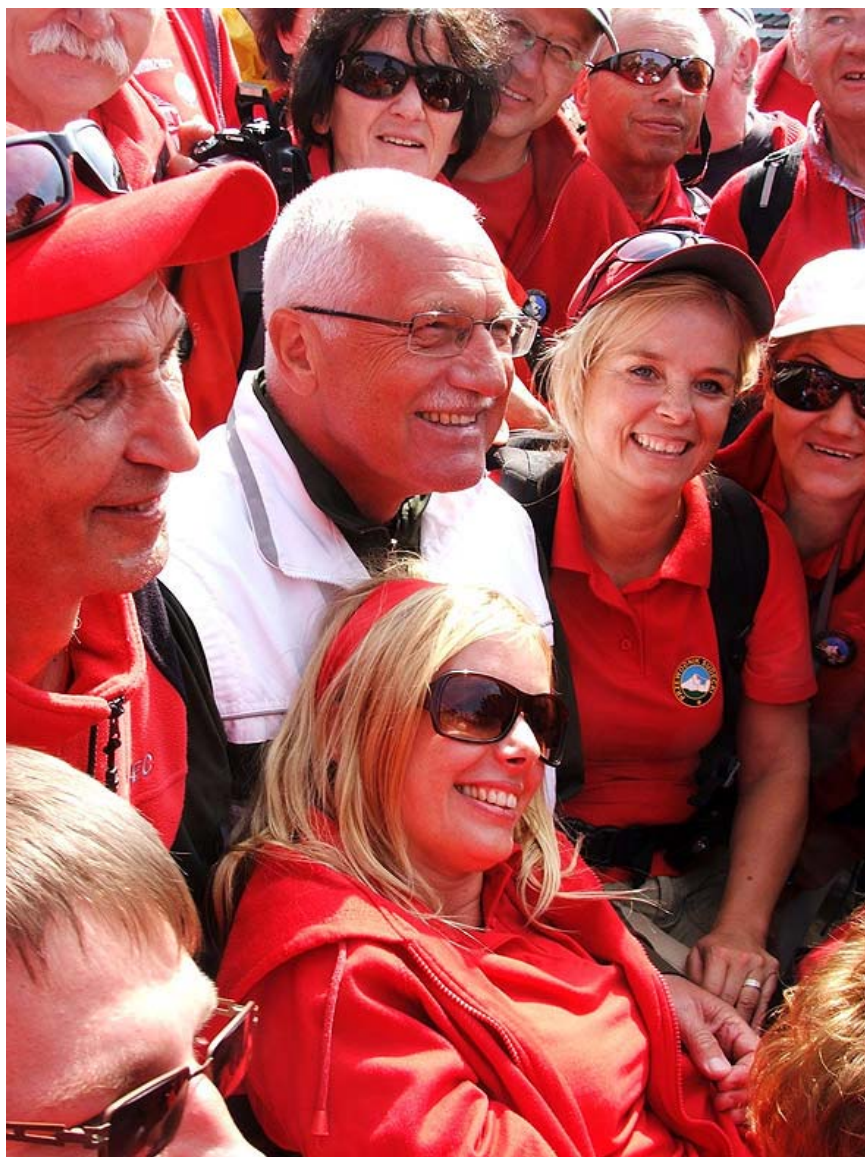
Vaclav Klaus w otoczeniu sudeckich gwiazdek przewodnictwa na Śnieżce 10.08.2009 r.