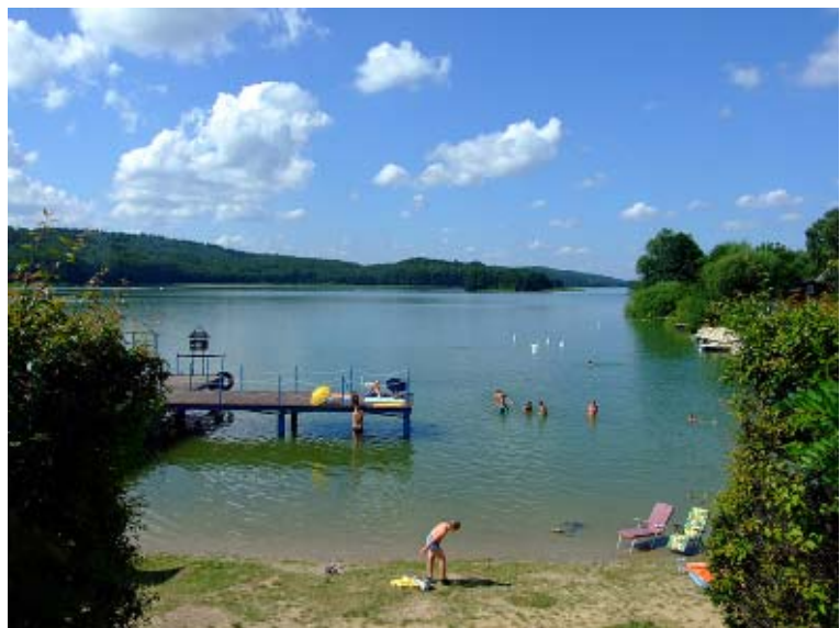
Przystań i plaża w Ostrzycach.

Wieś o nazwach Wostriza , Hostrose , Ostricz wzmiankowana była jako własność cystersów już w pierwszej połowie XIII w. Dokument z około 1215 r. podaje, że książę Subisław darował klasztoro-