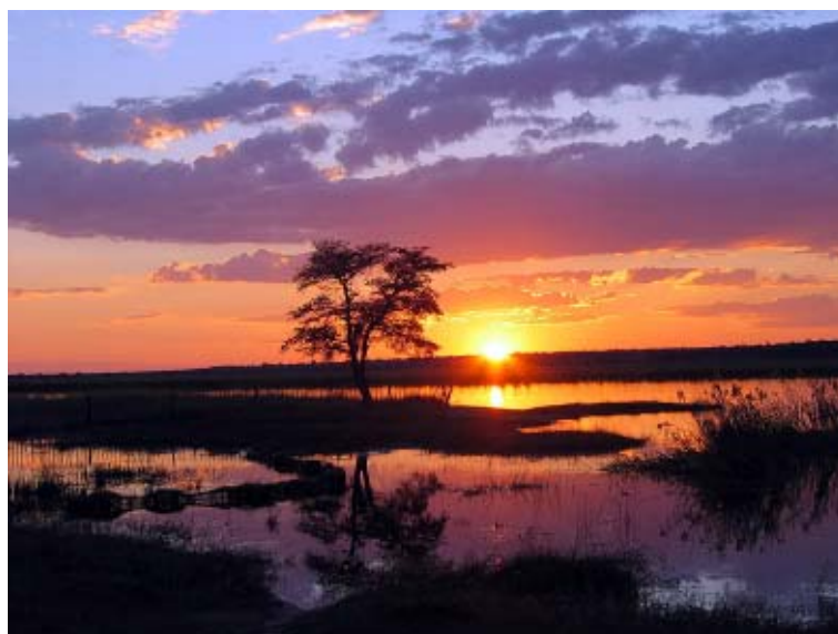
Namibia – i tu coraz częściej bywają Polacy.

Przyszłością mogą się okazać dalekie kierunki, jak właśnie Wyspy Zielonego Przylądka, Goa, tam ceny zaczynają się już nawet od 2500 zł, czyli tyle, ile kiedyś płaciliśmy za wycieczkę do Egiptu.