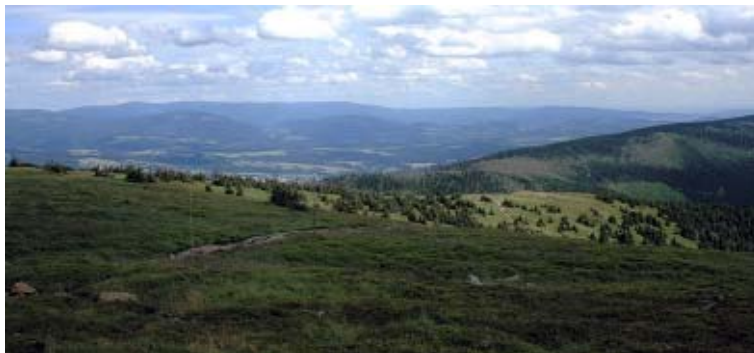
Widok ze Śnieżnika

Na drugi dzień Ziemia Kłodzka przywitała nas mglistą, deszczową pogodą. W tym dniu udaliśmy się szlakiem zielonym do pobliskiego Karłowa, skąd zamierzaliśmy się dostać autobusem do Dusznik-Zdroju i dalej szlakiem czerwonym do Zieleńca. Niestety, spotkało nas kolejne niemiłe rozczarowanie: okazuje się, że PKS ani inny przewoźnik nie jeździ na trasie Karłów – Duszniki-Zdrój. W tej sytuacji zmuszeni byliśmy wrócić do Kudowy-Zdroju, skąd autobusem pojechaliśmy do Dusznik-Zdroju, jednak nie dojeżdżając do samego miasta wysiedliśmy na przełęczy Polskie Wrota i drogą jezdnią poszliśmy w kierunku Koziej Hali, by następnie szlakiem czerwonym dojść do Zieleńca, a właściwie do schr. PTTK Orlica, gdzie zakończyliśmy dzisiejszą wędrówkę. Tego popołudnia mieliśmy jeszcze zaplanowane wejście na Orlicę, bądź zwiedzanie Torfowisk Pod Zieleńcem, jednak warunki atmosferyczne – duży deszcz i mgła, nie zachęcały do wędrówki. Z tego Schroniska nie mamy już tak pozytywnych wrażeń, jak z poprzedniego, męska część obsługi nie dorosła jeszcze, by pracować w usługach – jest nieuprzejma, sprawiająca wrażenie wiecznie niezadowolonych. Wydaje mi się, że jeżeli prowadzi się Schronisko, to powinno być się troszkę