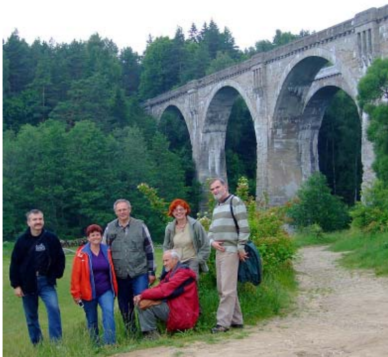
Przy mostach w Stańczykach