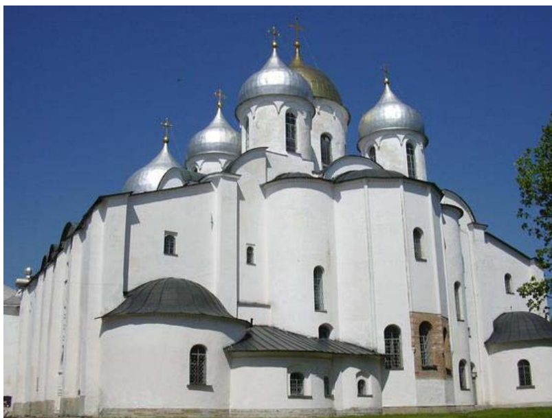
Sobór Świętej Sofii w Nowogrodzie Wielkim