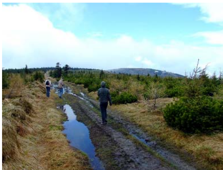
Góry Izerskie w maju.

Z Jakuszyc już tylko w dół drogą krajową do Szklarskiej Poręby. Późna godzina spowodowała, że na dystansie około 10 km mijają nas tylko dwa auta. Około godz. 22.30 docieramy do ośrodka, a 10-kilometrowy zjazd w dość niskiej temperaturze panującej o tej porze daje się we znaki i wszyscy jesteśmy zmarznięci. Mimo to uśmiech nie schodzi nam z twarzy. A widok kiełbaski jest tym, o czym marzyliśmy od chwili, gdy skończyły się kanapki oraz batony. Po to właśnie tutaj przyjechaliśmy. Żeby uciec z Wrocławia, odpocząć od studiów i tłumów ludzi w tramwajach. Po to, by poczuć smak kiełbaski, która smakowała jak nic innego od naprawdę długiego czasu... Góry Izerskie są wspaniałą krainą do jazdy rowerem. Satisfakcję znajdują tu zarówno wytrawni kolarze górscy na profesjonalnym sprzęcie, uwielbiający kamieniste drogi i trudne technicznie odcinki, jak też miłośnicy spokojnej jazdy w ciszy, spokoju i pięknym krajobrazie. Zaprezentowana trasa została pokonana na rowerach górskich, a niektóre jej fragmenty mogą sprawić dużą trudność osobom początkującym. Pokonana odległość – ponad 75 km, jest również wymagającym kondycyjnie dystansem.