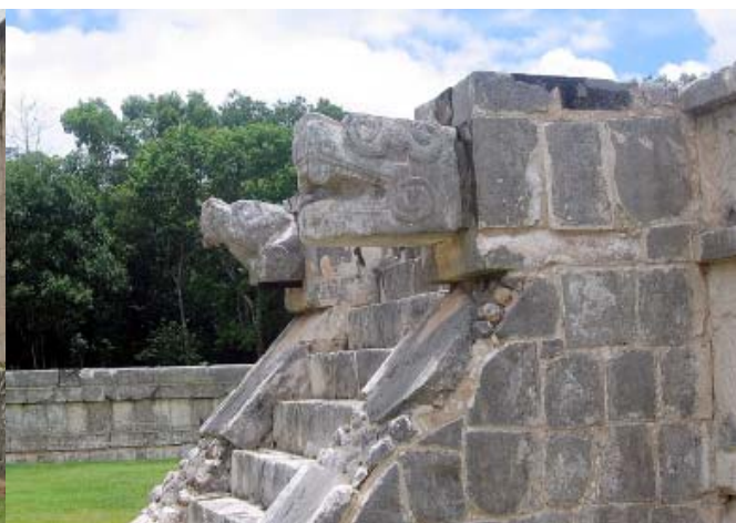
Głowy węża pierzastego

cie jaguara. Zwierzę te patronuje innej świątyni, w której zachowały się freski ilustrującymi chyba zdobycie Chichén Itzy przez Tolteków. Ponure wrażenie wywołuje tzw. Ściana Trupich Czaszek w Platformie Tzompantli. W całym zespole wyróżnia się niezwykła konstrukcja, którą uznano za Obser-