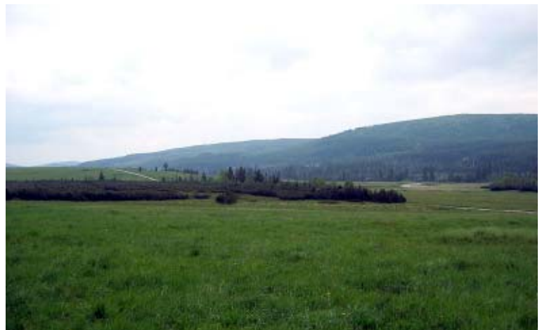
Spokojna przestrzeń Hali Izerskiej

Na wielu polskich mapach i przewodnikach (zwłaszcza starszych) widnieje nazwa „Na Kobyle”. Oznacza ona... Kobylą Łąkę. To jeden z wielu potworków nazewniczych w Górach Izerskich. Nic nie uzasadnia takiego określenia – Kobyła Łąka leży u stóp Kobyły-góry, nad Kobylą-potokiem. Czescy sąsiedzi małą osadę, leżącą kilka kilometrów na południe, nazywają „Na kobyle” (niem. Kobelhütte – Kobel-Chata), lecz polską Kobylą Łąkę zwą Koblovy Domky (Kobyłowe Domki). Zresztą oba miej-