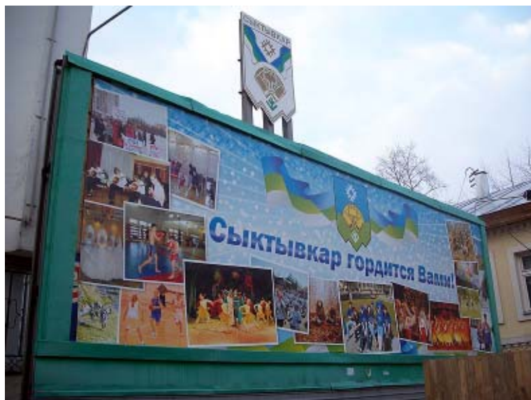
Miejska tablica wyróżnień

skiego, z grupy ugrofińskiej. Większość w republice stanowią prawosławni, głębiej w tajdze mieszkają staroobrzędowcy. Od czasów neolitu, gdy na tereny te przenikły plemiona znad Kamy i Wołgi, podstawą bytu było myślistwo i rybołówstwo. Od XI w. Komi (zwani wówczas Permianami lub Zyrianami), prowadzili osiadły sposób życia, zajmowali się rolnictwem i hodowlą. Do dziś na północy kraju pasie się setki tysięcy reniferów. W XII, XIII w. byli w stosunkach lennych z księstwem nowgorodzkiem, w XIV w. – z moskiewskim. W końcu tego wieku Stefan Permski przeprowadził chrystianizację ludności. Oficjalnie kraj Komi został włączony w skład księstwa rosyjskiego