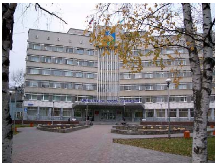
Merostwo w Syktywkaru

Ludność Komi posługuje się językiem, zbliżonym do fińskiego i węgier-