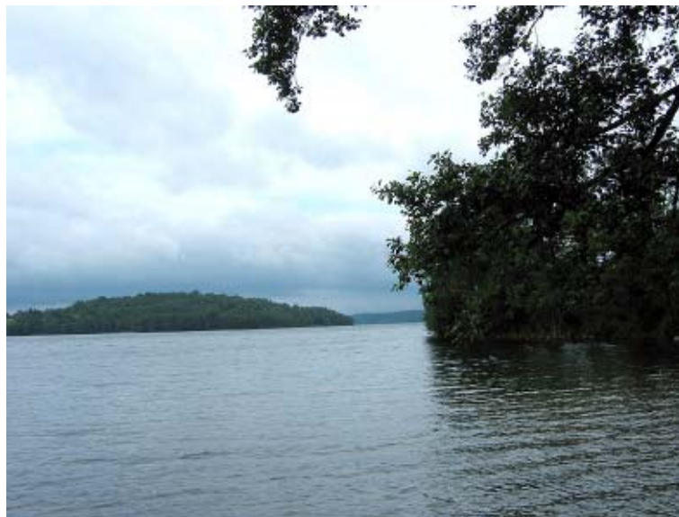
Jezioro Hańcza.