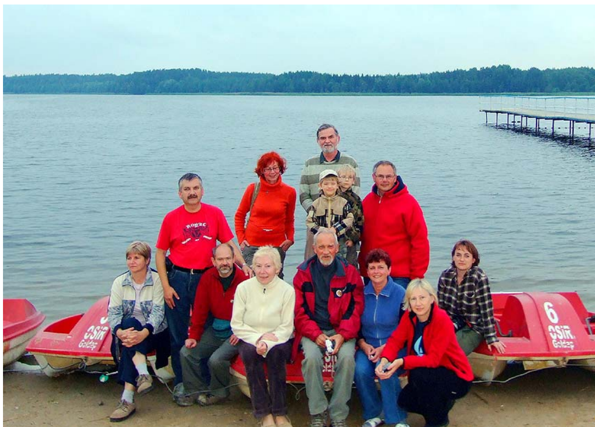
Uczestnicy Spotkania na plaży w Gołdapi