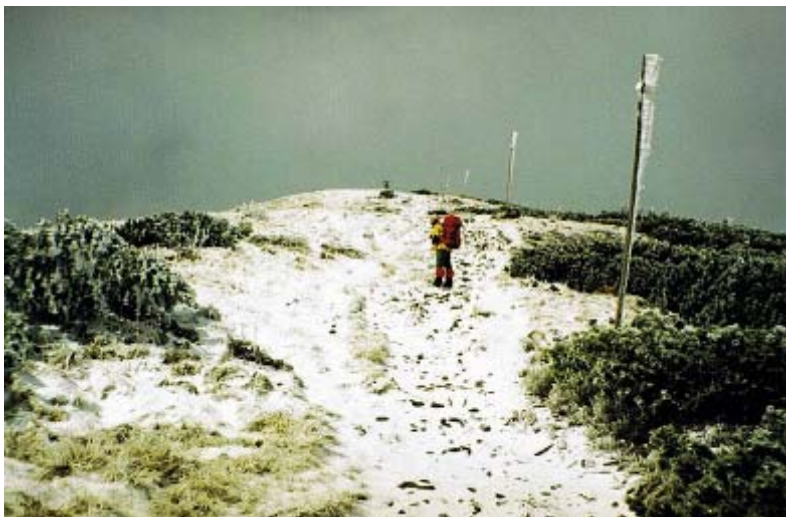
Majowa wycieczka na Babią Górę

Jako że największy ruch w górach przypada na soboty i niedziele, właśnie sobota 22 maja okazała się „bogata” w wypadki. A zaczęło się „w samo południe”. O 12.20 TOPR otrzymuje wiadomość o wypadku w Kotlinie Świńskiej. Spadł tam turysta z rejonu Przeł. Świnickiej. Przyczyna – poślizgnięcie. Godz. 13.30 – wypadek podczas zawodów rowerowych. Kolarz doznał urazu głowy na skutek upadku. Po południu kolejny wypadek, tym razem w pobliżu Wołowca. Do Wyżnej Chochołowskiej obsunął się po śniegu kolejny turysta. Przyczyna – poślizgnięcie. Chwilę później dwaj turyści powiadają TOPR, iż utknęli w trudnym terenie na Orlej Perci. Ratownicy sprowadzili ich po desancie śmigłowcowym w Koziej Dolince. W tym samym czasie kolejny wypadek, tym razem pod Rysami. Około 300 m spadał Rysą turysta, którego mocno potłuczonego zabiera do szpitala śmigłowiec. Przyczyna – poślizgnięcie. Godz. 16.50 – kolejny wypadek, kolejne poślizgnięcie w Świńskiej Kotlinie. Tym samym lotem helikopter zabiera z Boczania turystkę, która zasłabła. Nadchodzi wieczór. O godz. 19. następny wypadek w rejonie Świnickiej Przełęczy – coś pechowa ta przełęcz w tym roku dla wielu turystów. Kolejny 200-metrowy upadek po śniegu. Przyczyna – poślizgnięcie. Ciężko rannego turystę zabiera do szpitala helikopter TOPR.