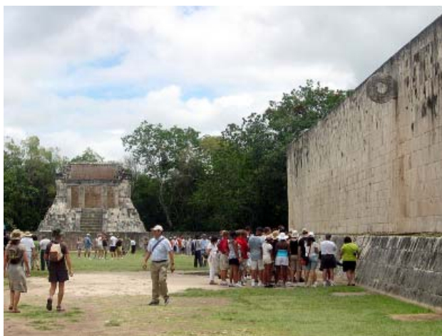
Boisko do pelote