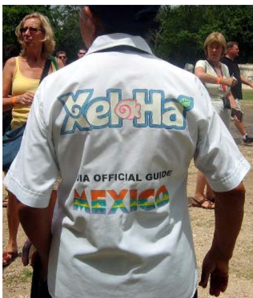
Strój licencjonowanego przewodnika

cie jaguara. Zwierzę te patronuje innej świątyni, w której zachowały się freski ilustrującymi chyba zdobycie Chichén Itzy przez Tolteków. Ponure wrażenie wywołuje tzw. Ściana Trupich Czaszek w Platformie Tzompantli. W całym zespole wyróżnia się niezwykła konstrukcja, którą uznano za Obser-