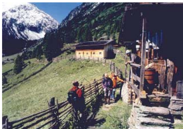
Na alpejskim szlaku.

Ybbstal i Ennstal , gdzie punktem startowym jest Waidhofen an der Ybbs, skąd szlak biegnie dalej przez Maria Neustift i Ternberg nad rzeką Enns do Molln. Trasę można przejść w trzy dni. Po drodze czekają piękne widoki, najpierw na dolinę Dunaju na północy, potem na Totes Gebirge i góry Sengsen na południu. Jej atutem jest łagodny przebieg przez lasy, górskie łąki przedgórzy Alp, przez region zwany Eisenwurzen ze względu na dawne wydobywanie rudy żelaza. Stare kuźnie świadczą o powszechnej w XIV w. obróbce tego kruszcu.