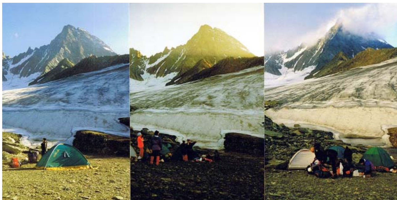
Biwak pod Grossglocknerem.