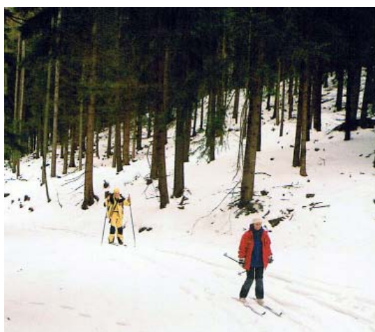
Na narciarskim szlaku

Dogodne położenie schroniska i możliwość skorzystania z tzw. skibusa (linia mikrobusowa łącząca Duszniki-Zdrój z Zieleńcem) pozwalały na szybkie dotarcie w rejon Zieleńca i wędrowanie po narciarskich terenach wokół tej miejscowości, także po znakomicie przygotowanych trasach w Czechach. Wielka Desztina i Orlica to wierzchołki, na których byli uczestnicy Spotkania. Do Zieleńca narciarze docierali także na nartach, by później wyruszać na szlaki Desztnej i Orlicy. Wędrowano w kilku zespołach wielo- oraz dwu- i trzyosobowych. Szlakami wędrowek były także górskie drogi w Górach Bystrzyckich, czyli na wschód od schroniska. Poprowadzone dolinkami i wyprowadzające na wierzchołki (Zbójnicka Góra), przetarte przez leśników, zapewniały łatwe podejścia i długie, szybkie zjazdy. Napotkaliśmy także wspinałą polanę przypominającą beskidzką halę. Posłużyła nam do zjazdów oraz jako wariant trasy omijający stromy odcinek czerwonego szlaku nienadający się do przebycia na nartach. Odwilż i nocny przymrozek pogorszyły nieco warunki na szlakach (lód) w sobotę, ale nie przeszkodziło to w narciarskich wycieczkach i, jak poprzedniego dnia, wszyscy wrócili z tras bardzo zadowoleni.