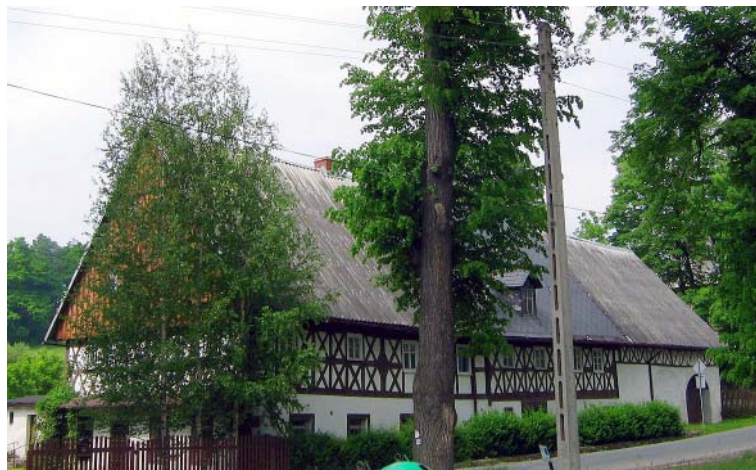
Karczma sądowa w Bukowcu

Zn. czerwone bieżą stąd szosą w lewo, na Wojków, my jednak kierujemy się z niewielkiego parkingu po przeciwnej stronie duktem w las, za dawnym przebiegiem tego szlaku. Po drodze sporo łąk, dzięki czemu podziwiać można Pogórze Karkonoskie, Góry Kaczawskie i Rudawy Janowickie. Po 10 min mija-