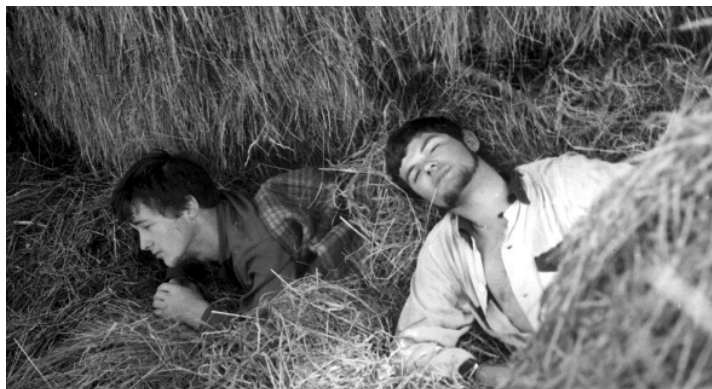
Spanie na sianie było całkiem fajne (Gdańsk 1963)

Może i stąd niechęć do PTTK? Tymczasem w Autostopie uczestniczyłem wielokrotnie w ogólniaku i na początku studiów. Przejechałem ponad 55 tys. km (wszystko mam zliczone w zachowanych z sentymentu książeczkach – chyba autorzy w ogóle ich nie widzieli), w tym dwa razy Polskę dokoła, przeżyłem wiele ciekawych przygód, poznałem wielu fajnych rówieśników. Nikt nie bał zabrać do samochodu, nie było kradzieży i pobić (poza sporadycznymi), gospodarze nie bali się wziąć na nocleg – nie tak, jak w dzisiejszej wolnej Polsce. I te wszystkie kłamstwa, tak ordynarne i prymitywne, dokonywane są za nasze, dla nich sute, pieniądze. Dziwić się, że coraz mniej osób płaci haracz w postaci abonamentu na „publiczną” telewizję? Jak długo to jeszcze będzie trwało?!