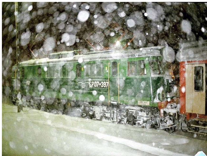
Lokomotywa elektryczna EP07-387 walczy ze śnieżną zamiecią.

Spišska Nova Ves – Kysak – 12.03.1872 r.