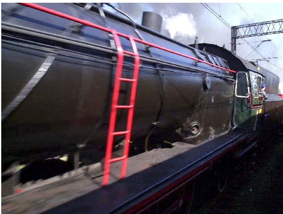
Pędzi parowóz Pt-47-65.

Ale powróćmy do początków budowy. Żeby wyobrazić sobie złożoność