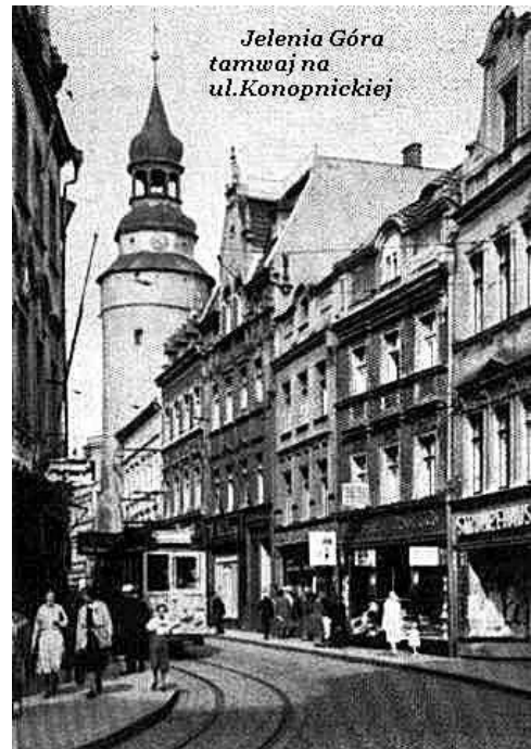
Jelenia Góra tramwaj na ul. Konopnickiej

Zapraszamy na Rodzinny Rajd Rowerowy. W tym roku mija czterdzieści lat odjazdu ostatniego tramwaju w Jeleniej Górze – nasze Towarzystwo Rowerowe w związku z tą rocznicą organizuje 1.05.2009 r. Rodzinny Rajd Rowerowy trasą linii tramwajowej – początek Dworzec Kolejowy PKP w Jeleniej Górze – zakończenie Pętla Tramwajowa w Sobieszowie. Więcej szczegółów o tej imprezie umieścimy w kwietniu na naszej internetowej stronie http://www.kolej.one.pl/fervojoj/LINIE/TRAMWAJ/JELENNIA/ZDJECIA.HTM . Majowa impreza to nie Maraton Rowerowy – tylko RODZINNY RAJD ROWEROWY. Zasada prosta – spotykamy się w umówionym miejscu i spokojnie, bez pośpiechu, przy okazji zaliczając poszczególne punkty po drodze, dojeżdżamy do celu. Tam planujemy wspólną zabawę. To początek Rodzinnych Rajdów Rowerowych. Tymi imprezami pragniemy zachęcić mieszkańców Jeleniej Góry – i nie tylko, do aktywniejszego spędzania czasu – przede wszystkim RODZINNEGO; po prostu bawmy się. Planujemy jeszcze w tym roku zorganizować rajd „Doliną Kamiennej” do Piechowic, „Doliną Łomnicy” do Karpacza i „Doliną Wrzosówki” do Podgórzyna.