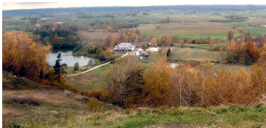
Panorama z Pięknego Góry koło Gołdapi

Zachęceni zeszłorocznym odnowieniem tradycji spotkań Czytelników i redakcji w terenie, zapraszamy na spotkanie, które odbędzie się 26-28. czerwca br. na dalekiej północy – aż w Gołdapi. Ci z Pomorza, Mazur, a nawet Mazowsza nie będą mieli zbyt długiej drogi. Miłośnicy gór nie stracą