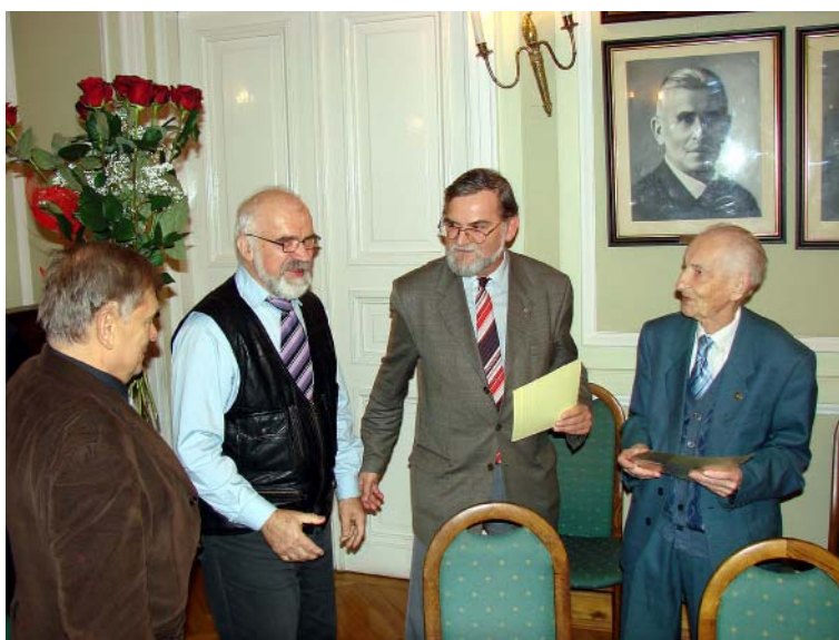
Komisja Krajoznawcza ZG PTTK także uczciła Jubilata – wieloletniego aktywnego jej członka