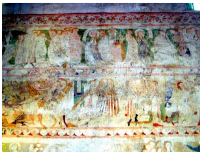
Freski w świerzawskim kościele