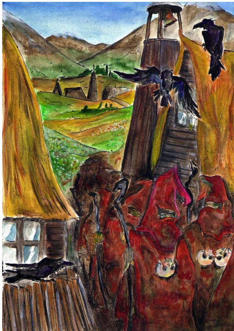
Akwarela Alicji Jachimowicz

Kiedy już schodził w stronę Karłowa, zaczął nasłuchiwać dochodzących do uszu cichych pojękiwań i szmerów. Zwolnił kroku i chowając się między świerkami najpierw spłoszył siedzącego na gałęzi puszczyka, a później zobaczył zjawisko, które zmroziło jego odwagę. Przed nim na drodze szedł powolnym krokiem orszak ubranych w długie kaftany ze spiczastymi kapturami postaci, trzymających w rękach długie kostury. Na ich piersiach wisiły na powroczach białe czaszki. Wyglądało to na procesję jakiegoś tajnego zakonu. Pierwszy z szeregu wędrujących podniósł rosochaty kostur i