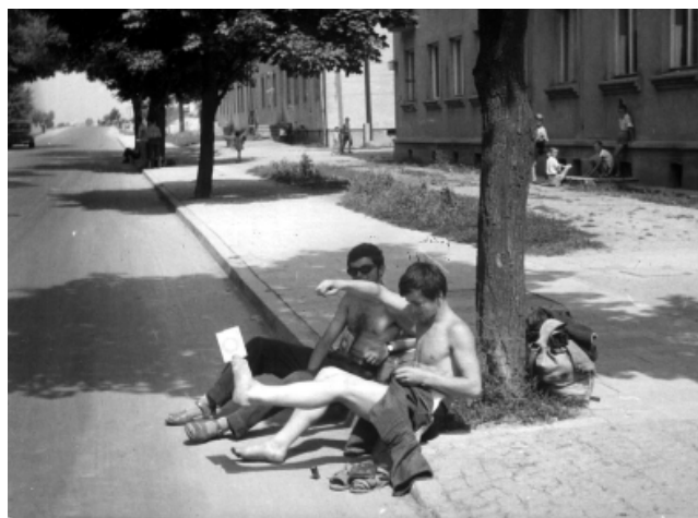
Oczekiwanie na życzliwego kierowcę zajmowało czasami kilka godzin (Płońsk 1963)

Może i stąd niechęć do PTTK? Tymczasem w Autostopie uczestniczyłem wielokrotnie w ogólniaku i na początku studiów. Przejechałem ponad 55 tys. km (wszystko mam zliczone w zachowanych z sentymentu książeczkach – chyba autorzy w ogóle ich nie widzieli), w tym dwa razy Polskę dokoła, przeżyłem wiele ciekawych przygód, poznałem wielu fajnych rówieśników. Nikt nie bał zabrać do samochodu, nie było kradzieży i pobić (poza sporadycznymi), gospodarze nie bali się wziąć na nocleg – nie tak, jak w dzisiejszej wolnej Polsce. I te wszystkie kłamstwa, tak ordynarne i prymitywne, dokonywane są za nasze, dla nich sute, pieniądze. Dziwić się, że coraz mniej osób płaci haracz w postaci abonamentu na „publiczną” telewizję? Jak długo to jeszcze będzie trwało?!