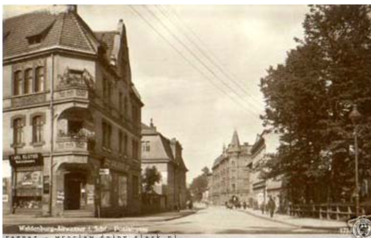
Budynek w latach 20. XX w.

D okładana data wybudowania tego obiektu nie jest znana. Przepuszczalnie budynek został wzniesiony w końcu XVIII lub w pierwszym ćwierćwieczu XIX w. w czasie, gdy uzdrowisko Stary Zdrój było znane w całej Europie. Pierwotnie najprawdopodobniej przeznaczony był on na pensjonat, o czym może przemawiać lokalizacja obiektu w sercu byłego uzdrowiska oraz układ funkcjonalny pomieszczeń i lokali mieszkalnych, stosowany w architekturze uzdrowiskowej. Być może, sposób użytkowania zmienił się już w drugiej połowie XIX w., kiedy w Starym Zdroju zanikły lecznicze źródła na skutek działalności górniczej w tym rejonie. O tym, że budynek był karczmą z browarem, którego właścicielem był niejaki Mulles, mówi wzmianka z 1925 r., umieszczona w książce opisującej Wałbrzych w tamtych latach. Po 1945 r. użytkowany był przez Centralne Warsztaty Koksownicze w Wałbrzychu jako hotel pracowniczy. Przypuszcza się, że w trakcie prac adaptacyjnych z tamtego okresu elewacje zostały pozbawione większości detali architektonicznych. W latach 60. XX w. miał miejsce remont kapitalny, w ramach którego dokonano zmian wewnątrz budynku. Jednak brak jest dokumentacji technicznej prowadzonych prac budowlanych. Jedynie z informacji mieszkańców budynku można określić zakres prac remontowych, polegających na pokryciu dolnej połaci dachu mansardowego blachą ocynkowaną. Pozostałe połacie miały przełożone dachówki. Ponadto zmieniono częściowo układ wnętrza przez wybudowanie ścianek działowych do mieszkań i sieni głównej.