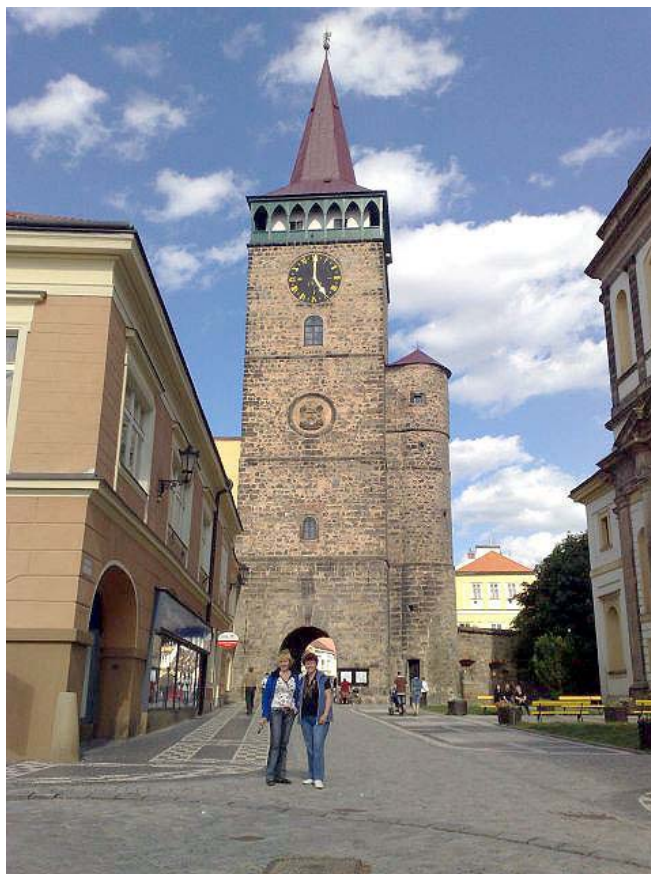
Valdická Brana w Jiczynie.

Po napatrzeniu się na piękne twory skalne przejdziemy do miejscowości Jičín. To małe miasteczko założone na przełomie XIII/XIV w. znano z tego, że jego właścicielem był Albrecht Wallenstein, wódz naczelny wojsk cesarskich. I właśnie dzięki niemu miasto rozkwitało. To on