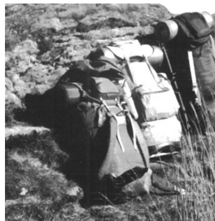
Sprzęt wyprawy 1983

Dziś wchodząc do sklepu ze sprzętem turystycznym dostajemy oczopląsu od mnogości modeli, wzorów, kolorów. Jednocześnie na różnych forach nie brak pytań typu „ wybieram się w góry, jaki plecak jest najlepszy? ”. No i mnożą się odpowiedzi, że najlepsze są z takiej firmy, albo z takiej. Powinniśmy kierować się jedną podstawową zasadą – nie kupować w „sklepach wielkopowierzchniowych”, w których roi się od sezonowego towaru przeważnie z „Państwa Środka”. Wiele (choć nie wszystkie) plecaków tego pochodzenia jest warta rzeczywiście tyle, ile kosztują, a ich ceny często są porażająco niskie. Można być pewnym, że równie niska jest ich jakość. Podobnie rzecz ma się z rowerami, wieloma zabawkami itp. Dlatego na takie zakupy może zdecydować się tylko osoba mająca już doświadczenie i potrafiąca ocenić produkt (plecak) na podstawie posiadanej wiedzy.