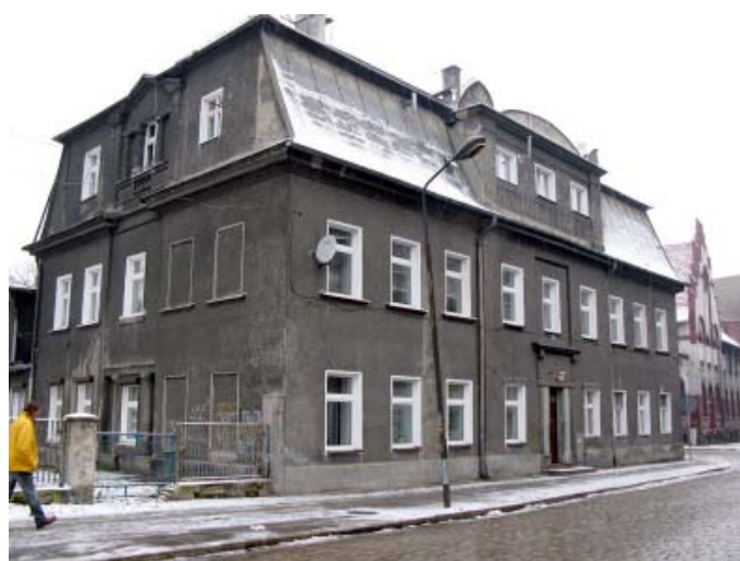
Budynek na początku 2010 r.

Część okien zamurowano oraz wymieniono stolarkę drzwi zewnętrznych i wewnętrznych. Tylko w oknach przyziemia elewacji tylnej zachowała się XIX-wieczna stolarka okienna oraz stolarskie dekoracje schodów. Budynek jest częściowo podpiwniczony, dwukondygnacyjny z dachem mansardowym typu francuskiego, częściowo pokrytym blachą ocynkowaną. Dach posiada naczółki. W chwili obecnej stan budynku określa się jako średni, a właścicielami budynku są lokatorzy, którzy wykupili mieszkania od poprzedniego właściciela. Budynek, położony przy ul. Pocztowej 1, został wpisany do rejestru zabytków nr rej. 705/1613/WŁ z dn. 29.01.1998 r.