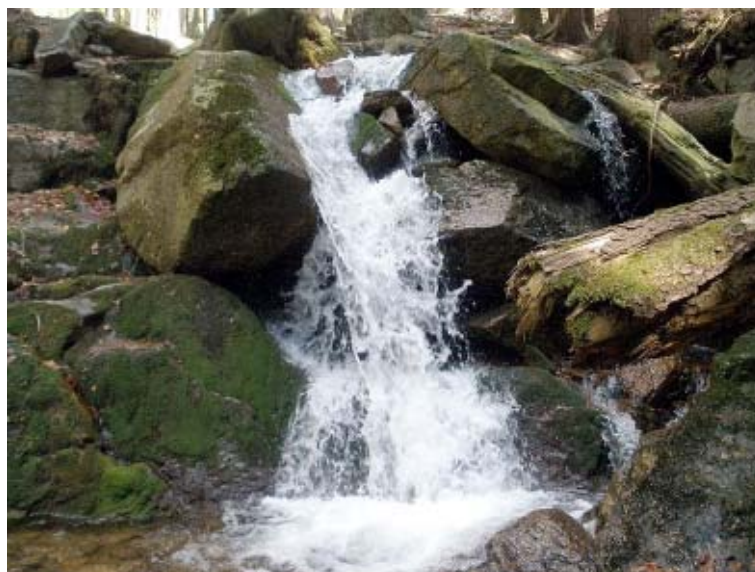
Kaskada na Nowince

Zaznaczyć trzeba, że odwiedzenie jednych i drugich kaskad to propozycja nie dla każdego. Odradzam wybieranie się w ten rejon osobom z małymi dziećmi, jak również osobom bez dobrej kondycji i, co ważne, odpowiedniego obuwia.