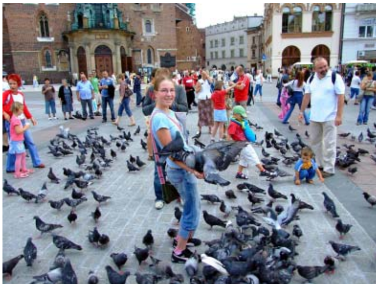
Gołębie na krakowskim rynku.

Przebadano w sumie 255 osób. Struktura próby była tak dobrana, by możliwie najlepiej odwzorować strukturę demograficzną Europy. Najwięcej respondentów pochodziło z Niemiec, Włoch, Wielkiej Brytanii, Hiszpanii oraz Francji. Wszyscy byli przedstawicielami branży turystycznej, stąd ich wiedza była na pewno większa niż przeciętnego Europejczyka. W sumie w próbie znaleźli się przedstawiciele 28 państw. Respondenci oceniali atrakcyjność turystyczną 30 europejskich miast. Najwyższą ocenę (w skali 0-10) uzyskał Paryż – średnio 8,5 – następnie Barcelona, Londyn i Rzym po 8,3 i Berlin 7,8. W środkowo-wschodniej Europie najwyższą ocenę uzyskały Praga 7,3 i Budapeszt 6,4. Kraków znalazł się na 24 pozycji ze średnią 5,8, a Warszawa ze średnią 5,4 na miejscu 26. Bratysława – stolica naszego południowego sąsiada, uzyskała średnią 5,1. Kraków przegoniły m.in. takie miasta, jak Mediolan, Nicea, Bruksela, Salzburg, Monachium i Sewilla. W drugiej części ankiety w pytaniach bezpośrednio o Kraków okazało się, że: 80% respondentów słyszało o Krakowie, ale 20% nigdy o nim nie słyszało (przypominam: byli to przedstawiciele branży turystycznej). 80% mówiło, że Kraków leży w Polsce, 17% nie wiedziało gdzie, po 1% podawało Czechy, Ukrainę i Rosję. 9% respondentów było kiedyś w Krakowie. 55% nie miało żadnych skojarzeń z Krakowem, gdy mieli podać je z głowy. 21% wpisało Wawel jako pierwsze skojarzenie z Krakowem, 10% Stare Miasto, 9%