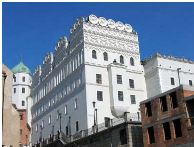
Zamek Książąt Pomorskich w Szczecinie.

I tak oto zakończyłem zdobywanie OKP w stopniu brązowym. Odwiedziłem zgodnie z regulaminem dwa miasta, dwa parki narodowe, 20 zabytków, 10 muzeów i 10 obiektów tzw. innych. Zajęło mi to praktycznie dwa miesiące kalendarzowe, a tak naprawdę 21 dni wycieczkowych. W tym czasie odwiedziłem w sumie 80 obiektów zamieszczonych w kanonie: 80, ponieważ zwiedzanie miasta czy parku narodowego to jest zawsze kilka czy kilkanaście oddzielnych zabytków. Oprócz tego widziałem kilkanaście obiektów, których mimo iż nie są umieszczone w kanonie, nie wypadało ominąć. Same bilety wstępu i parkingów nie kosztowały zbyt wiele, bo niecałe 300 zł, ale przejechałem samochodem 4 tys. km. Muszę dodać, że oprócz tego przeszedłem pieszo około 100 km. Tak więc, aby zdobyć nową odznakę krajoznawczą, trzeba trochę się namęczyć, poświęcić sporo czasu i, niestety, trochę to kosztuje.