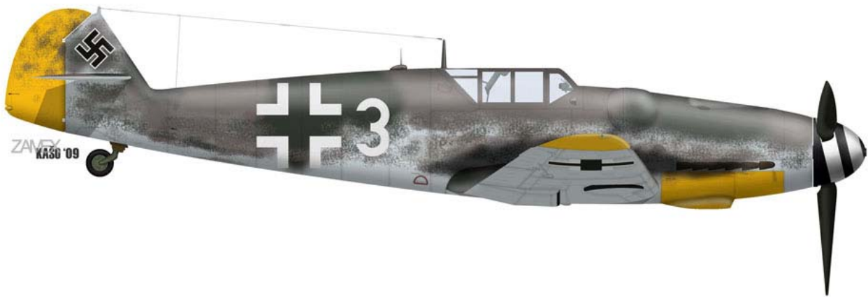
Messerschmitt Bf109G-6 W. Nr 441665 9 („biała trójka”) na froncie wschodnim.