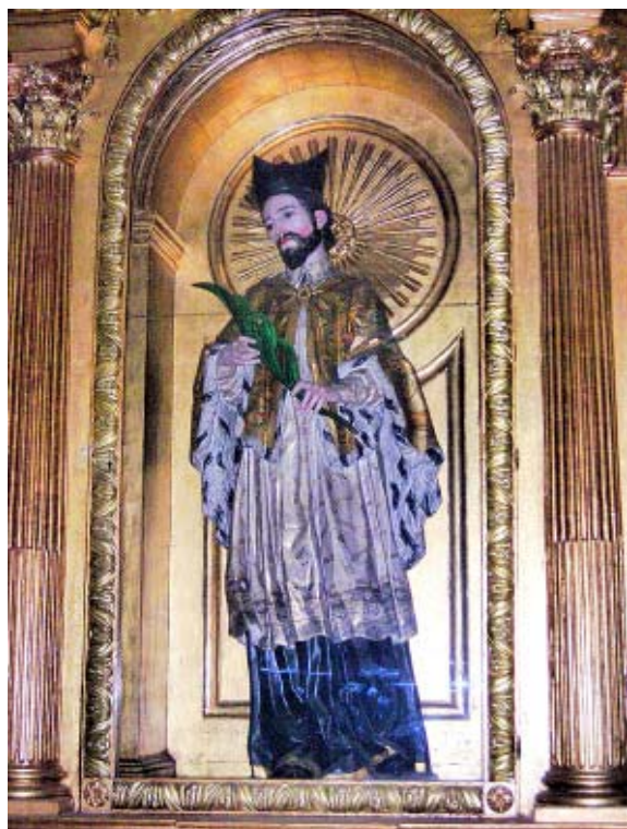
Św. Jan Nepomucen z katedry w Ciudad Guatemala.

na Śląsku i we Wrocławiu, gdzie katolicy mimo wsparcia monarchów i aktywności jezuitów stanowili słabą mniejszość. Pozostałe dwa pomniki powstały w miejscach publicznych na terenie miasta i propagują praktyki religijne katolickiej mniejszości wspieranej przez habsburskich katolickich władców. Typowy dla ikonografii świętego pomnik na skwerze przy ul. Szewskiej/pl. Nankiera dłuta Jana Jerzego Urbańskiego (1723) zawiera następującą inskrypcję łacińską: