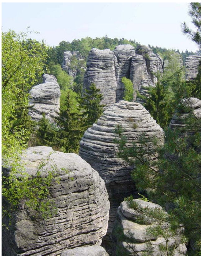
Prachovské Skaly.