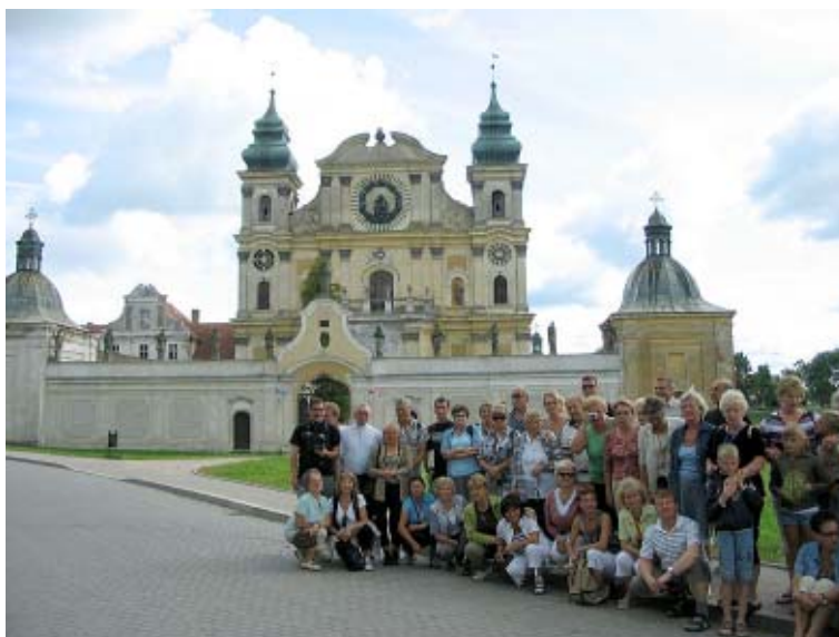
Mała Św. Lipka

W Krośnie – małej wiosce pod Ornetą, znajduje się kościół zwany „małą Świętą Lipką”. Jak głosi legenda, pewnego razu dzieci bawiące się w rzece Drwęcy odnalazły figurkę Matki Boskiej, która zasłynęła cudami. W miejscu tym w XVI w. postawiono kaplicę, a gdy z powodu napływu pielgrzymów okazała się ona zbyt mała, postanowiono wznieść kościół. Stał on dokładnie w miejscu znalezienia postaci, co wymagało zmiany biegu rzeki. Niestety, w wyniku zawieruchy wojennej w 1945 r. słynąca łaskami figurka bezpowrotnie zaginęła... Obecną świątynię pw. Nawiedzenia Najśw. Marii Panny wybudowano na