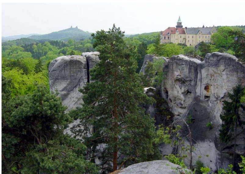
Zamek Hrubá Skála, w tle Zamek Trosky.

Po zrobieniu pamiątkowych zdjęć obowiązkowo należy wejść na drugą wieżę, a ściślej mówiąc – tylko na taras widokowy. Na samą górę bowiem nie ma możliwości dotarcia. Z tarasu widoki są niepowtarzalne. W drodze powrotnej możemy jeszcze przystanąć przy pani z ptakami. Zobaczymy tutaj orła, puchacza i myszołowa. Są to piękne ptaki tyle tylko, że nieloty. Przeszły one różne kontuzje i teraz w schronisku spokojnie sobie żyją. Muszą tylko zarobić na jedzonko. I dlatego warto zrobić sobie zdjęcie z nimi. Kosztuje to jedyne 30 koron.