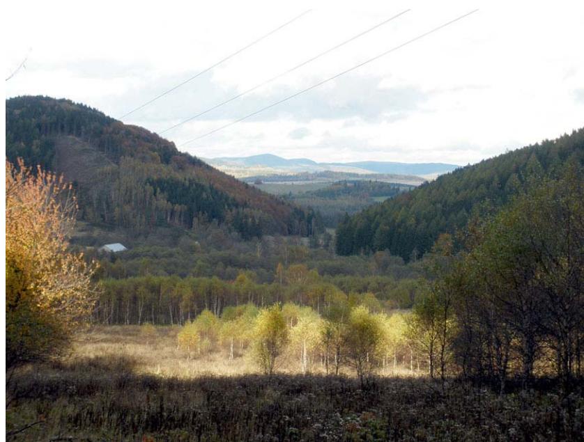
Nad źródłiskami Białki, w dole Nowa Białka

Z a górami, za lasami..., a ściślej w sercu odludnego zakątka Wzgórz Bramy Lubawskiej. Tak właśnie położona jest najmniejsza, pod względem liczby mieszkańców, wieś w pow. kamiennogórskim, woj. dolnośląskie. Tytułowa Nowa Białka, według danych na 2007 r. zamieszczonych w internetowej Wikipedii , liczyła... trzech mieszkańców. W przeciwieństwie do leżącej po drugiej stronie góry Świerczyna Starej Białki – ludnej, gęsto zabudowanej wsi. Pewnie niejednemu trudno wyobrazić sobie, że jest to odrębna miejscowość. A jednak. Choć nie jest siedzibą sołectwa, ma status samodzielnej