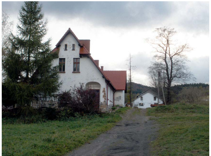
Nowa Białka – jedyne zabudowania we wsi