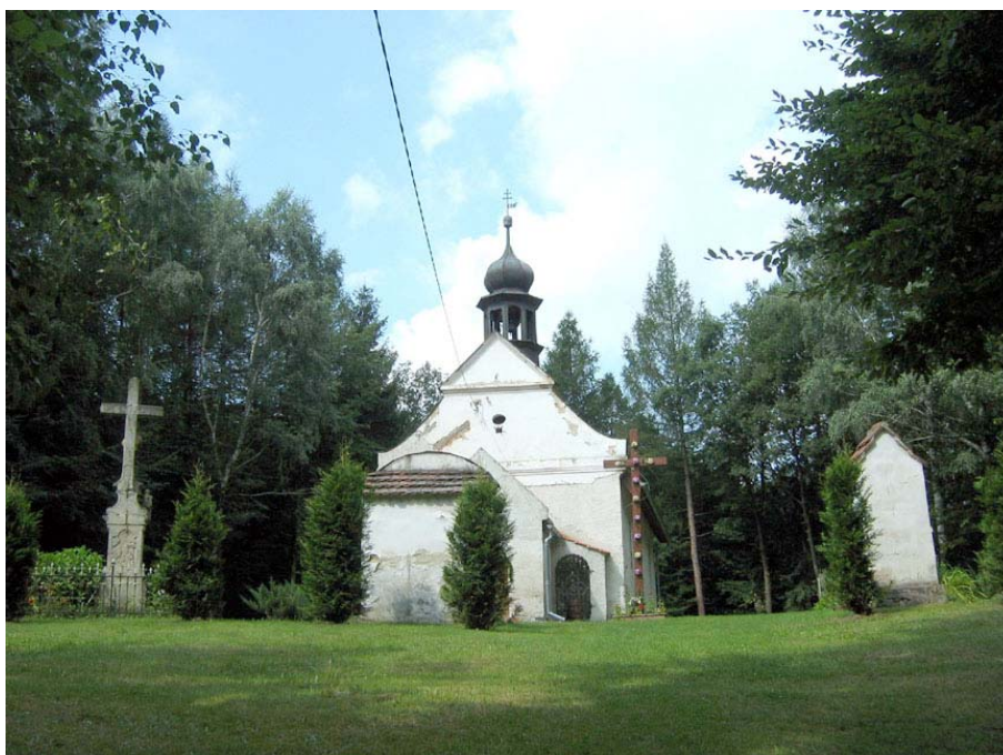
Kaplica św. Anny

Króciutkie podejście na wzniesienie i stajemy przed sporą kaplicą św. Anny z 1707 r. na zadbanym terenie. Wokół krzyże ze stacjami, których droga zatacza niewielki łuk w lesie. Od strony wejście wysokie, późnobarokowe Ukrzyżowanie. Idziemy wygodnym duktem do pobliskiego skraja lasu z coraz okazalszymi okazami buków i skręcamy w prawo. Zagłębiając się w rezerwat – buki coraz dorodniejsze, strzeliste, sięgające nawet ponad 20 m wysokości, potężne jak słupy wielkich średniowiecznych katedr. Latem panuje tu znaczny mrok –