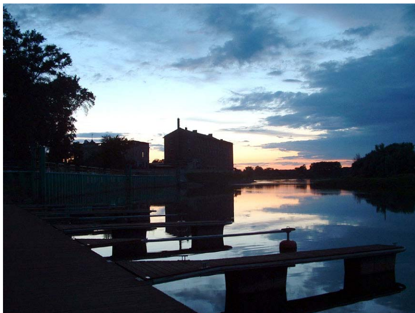
Zachód słońca nad Odrą

jednym z najładniejszych rynków w Polsce i jest wizytówką miasta. Odbywają się na nim liczne imprezy kulturalne w ciągu całego roku. Otaczają go zrekonstruowane w latach 2004-2005 stylowe kamieniczki z XVII i XVIII w. i zbiega się do niego zachowana sieć prostokątnych ulic. W narożniku rynku stoi późnorenesansowy Ratusz z lat 1602-1609, na którego wieżę można wejść dzięki uprzejmości władzy lokalnej i pracowników urzędu, bowiem nie jest ona jeszcze udostępniona dla turystów. Roztacza się z niej panorama miasta z wijącą się Odrą, widać liczne podjęte w mieście inwestycje. W celu podkreśle-