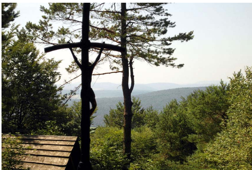
Widok z Magury Wątkowskiej

Wakacje dobiegały końca. Zrobiliśmy jeszcze wycieczkę z Wysowej przez Kozie Żebro do Hańczowej, a powrót przez Ropki. Wieś ciągnęła się chyba 5 km, mając nie więcej niż sześć chałup. Wszystkie cudnie otoczone polami, strumieniami i zapachem traw. Kierunkowskaz „Swystowy Sad” pokazywał drogę do ostatniego sioła. Z daleka uwodziła piękna, odnowiona łemkowska chata. Czuliśmy, że tam by nam się podobało. Nazwa i wygląd miejsca sugerowały, że możemy spotkać się z gospodarzami, którzy jako potomkowie Łemków, powrócili na swoje ziemie. Może za rok wrócimy tutaj, by spoglądać na ten kraj i ludzi, którzy, jak Jan Paweł II, uczą nas kochać te miejsca.