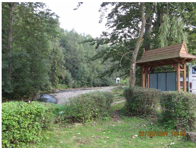
Widok na rzekę

Lasy ochotnickie są terenami przyjaznymi dla miłośników grzybów, którzy tłumnie zjeżdżają się w te okolice podczas wysypów grzybów. Tutejsze lasy mają do zaoferowania wiele gatunków jadalnych grzybów, począwszy do najbardziej cenionego i poszukiwanego borowika szlachetnego,