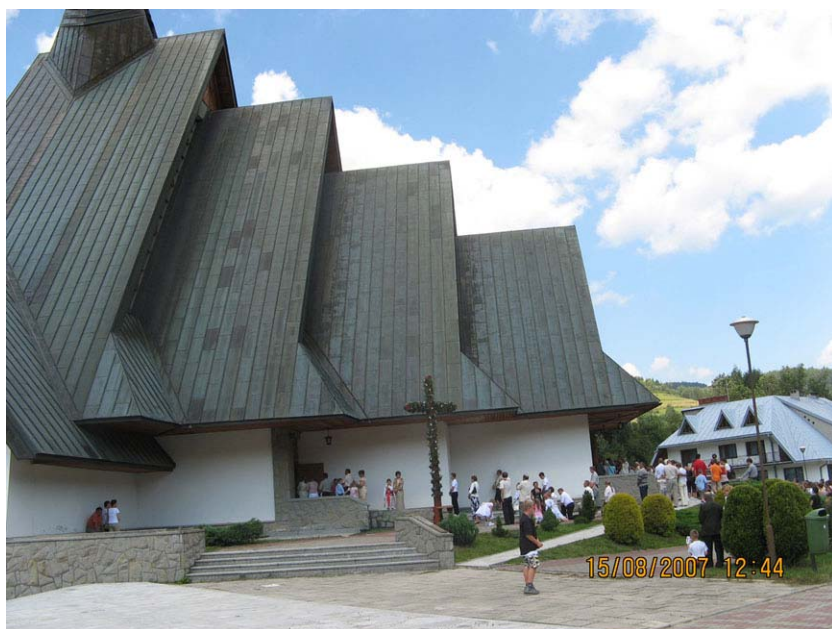
Kościół w Ochotnicy Górnej