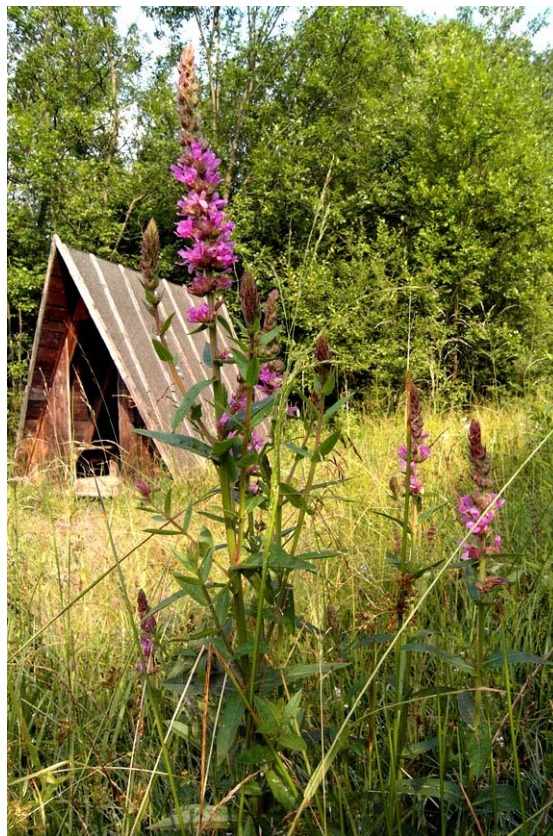
Schron przeciwdeszczowy na „papieskim” szlaku

Kornuty nadal nas wabiły i nie pozwalały zapomnieć o sobie. Po jakimś czasie dotarliśmy do nich z Bartnego. Rezerwat wziął swoją nazwę z jęz. rumuńskiego i oznacza rogi. Było ich całe mnóstwo na grzbiecie i na zboczu góry. Ostre skałki, wyrastające ni z tego, ni z owego,