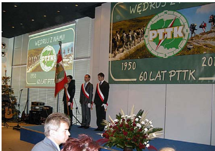
Poczet sztandarowy PTTK