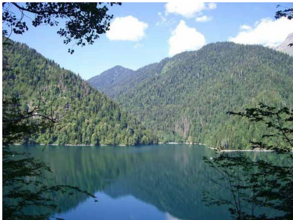
Jezioro Rica.

poniosła do morza. Jupszara próbował się ratować, chwycił rosnące na brzegu krzewy, lecz wrywał je z korzeniami. Jego brat Gega biegł obok po brzegu, ale nie mógł mu pomóc. A trzech braci, przybici nie szczęściem, zamienili się w wysokie góry. Agepsta, Acetuk i Pszegiszcha stoją tak do dziś nad przezroczystą zielonobłękitną wodą jeziora, chroniąc wieczny sen Ricy.