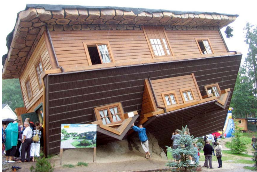
Dom do góry nogami w Szymbarku

Jednym z naszych pierwszych celów po przyjeździe stał się krowi ogon. Tak bowiem potocznie nazywana jest Mierzeja Helska. Zanim dotarliśmy do Helu, przejechaliśmy przez Chałupy, gdzie z okien autobusu intensywnie wypatrywaliśmy „tekstylnych”, a w ostateczności Zbigniewa W. oraz Juratę znaną przede wszystkim z rządowego ośrodka. Miasto powitało pochmurną pogodą i porywistym wiatrem. Choć pogoda była idealna do zwiedzania, nie za zimno, nie za ciepło, to miała swój zasadniczy minus. Rzesze wczasowiczów nie mogąc wylegiwać się na plaży, obiegły wszelkiego rodzaju „zadaszone atrakcje turystyczne”. Skutecznie uniemożliwiło to wdrapanie się na helską latarnię morską, ale