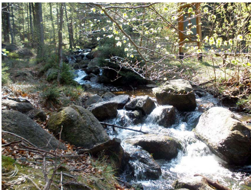
W dolinie Janówki

Na Wołka (o nazwie szczytu przy okazji omawiania nazwy sąsiedniego Małego Wołka pisał w „Na szlaku” nr e-6/2007, s. 4-5 Jerzy K. Bieńkowski) dojść można z różnych stron. Każdy z wariantów zdobycia góry jest atrakcyjny. Od strony Janowic Wielkich atrakcyjna jest dolina Janówki z licznymi skałkami w niej samej i w jej pobliżu, m.in. pięknym Skalnym Mostem. Od strony Marciszowa wyludnione niemal zupełnie Rędzinki z sielskimi widokami łąk i wspaniałymi panoramami sporej części Sudetów. Turysta wybierający wariant z Marciszowa, szosą przez Wieściszowice, ma okazję obejrzeć ciekawie położony krzyż milenijny. Nie-