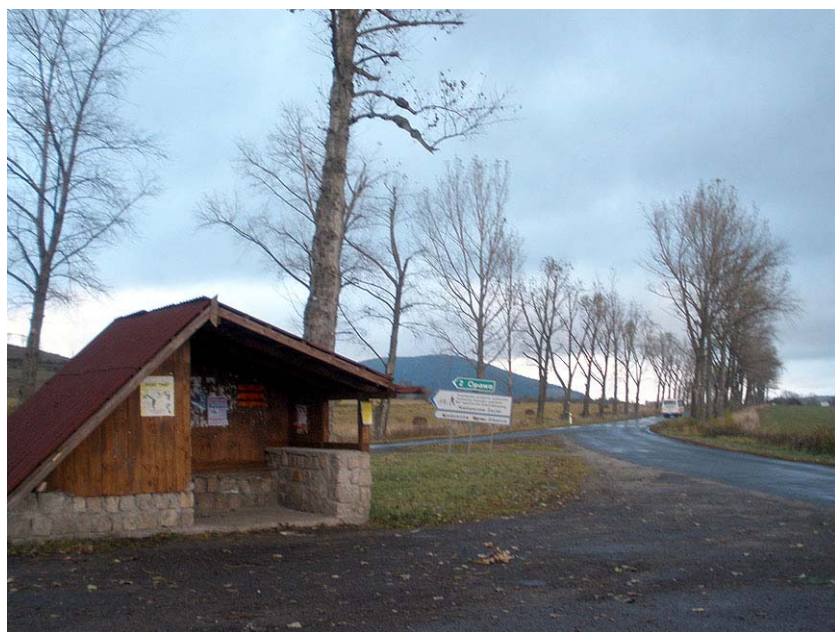
Przystanek PKS Opawa Skrzyż. na żądanie

Od samego przystanku trzymamy się szlaku czerwonego wiodącego w stronę wsi z Miskowic. Do zabudowań Opawy ze „Skrzyżowania” dociera się asfaltem mniej więcej w 20 min. Wędrując w stronę Karpacza, co zabrzmi dość egzotycznie, gdybyśmy w tym miejscu poprosili kogoś o wskazanie drogi do tego miasta, przechodzimy przez całą wieś, mijając w górnej jej części, z lewej, ciekawy barokowy kościół. Niewątpliwie jest to już karkonoska świątynia. Granicę między najwyższym pasmem Sudetów a leżącymi tu u jego stóp Wzgórzami Bramy Lubawskiej można wyznaczyć na tym odcinku umownie nieco poniżej kościoła, w okolicach miejsca, gdzie odchodzi asfaltowa droga do Niedamirowa. Zaraz za ostatnimi zabudowaniami wkraczamy w las. Dotąd od przyst. Opawa Skrzyżowa-