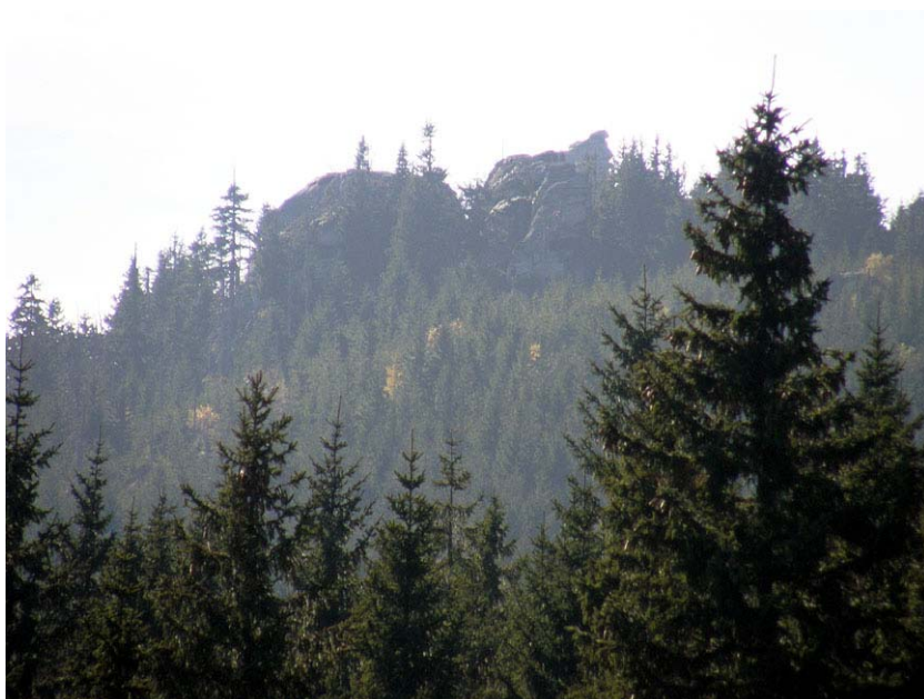
Widok z Pałacyku. Od lewej: Przepadliny, Rudnica, Maszkara, za nimi Wysoczyniec

Nazwę złożoną Wysoki Granit zwalczałem od pierwszej chwili, kiedy tylko została sformułowana. Mamy, co prawda, Granitową we Wzgórzach Strzegomskich czy Bazaltową na Pogórzu Złotoryjskim, ale nigdzie w Sudetach nie mamy obiektu fizjograficznego o nazwie rzeczownikowej: Granit, Bazalt, Piaskowiec, Porfir czy Mezonit. W Górach Świętokrzyskich, gdzie Jodła pospolita ( Abies alba ) jest drzewem rzeczywiście pospolitym, nie ma ani jednej miejscowości, której nazwa pochodzi od jodły, ale są nazwy pochodzące od wiśni czy gruszy, ponieważ w Puszczy Świętokrzyskiej były to drzewa niezwykle. Jak w takim razie można skałę nazywać Granitem , skoro