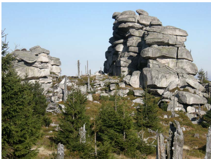
Od lewej: Ptasiniec i Wysoczyniec

ny prawdy, co czynię z dużym wahaniem. A jak naprawdę wygląda Wysoczyniec, można zobaczyć na załączonych zdjęciach.