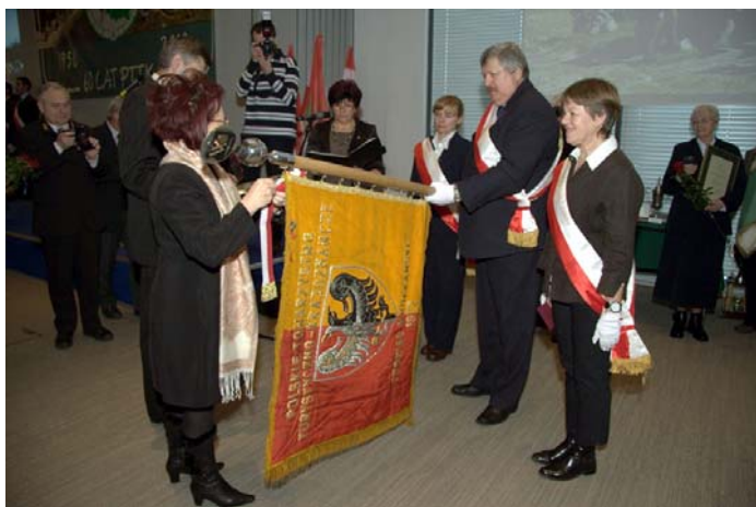
Odznaczenie Sztandaru Oddziału Wrocławskiego PTTK