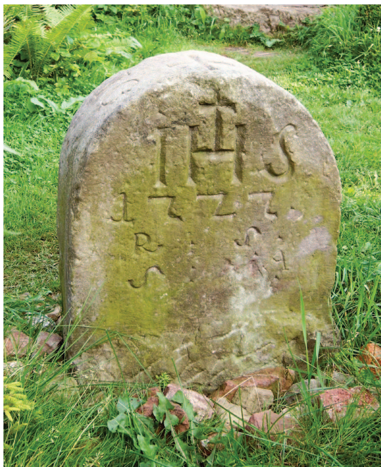
Chełmsko, kamień graniczny od strony „jezuickiej” (08.2012)

W Žaclerzu bardziej na miejscu byłby słupek taki, jak ten, który znajduje się w Chełmsku Śląskim – obecnie w ogródku „Lnianej Chaty” (jeden z „12 Apostołów”, nr 17). Dzięki zabiegom właściciela Chaty kamień po kilku przenosinach znalazł tam bezpieczne schronienie i chętnie jest udostępniany turystom odwiedzającym miejscowość. Ten kamień jest większy od dotychczas opisanych, pod infułą ma dodatkowo wykutą tarczę z herbem opactwa, ale – co ważniejsze – ma inskrypcje po obu stronach. Po stronie przeciwnej do „krzeszowskiej” znajduje się godło jezuitów (grecko-łaciński monogram imienia Jezus, IHS z krzyżem) oraz litery RSSJ oznaczające dom Tow. Jezusowego w Žaclerzu ( Residentia Schatzlariensis Societatis Jesu ). Ten „jezuicki” wątek wynika z faktu, że pod koniec wojny trzydziestoletniej, w 1644 r., cesarz Franciszek III podarował Žaclerz (niem. Schatzlar ) nowicjatom jezuitów przy kaplicy św. Anny w Wiedniu, stąd później powstała konieczność klarownego rozdzielenia w terenie posiadłości obu zakonów.