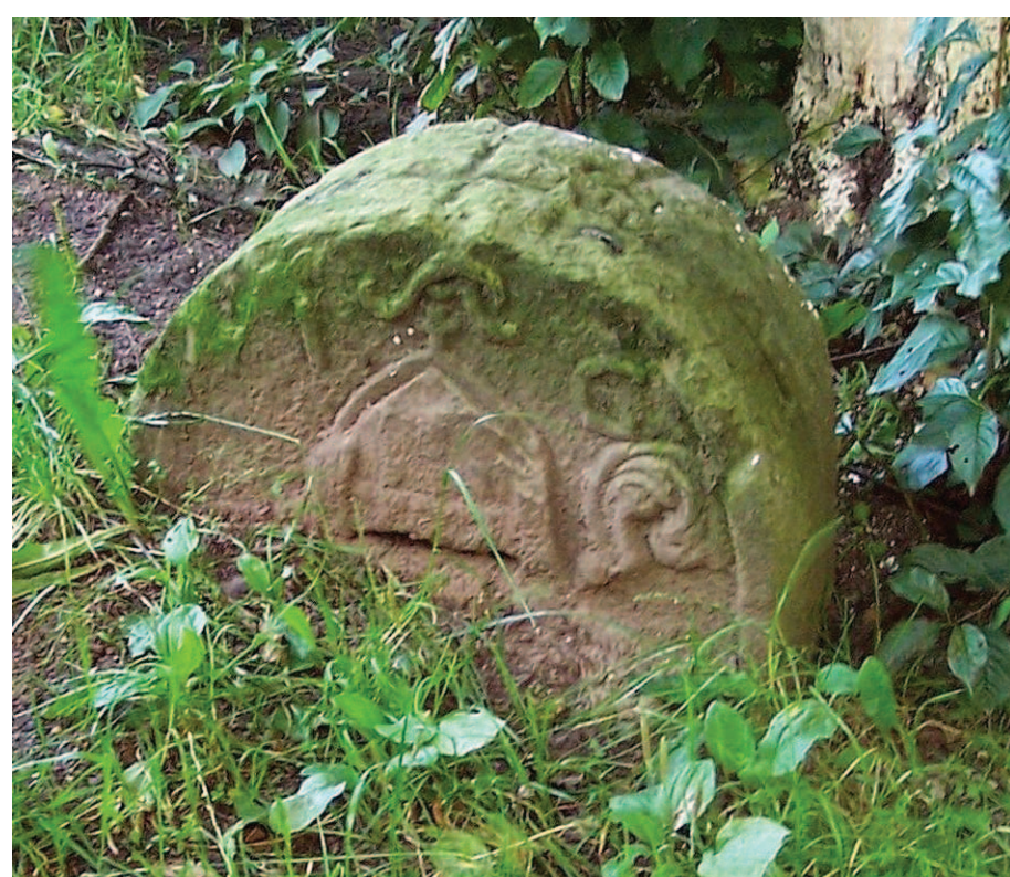
Krzeszów, ledwie widoczny kamień na dziedzińcu gospodarczym (08.2009)

leju używania przez opatów krzeszowskich insygniów biskupich, litery – to monogram 43. opata Innozenza Fritscha ( Innocentius Abbas Grissoviensis ), a data – to początek jego rządów, ale też data rozbiórki poprzedniej świątyni klasztornej. Nb. datę zakończenia budowy (już po sześciu latach od decyzji o jej rozpoczęciu!) zawiera wspomniana inskrypcja w szczycie bazyliki: sumując cyfry rzymskie dość długiego chronogramu uzyskuje się rok 1733.