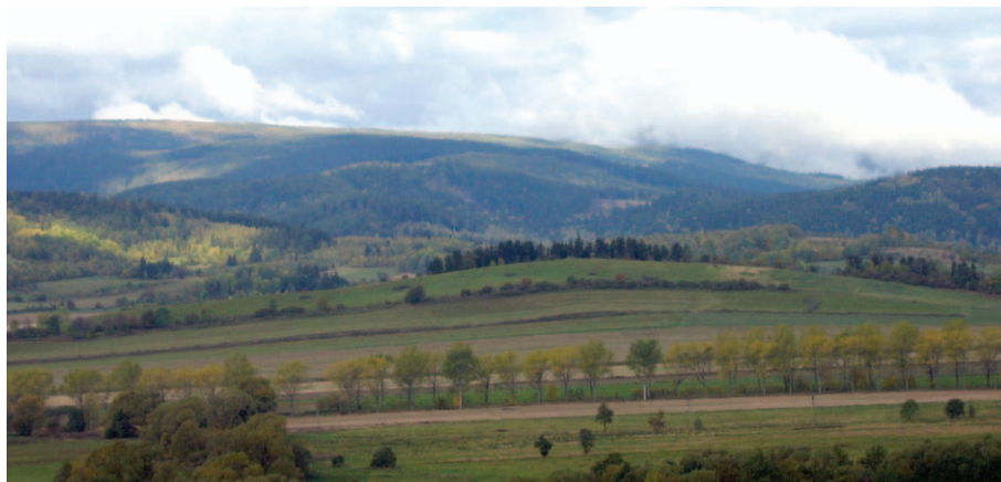
Lasocki Grzbiet od wschodu

Cały mikroregion Lasockiego Grzbietu jest interesujący turystycznie, cichy i spokojny, co przedstawiono w poprzedniej części.