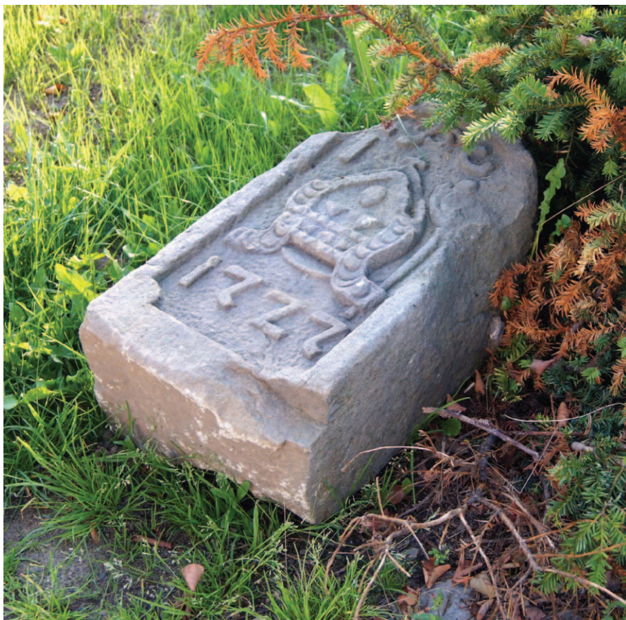
Krzeszów, kamień graniczny na trawniku przed Domem Opata (08.2012)