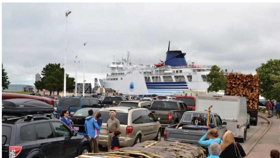
Kolejka na prom w South Baymouth

społeczeństwie muszą być ci najubożsi. Jednak chyba dopiero teraz dotarło do nas, że dotyczy to również Kanady.