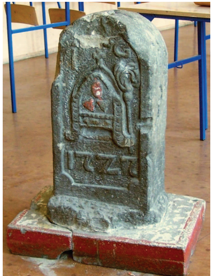
Lubawka, rekwizyt w gabinecie historycznym (08.2009)

ściankach wtórnie wykute trzycyfrowe numery i czasami litery pochodzące zapewne z czasów, kiedy służyły jako słupki granicy państwowej, zanim zostały przeniesione na swoje obecne miejsca. Najodleglejsza od Krzeszowa lokalizacja takiego słupka jest przy zamku w Bolkowie (miasteczko wraz z zamkiem było zakupione przez klasztor krzeszowski w 1703 r. i pozostawało jego własnością aż do sekularyzacji przez rząd pruski w 1810 r.). Słupek stał tam przez pewien czas na tzw. dolnym dziedzińcu w pobliżu budynku kasowego, a obecnie znajduje się w lapidarium obok zamkowego muzeum. Jest to jedyny cysterski kamień graniczny bez dodatkowo wykutych numerów.