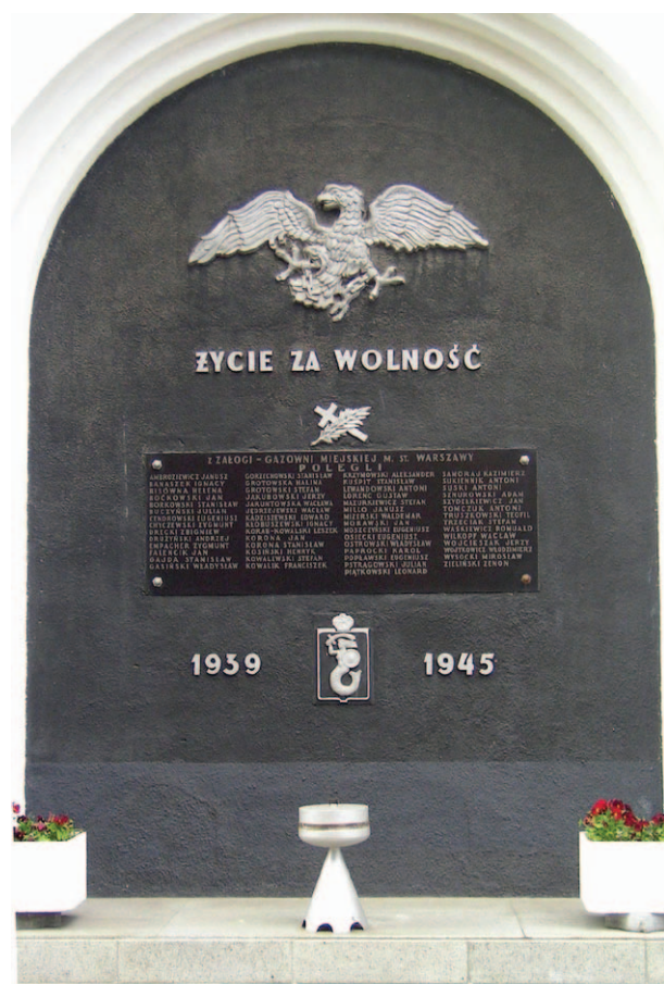
Gazownia Warszawska – tablica pamiątkowa

Na ziemiach polskich, zarządzanych przez zaborców, pierwsza gazownia miejska powstała w Szczecinie w 1846 r., kolejna we Wrocławiu w 1847 r. [red. – tereny te nie leżały w tzw. Zaborach]. Kolejne gazownie