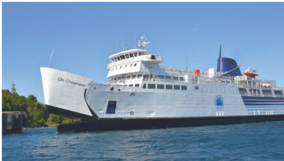
Prom „Chi-Cheemaun” dobija do przystani w Tobermory

tego typu jednostka na słodkich wodach w ogóle. Zbudowany w 1974 r. w nieistniejącej już stoczni w Collingwood na południowym krańcu Georgian Bay, ma 111 m długości i 19 m szerokości. Dwa silniki wysokoprężne o mocy 7000 KM zapewniają mu prędkość 16,5 węzła, co pozwala pokonywać 28-milowy dystans South Baymouth – Tobermory w 1.45 godz. Na dwóch pokładach ładunkowych może zabrać do 143 samochodów, a do tego 638 pasażerów.