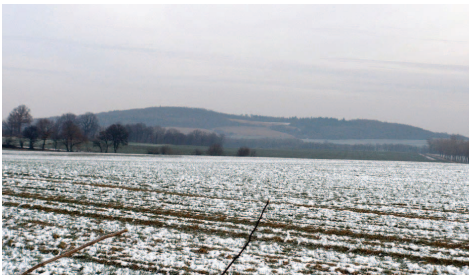
Pyszczyńska Góra spod Krukowej

Z przewyższenia pod wierzchołkami Krukowej polna droga schodzi łagodnie w dół. Przed nami widoczne wcześniej z góry malowniczo położone w kotlinowatym obniżeniu zabudowania. To Kruków – mała wioska nad Strzegomką. Rzeka płynie wzdłuż widocznego za budynkami pasa drzew. Wkrótce wkraczymy na asfalt, mijając kilka nowych budynków. Po chwili opuszczamy go jednak, odbijając w prawo. Tu z lewej, za ogrodzeniem jednej z posesji, spora atrakcja. Pobielony