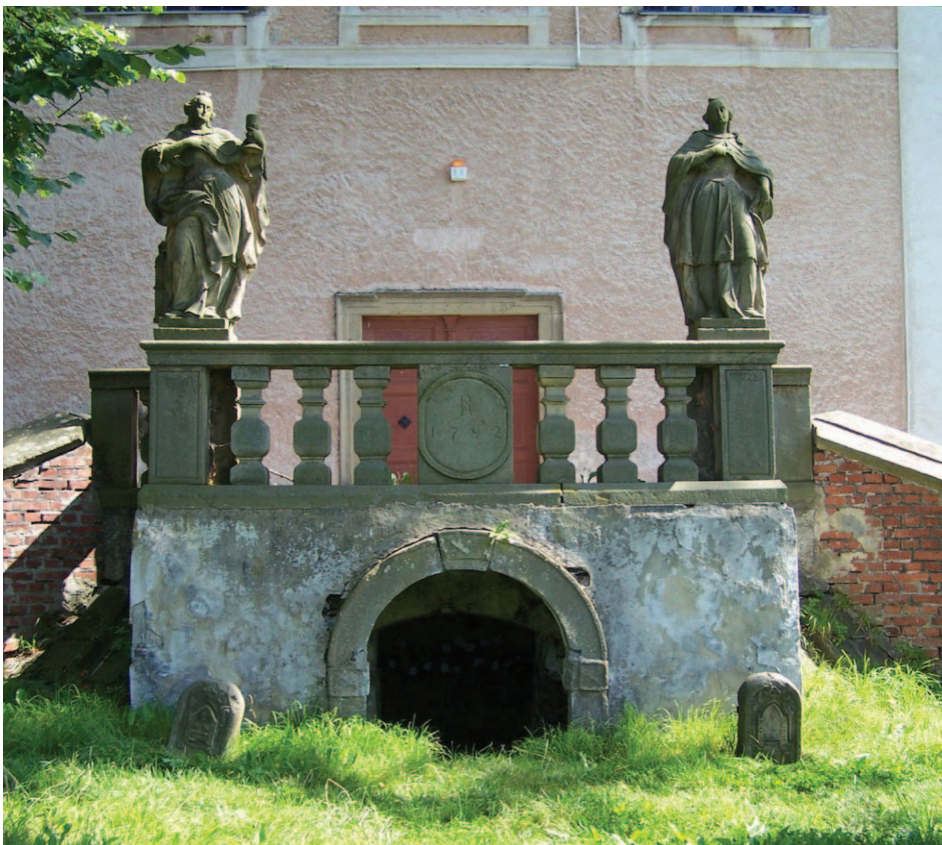
Ulanowice, kamienie graniczne przed kryptą św. Aleksego (08.2009)

niewytłumaczalna racjonalnie obsesja pod hasłem „zakaz fotografowania”. Bardziej otwartą działalność w dziedzinie muzealnictwa prowadzi kawiarnia Mini-Max , mieszcząca się w budynku dawnego ratusza przy ul. Karola Miarki 25: przed wejściem stoi oparty o filar oryginalny słupek graniczny cystersów z 1733 r. Jest on nieco inny niż pozostałe – ma tylko starannie wykute inicjały IF A G i datę; pierwszy znak będący połączeniem liter I i F oznacza zapewne Innocenza Fritscha, a data