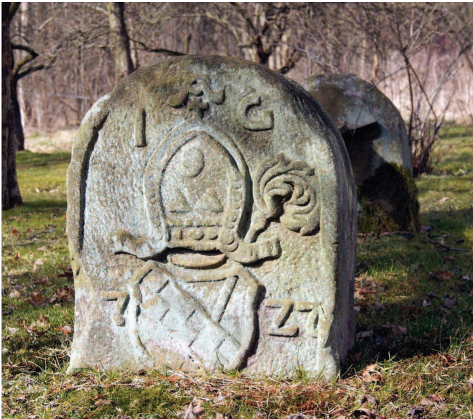
Ulanowice, „ławeczka” w ogrodzie domu opatów (03.2015)