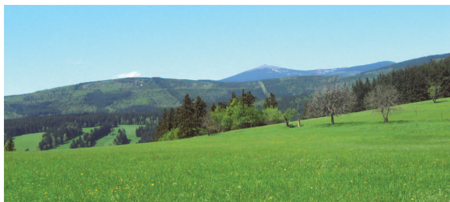
Celne Siodło od południo-wschodu

Cały mikroregion Lasockiego Grzbietu jest interesujący turystycznie, cichy i spokojny, co przedstawiono w poprzedniej części.