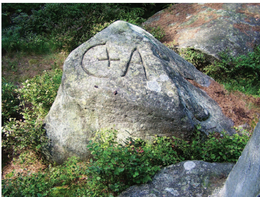
Znak graniczny na grzbiecie Zaworów (08.2009)

– przedostatni rok pełnienia jego funkcji opata krzeszowskiego. Według informacji właściciela, kamień odnalazł on na wysypisku leśnym w okolicach Czadrowa.