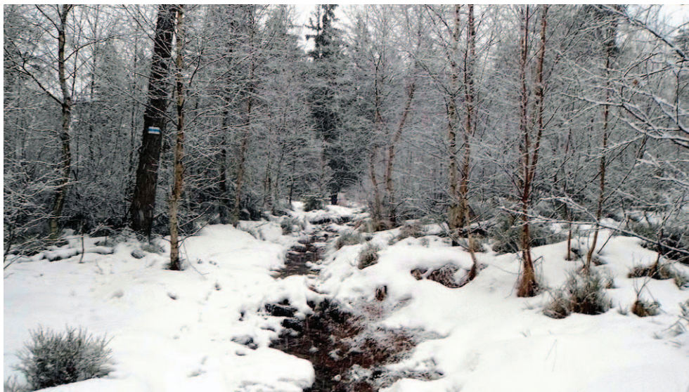
Na zimowym szlaku

Pierwsze pojawiły się porosty zasiedlające nagie skały, później jakieś mchy, a na ich szczątkach znalazły dla siebie miejsce kolejne rośliny. Z czasem pojawił się las, aż w końcu przyszedł człowiek, spojrzał na skalne twory i pomyślał o wieczności. Mylił się: wieczność jest w przemianach Ziemi, a on patrzył na chwilowy jej stan. Kiedyś, w niewyobrażalnej przyszłości, gdy świat zapomni o ludziach, ostatnie