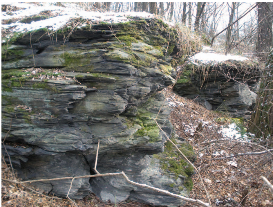
Formacja skalna pod wyższym (273 m) wierzchołkiem Pyszczyńskiej Góry

Od wychodni kierujemy się w stronę gęsto zarośniętego młodymi drzewkami lasu. Tu trzeba się trochę przedzierać. Generalnie kierujemy się na jego wschodni skraj – „w stronę Ślęży”, którą momentami widać nieco zza drzew. Najłatwiej wędrować skrajem lasu. Tak też robimy, aż do momentu, w którym z prawej z dołu dochodzi doń pas krzewów, na mapach oznaczany jako droga polna. To, co tam jest, trudno drogą nazwać. Jest to jednak dobry punkt orientacyjny. Tak bowiem, jak do lasu dochodzi owa „droga”, tak i my skręcamy w lewo i wchodzimy do niego ponownie. W lesie prosto cały czas coraz stromiej do góry. Można iść prosto, ale warto poodbijać nieco raz w lewo, raz w prawo. Tu bowiem znaleźć można kolejne skalne atrakcje. Jedna z odsłonek znajduje się na prawo, inna trochę w bok na lewo