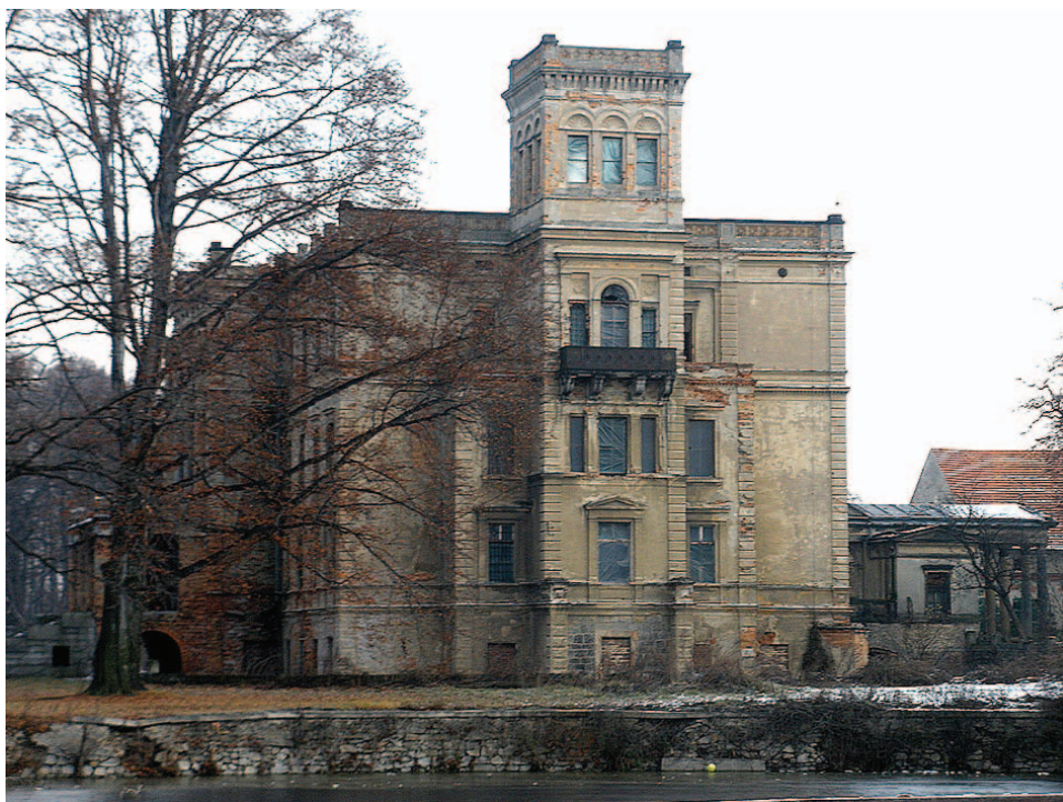
Pałac w Mrowinach