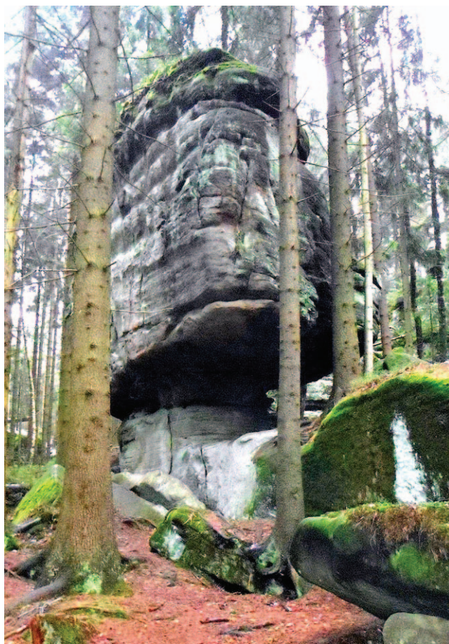
Samotna – bezśnieżna

Mieli tam dobre, chłodne piwo w barze i gorącą wodę w łazience.