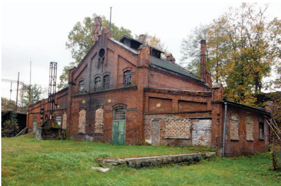
Międzyzlesie – ostatnia gazownia klasyczna w Polsce, czynna do 1998 r.

W opracowaniu korzystałem z informacji zawartych w Historii gazownictwa polskiego od połowy XIX wieku po rok 2000 , praca zbior. oraz Katalog żetonów gazowych ziem polskich A. Schmidta i B. Sikorskiego.