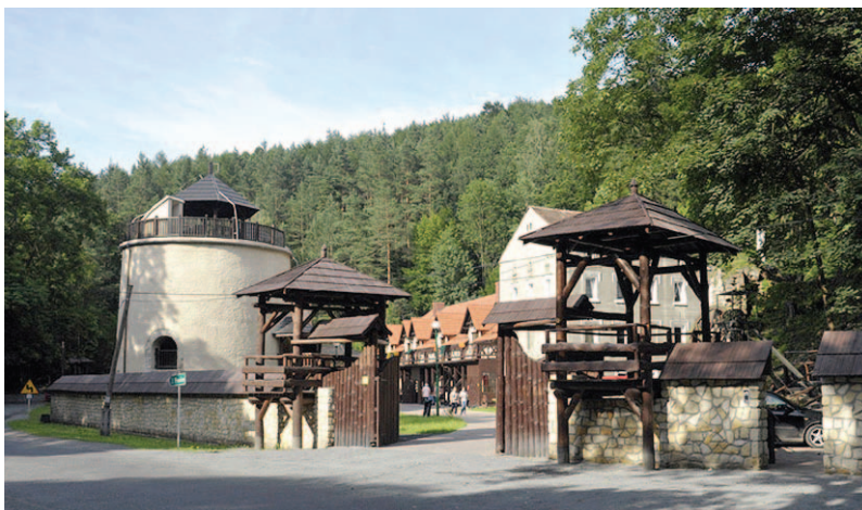
Skansen Górniczo-Hutniczy w Leszczynie.

Dymarki Kaczawskie. Organizator: Skansen Górniczo-Hutniczy w Leszczynie, Złotoryjskie Towarzystwo Tradycji Górniczych. E-mail: skansen@dymarkikaczawskie.pl . Chcąc zobaczyć, jak z niepozornie wyglądających kamieni wytapia się miedź czy żelazo, warto odwiedzić Skansen Górniczo-Hutniczy w Leszczynie koło Złotoryi. W rejonie tej miejscowości wydobywanie rud miedzi miało miejsce przez blisko tysiąc lat, już od IX w. Wokół dawnych pieców hutniczych zorganizowano tu kompleks obiektów, gdzie można zapoznać się z historią wydobywania i produkcji miedzi. Najlepiej pojawić się tu na przełomie czerwca i lipca, gdy wśród bujnej zieleni kaczawskich lasów odbywa się doroczny festyn „Dymarki Kaczawskie” z pokazami wytopu miedzi i prezentacją strojów dawnych górników.