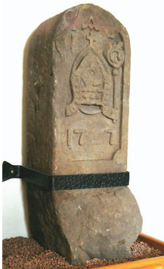
Žaclerz, muzeum miejskie (03.2015)