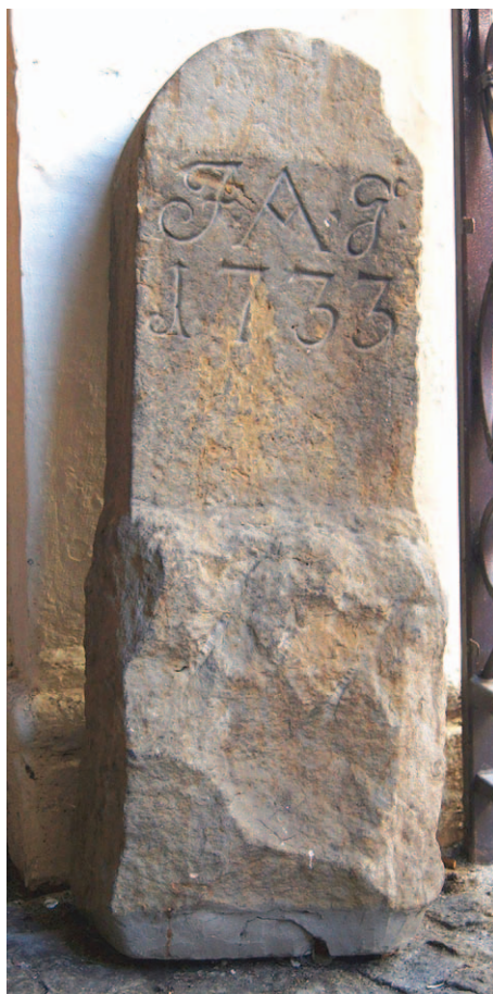
Kamienna Góra, kamień opacki przed kawiarnią (03.2015)