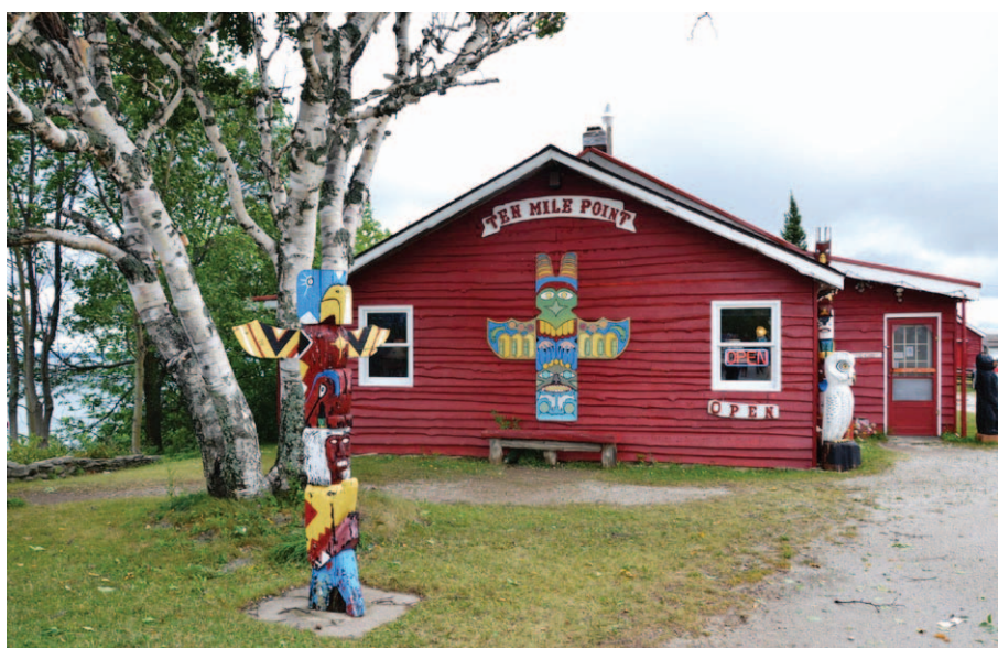
Sklep z indiańskimi pamiątkami w Ten Mile Point