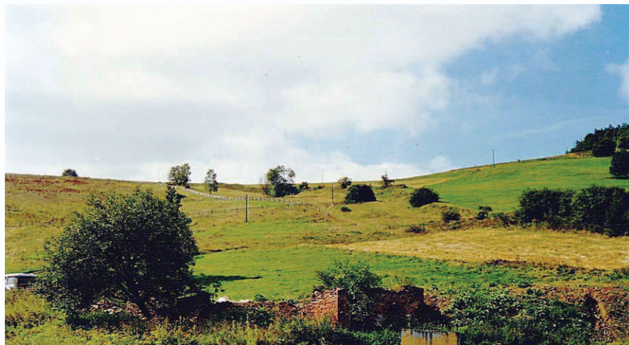
Przeł. pod Widokiem.

Nazwa dziwołaż. Kogo lub co ma wywoływać ta góra? Jest to niemiecka nazwa odosobowa od nazwiska właścicieli tej góry. Zgodnie z zasadami nazewnictwa powinna być przetłumaczona na polską nazwę odosobową. W tym przypadku sytuację mamy ułatwioną, ponieważ Chrośnica nazywała się Ludwigsdorf, co daje popularne również i w Polsce imię zasadźcy – Ludwik. A to prowadzi do najprostszej nazwy: Ludwikowa .