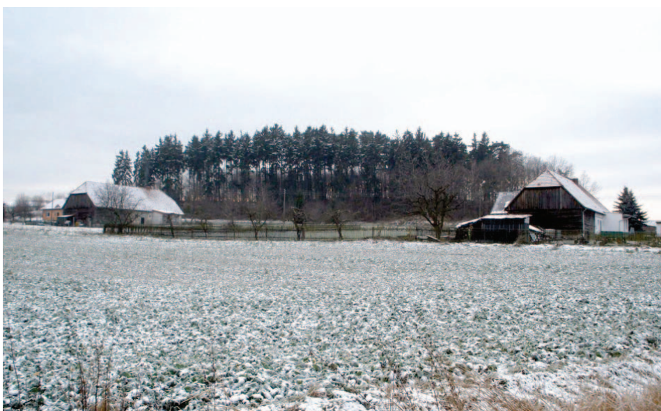
Budynki drewniano-murowane w Krukowie