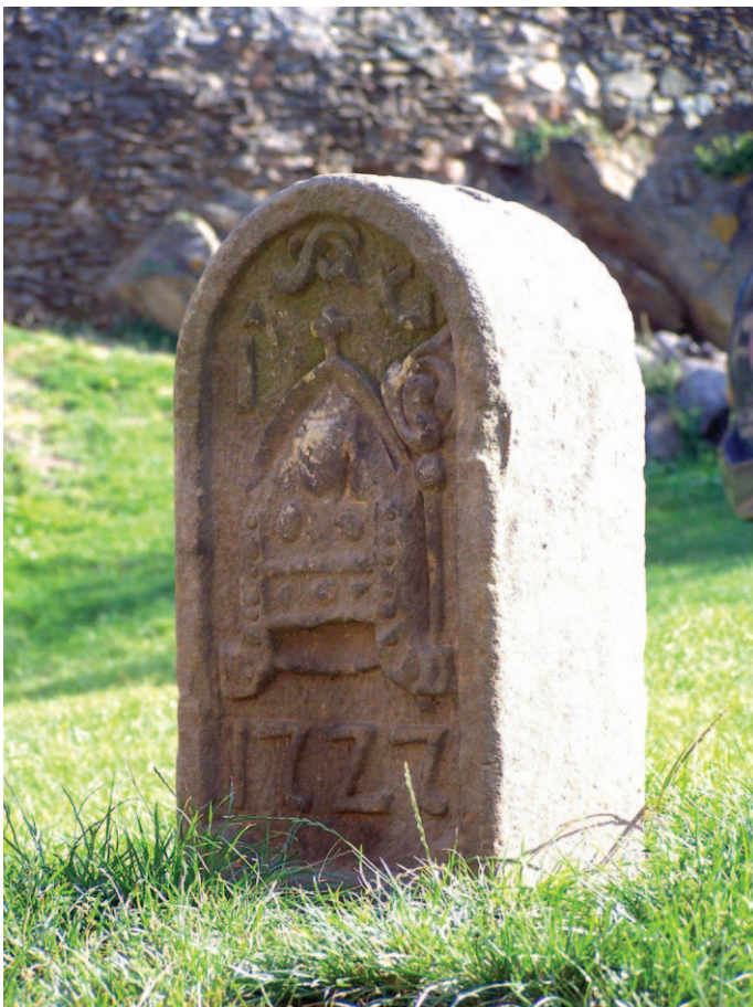
Zamek Bolków, kamień cystersów jeszcze pod zamkiem (08.2009)