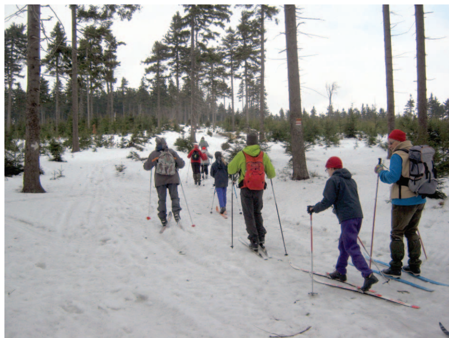
W drodze na Wielką Sowę

li drogą z Jugowa, a nawet ze stacji kolejowej w Ludwikowicach Kłodzkich. Bazą było niewielkie schr. PTTK „Zygmuntówka” pod Przeł. Jugowską (805m). Położone na wysokości 740 m na zboczu Rymarza (913 m) jest z jednej strony łatwo dostępne, a z drugiej wysokość gwarantuje obecność śniegu. Na to liczyliśmy i tak też było. Warunki śniegowe mieliśmy zupełnie dobre, nie brakowało śniegu na żadnej z tras wycieczkowych. Wszystkie ścieżki i drogi, którymi wędrowaliśmy, położone są powyżej 800 m, wszystkie uklepane i z założonymi śladami do biegówek. Czego chcieć więcej? Może słońca i lekkiego mrozu, żeby to wszystko nie