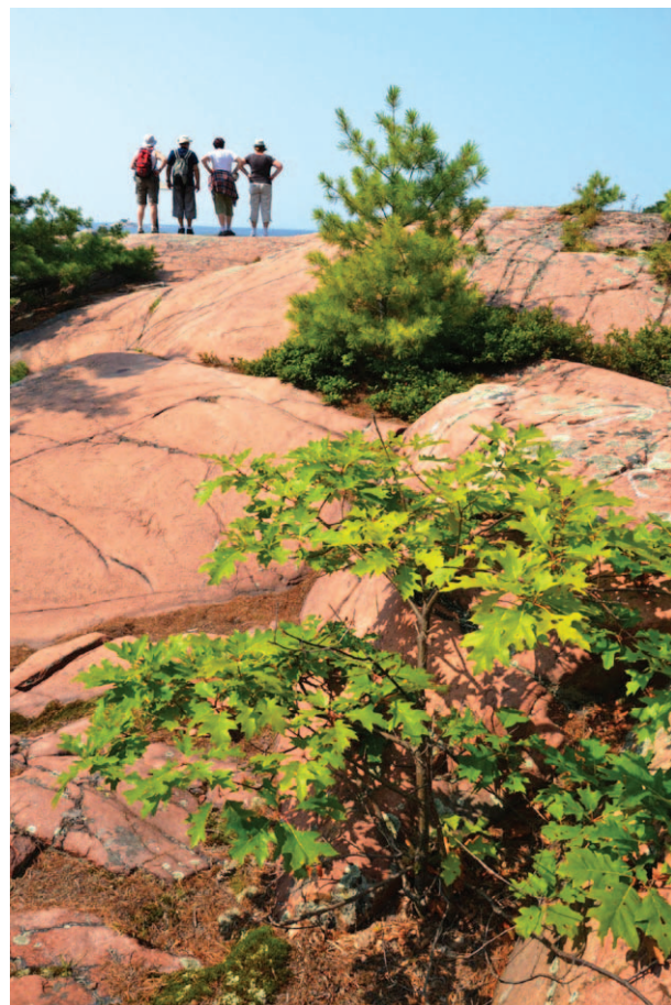
Tu dominują trzy kolory: róż, zieleń i błękit