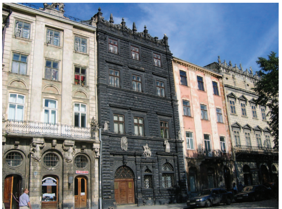
Rynek. Czarna Kamienica

Jak więc z jednej strony uniknąć błędów organizacyjnych, a z drugiej uzyskać maksimum osiągalnych korzyści? Przejdźmy cały proces organizowania wycieczki. Winno ono być zarówno materialne, jak i rzeczowe. Przygotowanie materialne ograniczyć się może do zebrania odpowiednich składek pieniężnych w przeddzień wyjazdu, może jednak wymagać dłuższych przygotowań. Konieczne jest to szczególnie, gdy mamy do czynienia z elementem uboższym. Zakorzeniło się