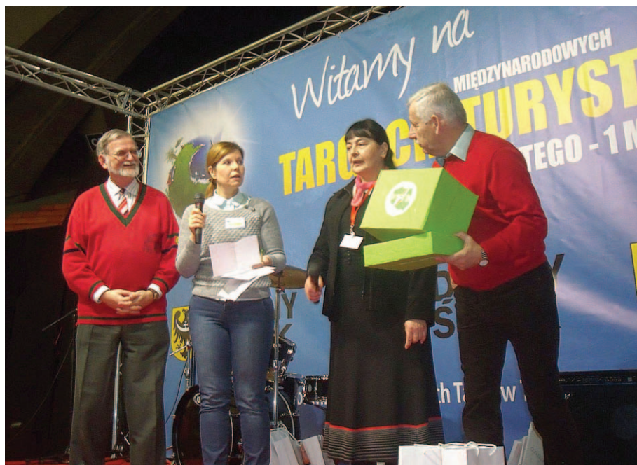
Przedstawiciele Oddziału Wrocławskiego PTTK wręczają nagrody