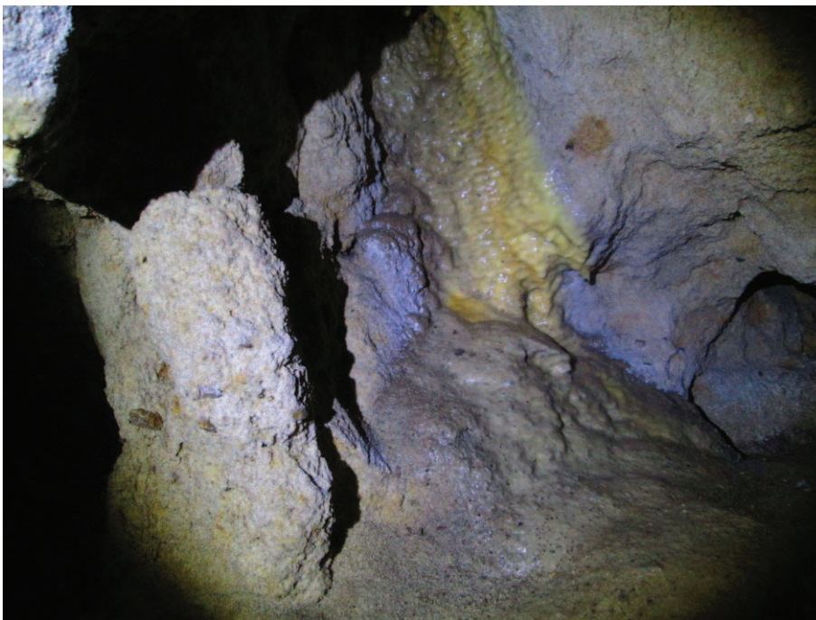
„Gniazdo szerszenia” w Bajce II

osuwiska, nawet jeden stromy i urwisty żleb. W jednej z bocznych odnóg znajdują się wychodnie skalne zlepieńca – piaskowca, w tym jedna objęta ochroną jako pomnik przyrody nieożywionej. Widoczna skała ma 15 m szerokości i kilka wysokości. Nosi nazwę Okap Cieleczyński i zaliczana jest w poczet jaskiń i schronisk skalnych w regionie. Najlepszą porą do penetracji parowu jest zima. Wtedy najwięcej widać, no i można w miarę swobodnie iść. Od późnej wiosny do wczesnej jesieni bujna roślinność skutecznie broni dostępu, zwłaszcza do bocznych dolinek i wąwozów. Poza tym, zimą mróz ścina podmokłe dno parowu, co pozwala na przekraczanie go w poprzek w kilku miejscach. Latem można tam zostawić buty grzęznąc po kolana w błocie. Najciekawsza część parowu liczy około 4 km długości w linii prostej, zatem trasa wycieczki wraz z wypadami w boczne odgałęzienia może mieć 8 do 10 km. Parów Cieleczyński jest doskonale uwidoczniiony na zdjęciu satelitarnym serwisu Google. Planowane jest objęcie całego parowu ochroną rezerwatową jako jednego z elementów Zespołu Parków Krajobrazowych Dolnej Wisły. Z tymi i innymi atrakcjami regionu można się wstępnie zapoznać odwiedzając stronę