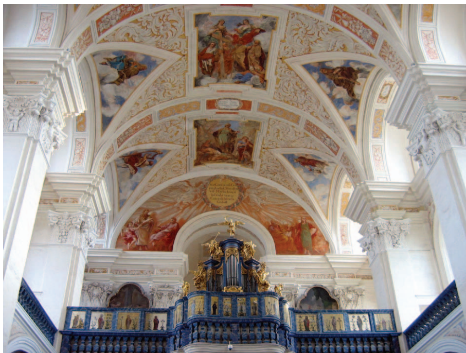
Chór organowy kościoła św. Józefa

Tomek Gałwiaczek