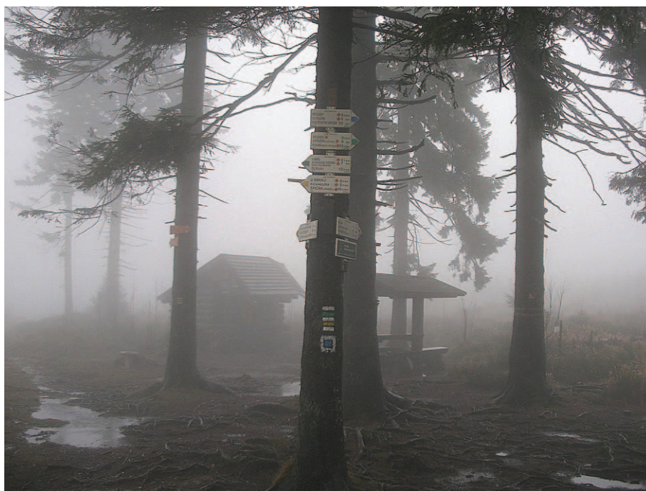
Na Przeł. Trzech Granic