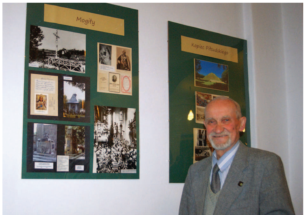
Autor wystawowej kolekcji