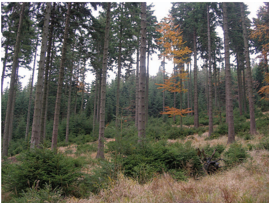
Jesienne kolory w Górach Żłotych

Nim wjechałem między zbocza gór, zobaczyłem obiecujące kolory świtu: wśród granatowych chmur mały fragment nieba świecił złotym blaskiem pomazanym smugami najprawdziwszego, intensywnego różu, ale, gdy u celu wysiadłem z samochodu, szczytów gór już nie widziałem. Szedłem w gęstej mgłę targanej silnym wiatrem, widząc przed sobą tylko kilka najbliższych drzew i kawałeczek ścieżki wśród traw i kamieni; momentalne, gnające z wiatrem, zmiany gęstości mgły czyniły silne wrażenie – jakby mleczne opary ożywały i mijając mnie pędziły gdzieś niczym zjawy. Moja czarna kurtka zmieniała kolor pokrywając się srebrzystym nalotem zatrzymanej mgły