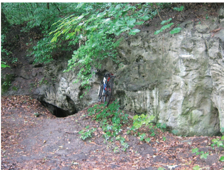
Wejście do Bajki I latem

Początek parowu wyznacza mostek na szosie (niebieskie barierki) nad strumieniem i samotne gospodarstwo po lewej (ule). Przy szosie tablica informacyjna. Przejście parowem jest możliwe jedną lub wieloma niskimi ścieżkami, czasem pojawia się jakaś nieużywana i zanikająca nagle droga. Stromymi zboczami wiodą liczne zwieryjące ścieżynki. Spotkać tu można sarny i ślady bytowania dzików: buchtowiska i wyleżyska, jest też zalew i tama zbudowana przez bobry na Strudze Niewieścińskiej. Parów ma liczne boczne odnogi, na zboczach