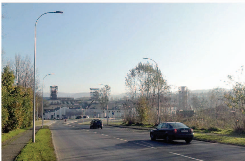
„Julia” w połowie lat 50. i współcześnie