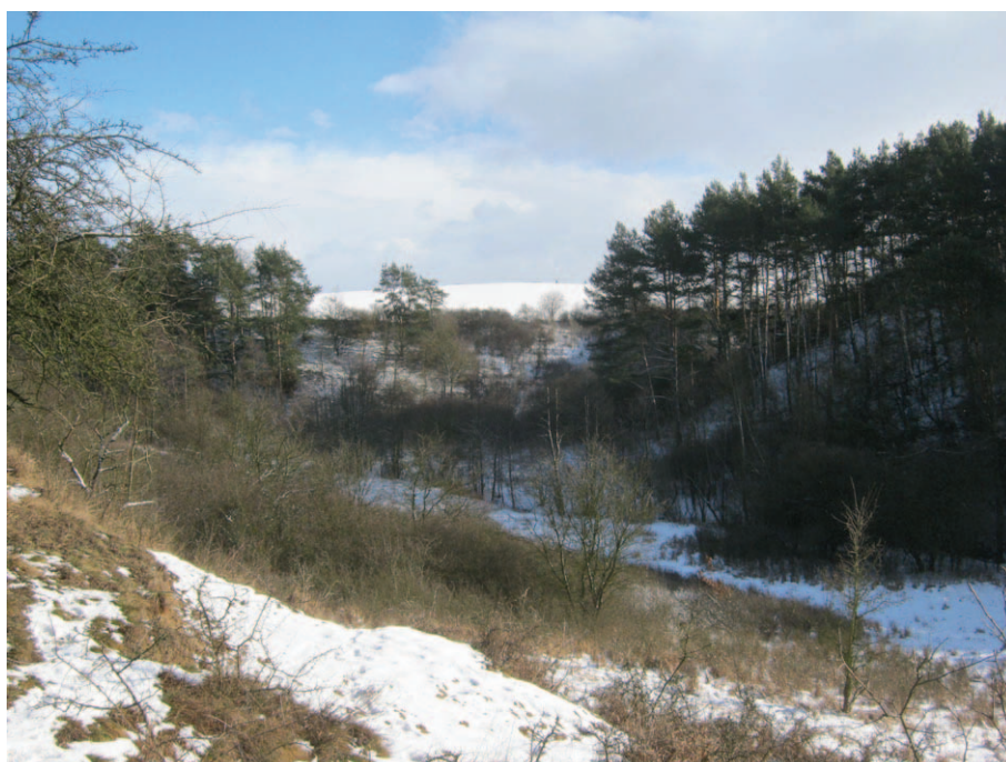
Środkowa część Parowu Cieleczyńskiego

Z asfaltowej szosy szutrową drogą pod górę w kierunku Gądeczka w kilkanaście minut dochodzi się, w kilka zaś dojeżdża na rowerze do miejsca, z którego trzeba dostać się na dno parowu (Gądeczki Jar) i wspiąć na taras w przeciwnym zboczu, gdzie mieści się Bajka I i II. Nie muszę dodawać, jak wygląda strome gruntowe zbocze w czasie ulewy. Zsunąłem się wraz z rowerem na dno parowu i podjąłem próbę podejścia na taras po osuwającym się podłożu i pokonując kilka powalonych drzew z moim „góralem” na plecach. Wysiłek się opłacił i niemożliwie ubłocony dotarłem do skalnej wychodni z dwiema dziurami. Kilka minut zabawiłem w jaskini robiąc zdjęcia, potem – chcąc uniknąć ponownego pokonywania zboczy parowu, poszedłem wąską ścieżynką trawersującą zachodnie zbocze do miejsca, gdzie miało być nieco łatwiej dostać się na drogę. Łatwiej nie było, tylko nieco mniejsze wysokości do pokonania. Jeszcze podczas deszczu zjechałem na szosę, co skutkowało umyciem roweru z błota, po czym przez wspomniany Fordon pojechałem w kierunku Unisławia przez Ostromecko, Nowy Dwór i Gzin. Przy okazji obejrzałem kończącą się wtedy budowę drogi rowerowej, łączącej dziś Ostromecko z Unisławiem i Toruniem. W Nowym Dworze warto zatrzymać się na chwilę obok ciekawego budynku