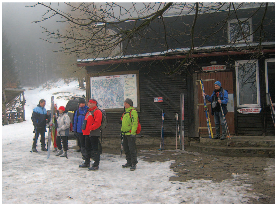
Przed wyruszeniem na szlak ze schroniska PTTK „Zygmuntówka”

Przybywali różnie, bądź samochodami, bądź komunikacją publiczną, co dodawało smaku przygody, bo niełatwo jest przedostać się na miejsce z Wrocławia lub Wałbrzycha. Pociągi i autobusy docierają w okolice rzadko i nie zawsze o odpowiedniej dla podróżnego z głębi Kraju porze. Niektórzy drałowali