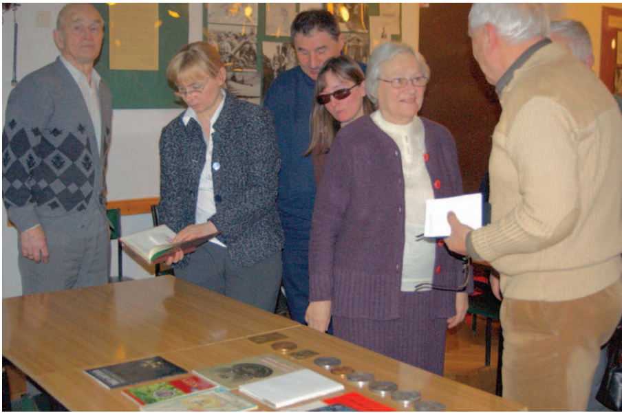
Przy pamiątkach legionowych