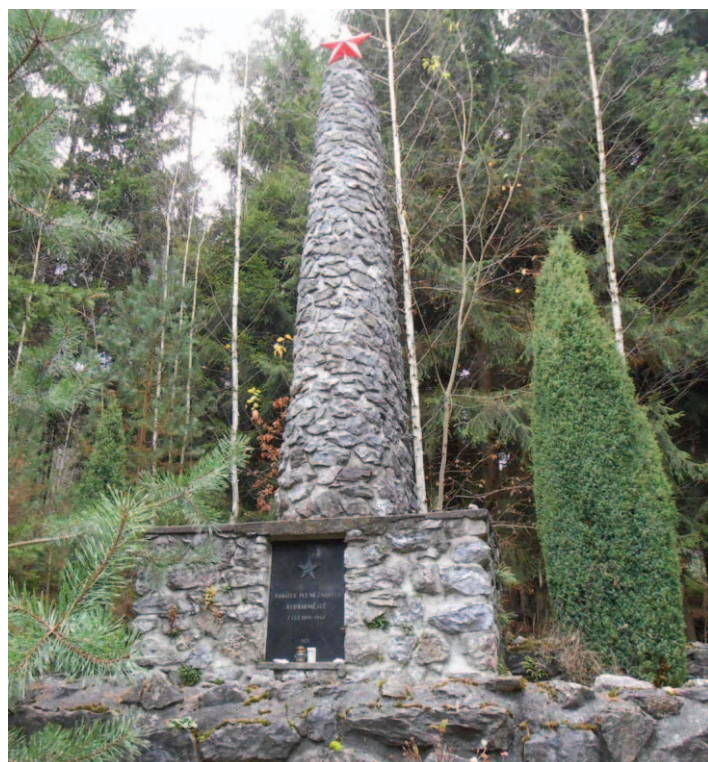
Pomnik upamiętniający jeńców radzieckich na zboczu wzniesienia Lišnice (489 m)

przez Rów Górnej Nysy, obserwując z jednej strony Masyw Śnieżnika, zaś z drugiej Góry Bystrzyckie. Z goła inne wrażenia pozyska turysta jadący ruchliwą szosą nr E442 na odcinku Koclířov – Morawska Trzebowa. Po wyjechaniu z tunelu, znajdującego się jeszcze na obszarze Płyty Czeskiej, rozpocznie on bowiem zjazd w dół. Tym samym będzie on... (z)wjeżdżał w Sudety. Rzadki to przypadek, by do pasma górskiego zjeź-