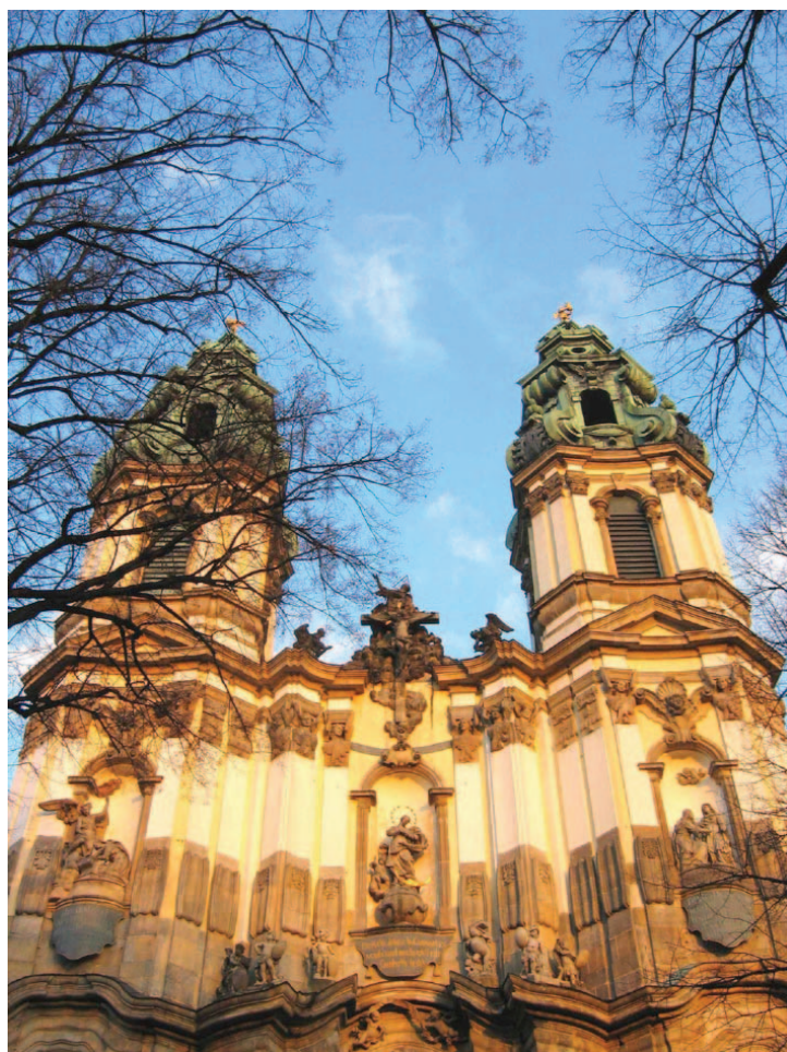
Fasada Złotego Domu – kościoła opackiego

W pobliskim Łańcutie pobudował książę Bolko I r. 1294 kościół farny. Przywilej z 21 października 1334 r. nadaje Łańcutowi 50 włók ziemi w Vogelsdorf i Dolnem Zadrzu [dawny Czadrówek, obecnie w granicach Kamiennej Góry]. W czasie trzydziestoletniej wojny ucierpiał Łańcut wiele tak ze strony Szwedów, jak i wojsk cesarskich. Pod Łańcutem zniósł 23 stycznia 1760 roku w siedmioletniej wojnie