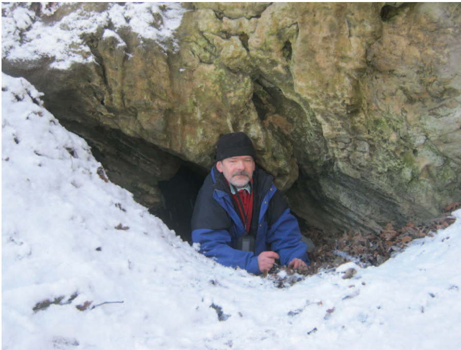
Autor w otworze Bajki I