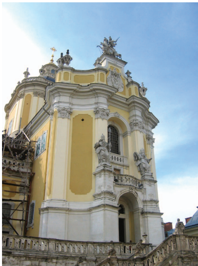
Katedra św. Jura