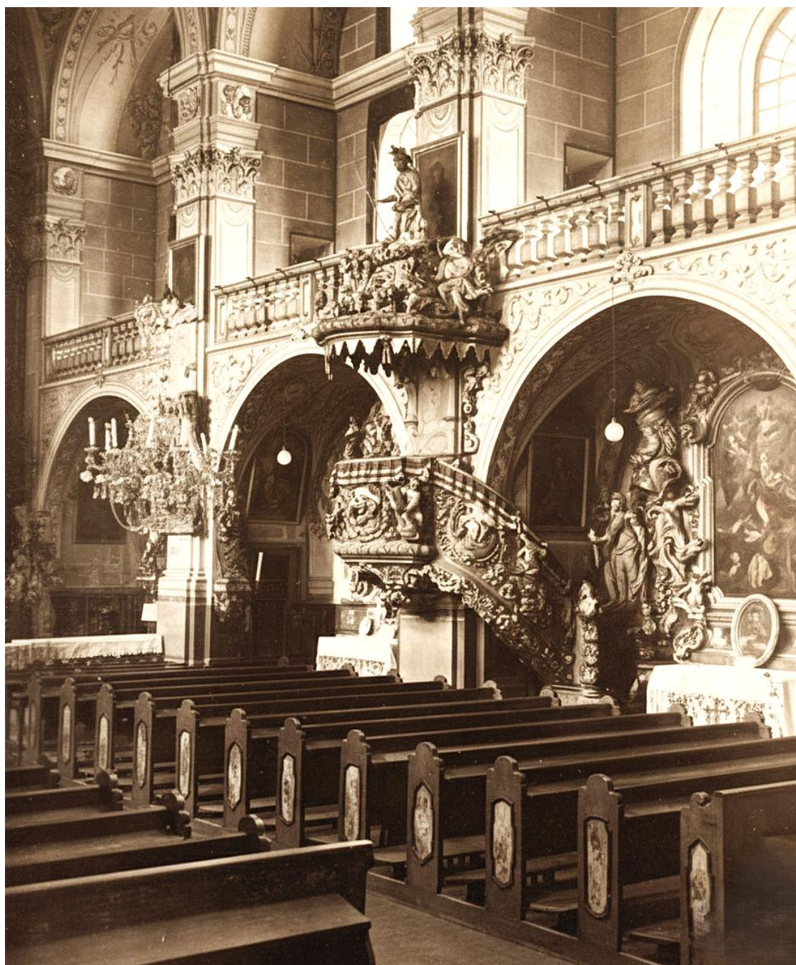
Rys. 1. Barokowa ambona, po prawej ołtarz 14 Świętych Wspomożycieli.

Warto zwrócić uwagę na przewiązany tłumok podróżny za jego plecami – atrybut, który jest powszechnie nieznanym. Wskazuje on, że święty ten, w XVII i XVIII wieku często wzywany w „pilnych i trudnych” sprawach, czczony był prawdopodobnie także jako patron dobrej i szczęśliwej podróży, co odpowiada dzisiejszej roli św. Krzysztofa. Antependium ołtarza zawiera tablicę pamiątkową ku czci poległych w I wojnie