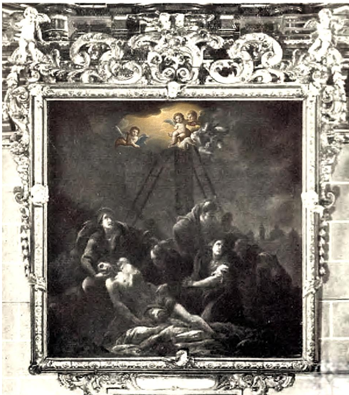
Rys. 2. Hoffmann. Zdjęcie z krzyża (1736).

Opuszczamy kościół przez główną bramę i kierujemy się w lewo, ku fasadzie wschodniej. Mniej więcej w połowie wysokości ściany, w dwóch niszach, stoją figury św.