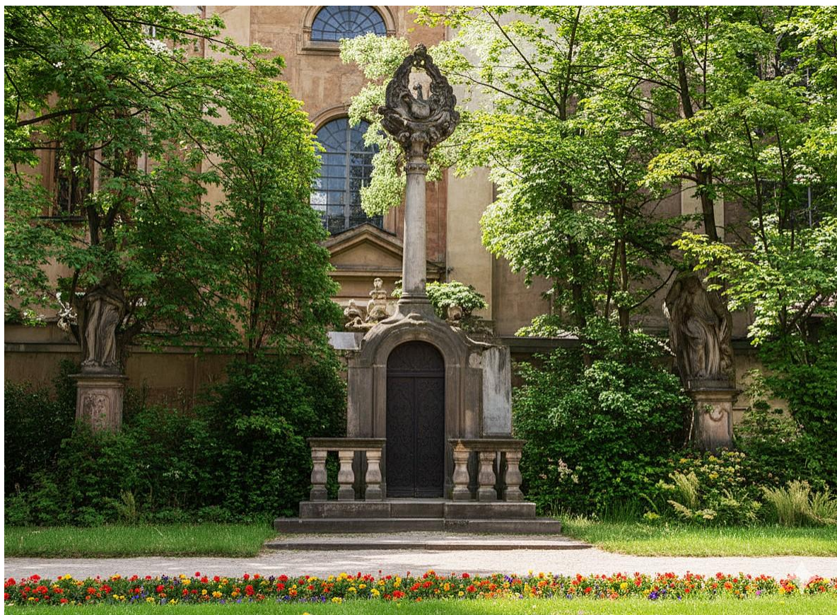
Rys. 3. Kolumna Trójcy Świętej na dziedzińcu klasztornym.