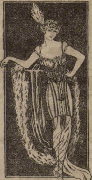
H. R. Nobility Corset No 2570