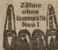
Zähne ohne Gaumenplatte Neu I Schloßplatz Nr. 4.

Sprechstunden 8—6 Uhr, Sonntags 8—2 Uhr.