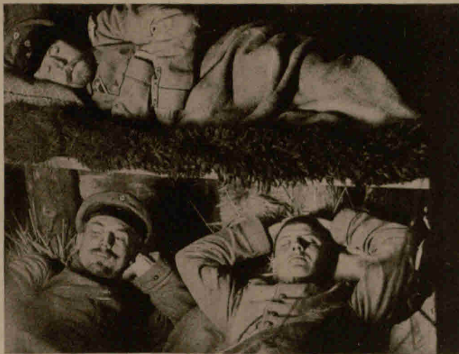
Deutsche Soldaten als Höhlenbewohner in Russisch-Polen