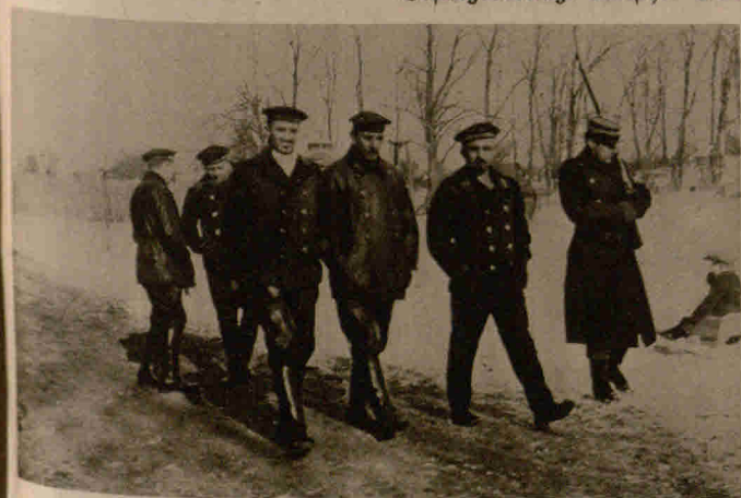
In Dänemark internierte deutsche Flieger von Z 2 und Z 3