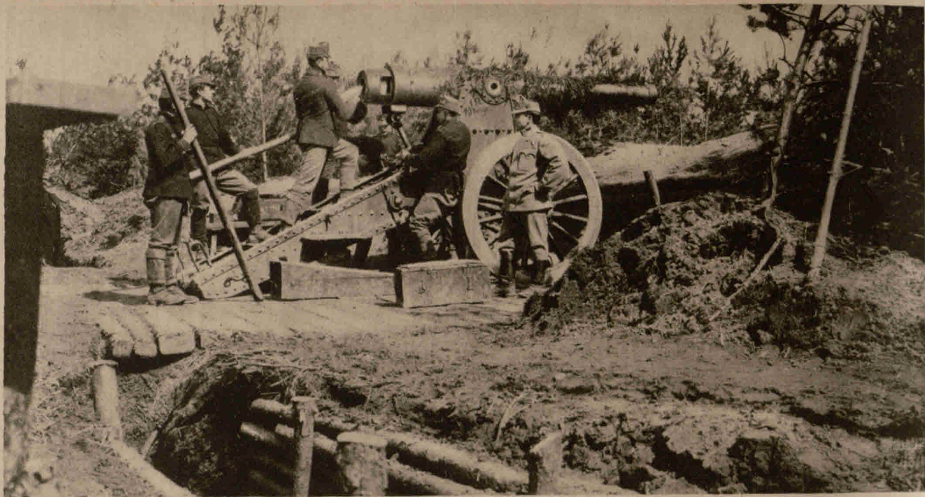
Schweres österreichisches Festungsgeschütz in Ladestellung