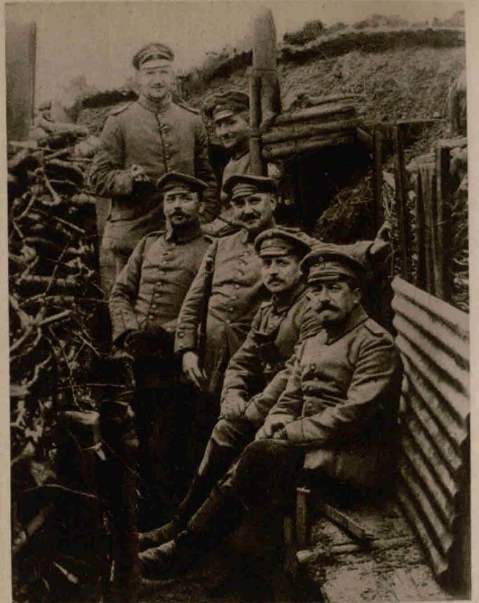
Von der Westfront: Offiziere im Schützengraben