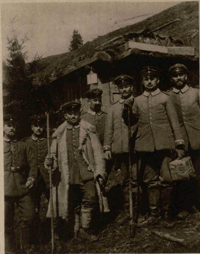
Vor einem festen Unterstand in den Karpathen