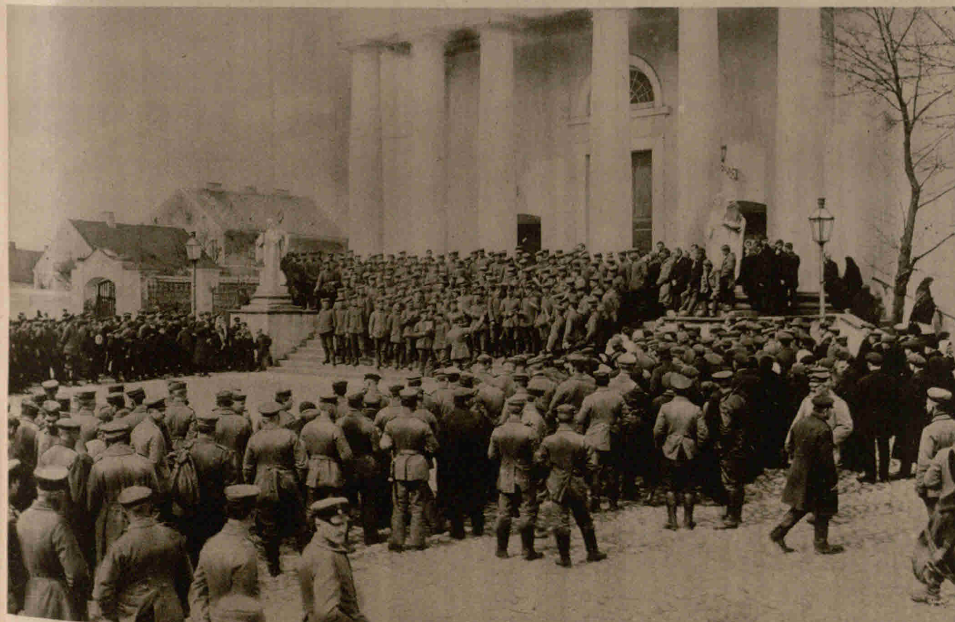
Gefangenvorträge deutscher Soldaten vor der Kirche in Suwalki