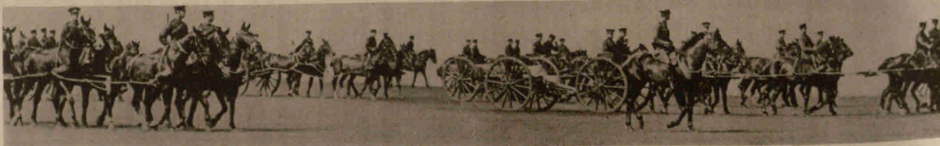
Englische Artillerie auf dem Wege zur Front