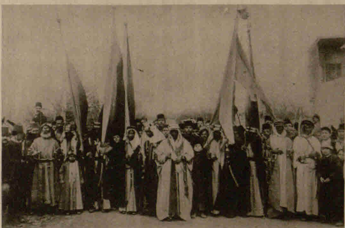
Der Beduinenhäuptling Ibn Reschid, der den von den Engländern auf ihre Seite gelockten Beduinenstamm Ibn Saouds in einer blutigen Schlacht besiegte, wobei der anführende englische Oberst und 4000 Mann auf seiten des Gegners fielen