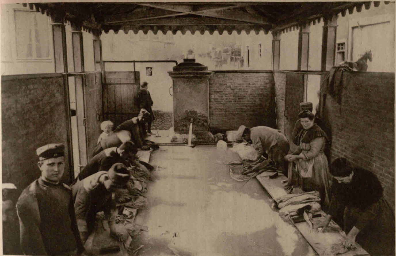
Deutsche Soldaten und französische Frauen in einem allgemeinen Waschhaus in Frankreich