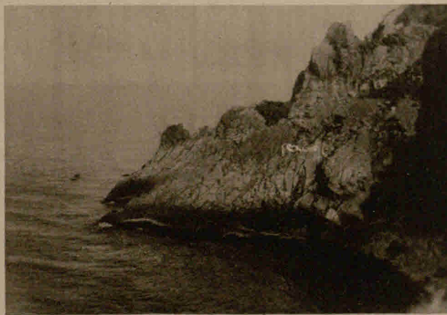
Zur Explosionskatastrophe in Lerwick auf den Shetland-Inseln: Felsige Klüfte an der Lerwickbai