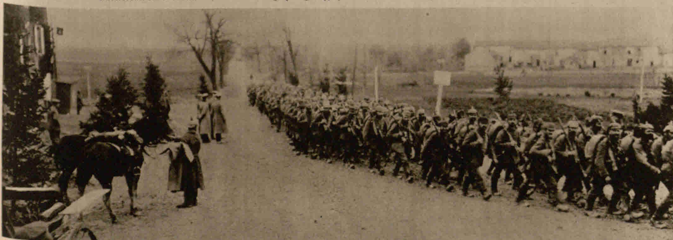
Zu den Kämpfen zwischen Maas und Mosel: Aus der Schlacht bei Pont à Mousson zurückkehrende Infanterieregimenter