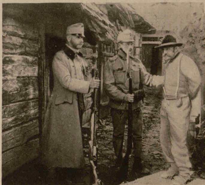
Verhör eines verdächtigen Bauern