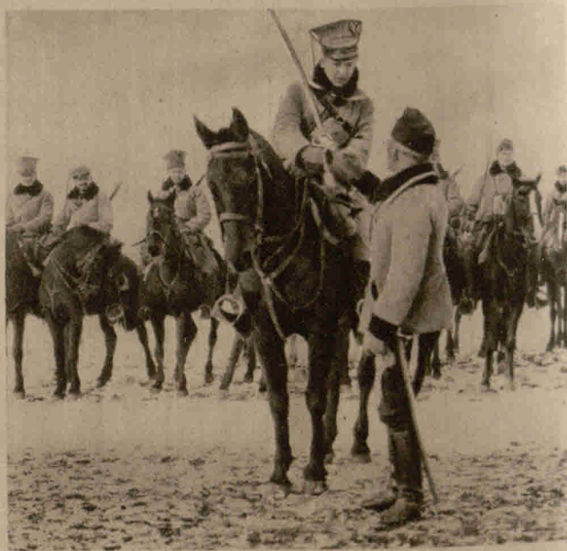
Die Polnische Legion