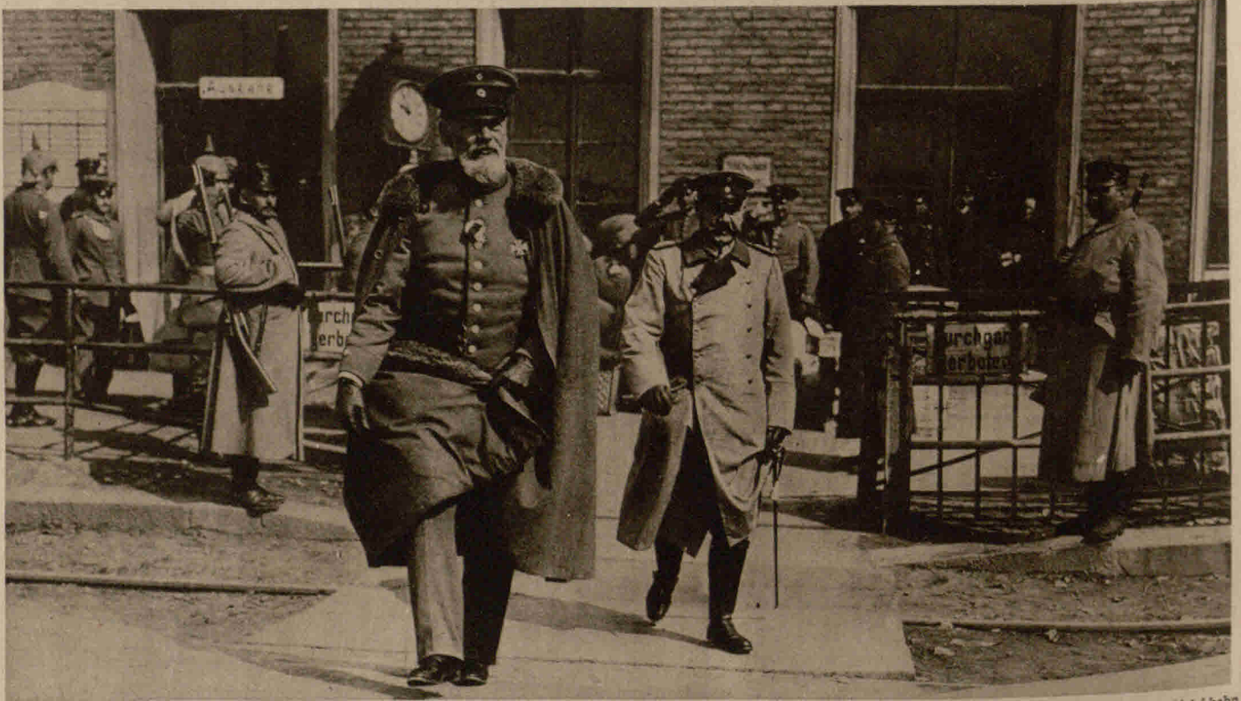
Prinz Leopold von Bayern, der Bruder König Ludwigs, weilte vor kurzem auf dem östlichen Kriegsschauplatz und besuchte in Begleitung des Feldmarschalls von Hindenburg verschiedene Verteidigungsstellungen an der russischen Grenze