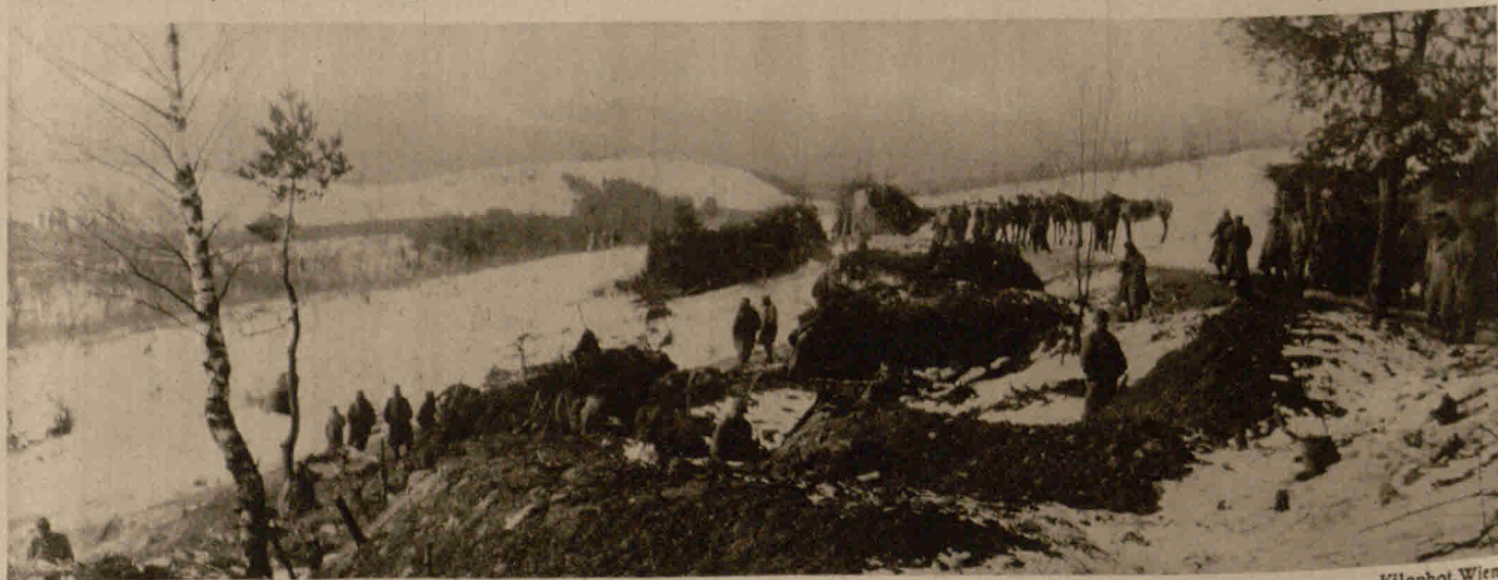
Unterstände der Tiroler Kaiserjäger auf einem Höhenzuge in Ostgalizien