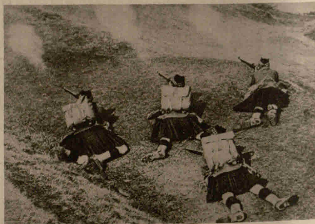
Von den Engländern: Royal Scots (Hochländer) auf Vorposten in den Dünen in Flandern