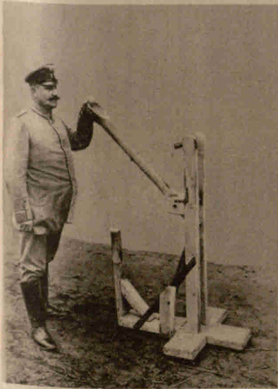
Eine erbeutete russische Bombenschleuder- maschine

Und das Plätschern wird zur Stimme Donnergrollender Gewalt, Wie ein Rette, der im Grimme Seinem Feind die Rechnung zahlt.