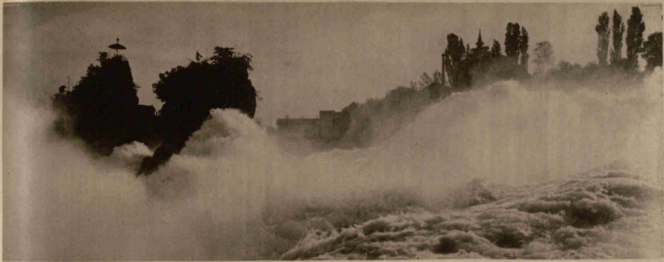
Das Tor des Rheins bei Schaffhausen mit Schloß Laufen, das jetzt als Lazarett dient