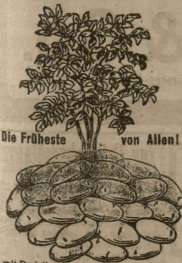
Die Früheste von Allen!

ist eine Neuheit, die Erstaunen hervorruft und schon Ende Mai die erste Ernte schöner feinschaliger delikater schmeckender gelbfleischiger Kartoffeln ergab. Trotzdem sie die Erste auf dem Markte ist, wurden mir