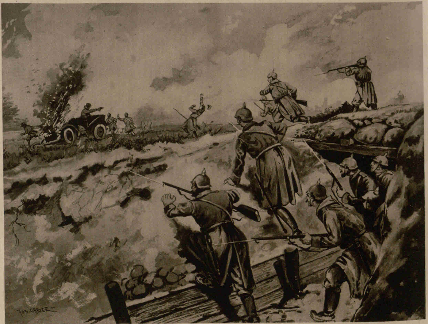
Abfangen eines feindlichen Automobils in Polen