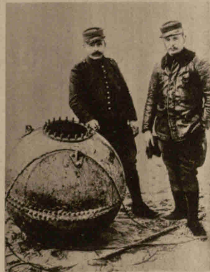
Eine an der belgischen Küste angeschwemmte Seemine