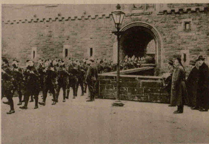
Militärisches Begräbnis des Kommandanten des Panzerkreuzers „Blücher“, der bekanntlich in englischer Gefangenschaft starb, vom Schloß Edinburgh aus