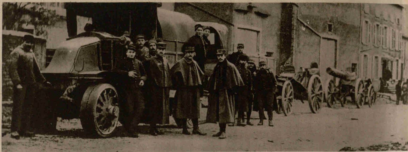
Aus der Champagne: Französische Motorbatterie auf der Fahrt zur Front