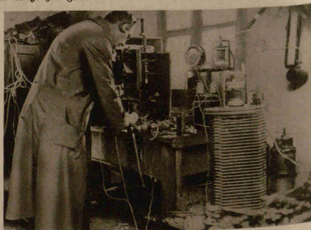
Eine deutsche Telefunkenstation in Damaskus, Phot. L. Pr. B. die bereits erfolgreich tätig war, indem sie unter anderem wiederholt mit der wichtigen Telefunkenstation Neuen Verbindung hatte und Telegramme des Eiffelturmes in Paris abging. Ihre Apparate sind dem vertriebenen Dampfer „Peter Rickmers“ entnommen.