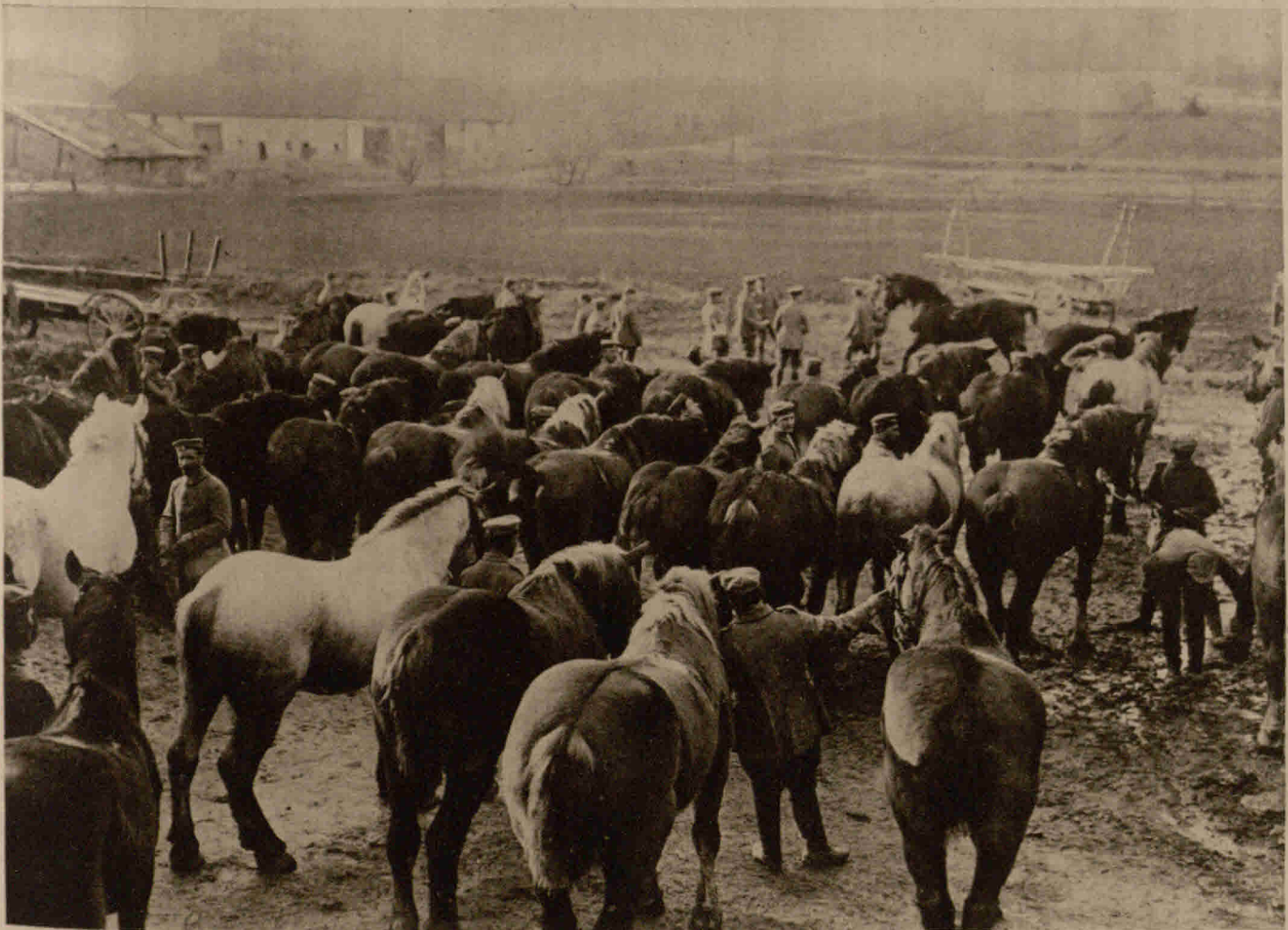
Musterung deutscher Militärpferde in einem französischen Gehöft In bestimmten Zwischenräumen werden die Pferde der Kavallerie untersucht, damit sie jederzeit für Gefechte tauglich sind