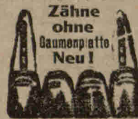
Schloßplatz Nr. 4.

Schloßplatz Nr. 4, neben Hotel Rosengarten. Hauptkassettele d. Elektrisch. Sprechstunden 8—6 Uhr, Sonntags 8—2 Uhr.