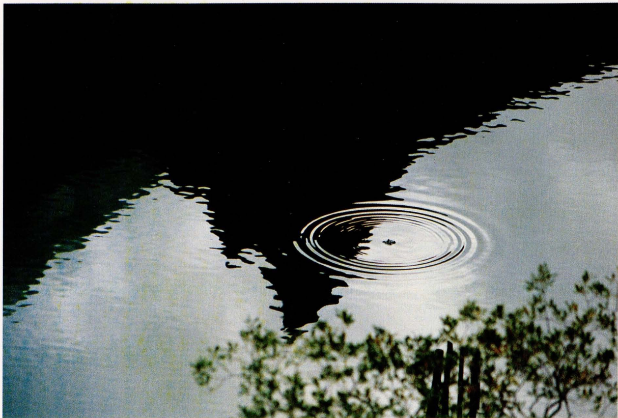
"Plusk... na odbiciu Mnicha" -1995 r.