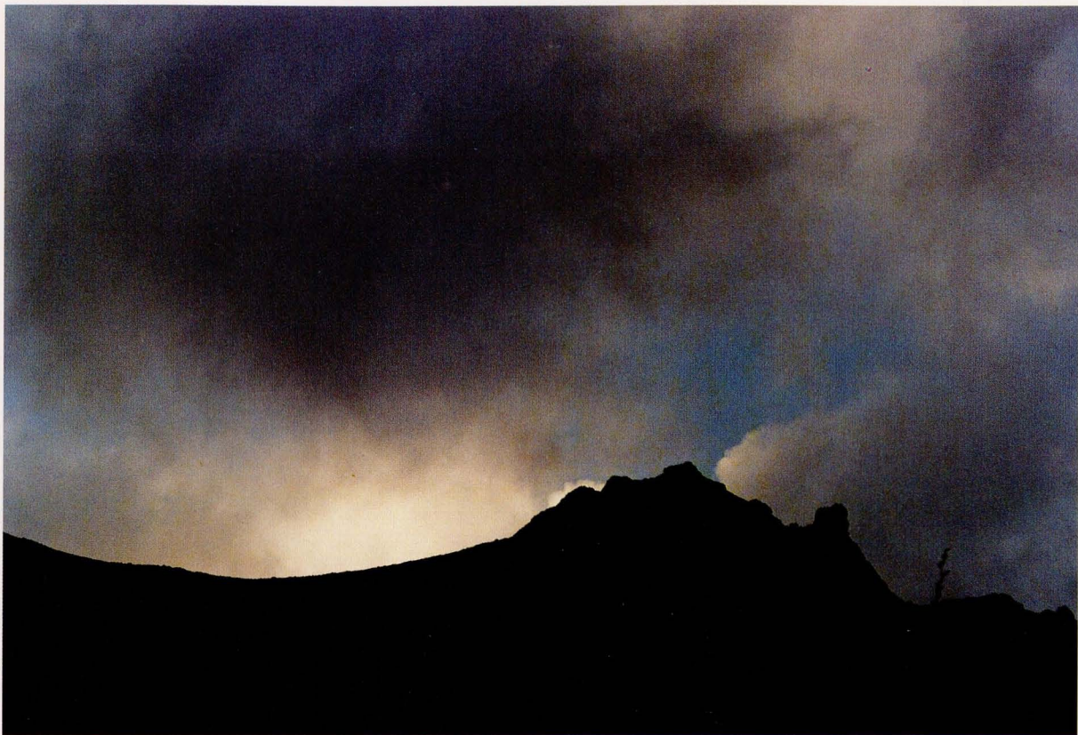
"Groźne chmury nad szczytami" - 1995 r.