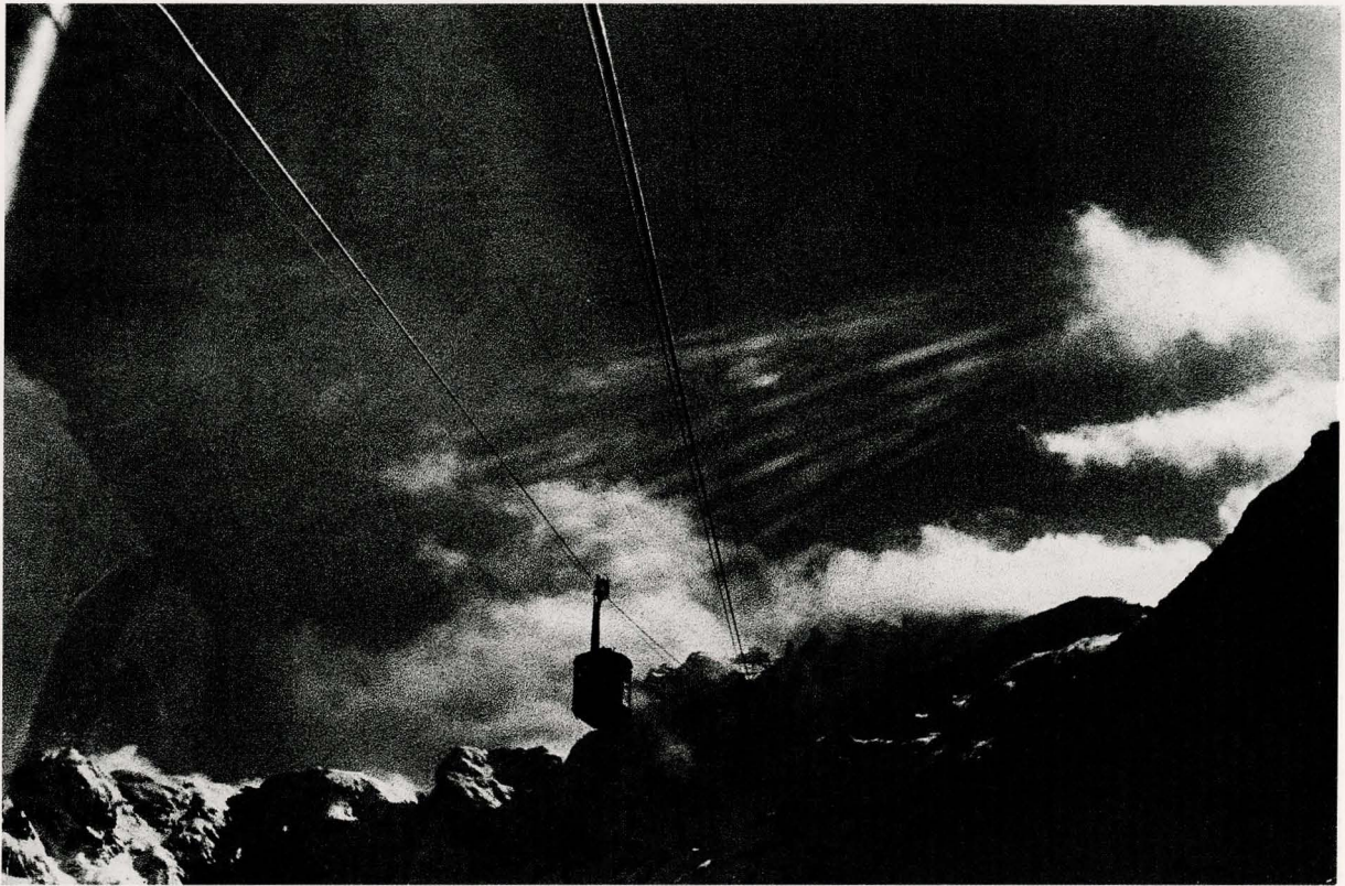
"Jasność w Górach" - 1948 r.