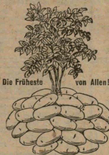
Die Früheste von Allen!

ist eine Neuheit, die Erstaunen hervorruft und schon Ende Mai die erste Ernte schöner feinschaliger delikater schmeckender gelb fleischiger Kartoffeln ergab.