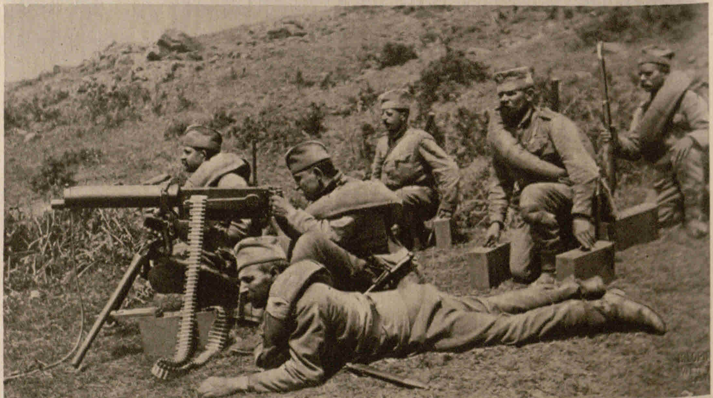
Serbisches Maschinengewehr russischen Ursprungs in Feuerstellung

schleppte man sich mutig weiter und kam glücklich durch alle Malaria- und Typhusgegenden. Endlich erreichten die Reisenden Kleinasien. Dann kam das Taurusgebirge, die Wildnis. Mit ungebeugter Energie überwand die Reisenden alle Hindernisse, bis sie endlich die Endstation der Bagdadbahn gewannen, die sie durch Kleinasien nach Konstantinopel beförderte. Von dort ging es weiter über Adrianopel, Bulgarien, Rumänien, Budapest und Wien nach dem Vaterlande. Dreißig Tage währte die abenteuerliche Reise unter unerhörten Strapazen und Gefahren. Es sei ein Wunder des Himmels, betont der Arzt in einem Briefe an seine Mutter, daß er heil und gesund nach Deutschland gelangt sei. Einzelheiten zu berichten, sei er vorläufig noch außerstande, er müsse sich erst einigermaßen von den großen Anstrengungen erholen. Aber viel Schönes und auch Bitteres gebe es zu berichten. Trotz der ausgestandenen Strapazen stellte sich der Heimgekehrte sofort zur Ausübung seiner militärischen Pflicht und verfügte sich ungesäumt zu seinem Truppenteil, um seine berufliche Tätigkeit aufzunehmen. Es ist zu wünschen, daß der tapfere Jünger der Heil- kunde der Öffentlichkeit eine ausführliche Schilderung seiner inter- essanten und gefahrenreichen Reise übermittelt. Er verdient mit sei- nen wackeren Gefährten das höchste Lob und die wärmste Anerkennung des deutschen Volkes.