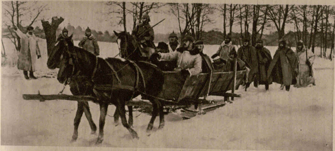
Der Schlitten als Kriegsfahrzeug: Verwundete werden unter Bedeckung ins Lazarett gebracht