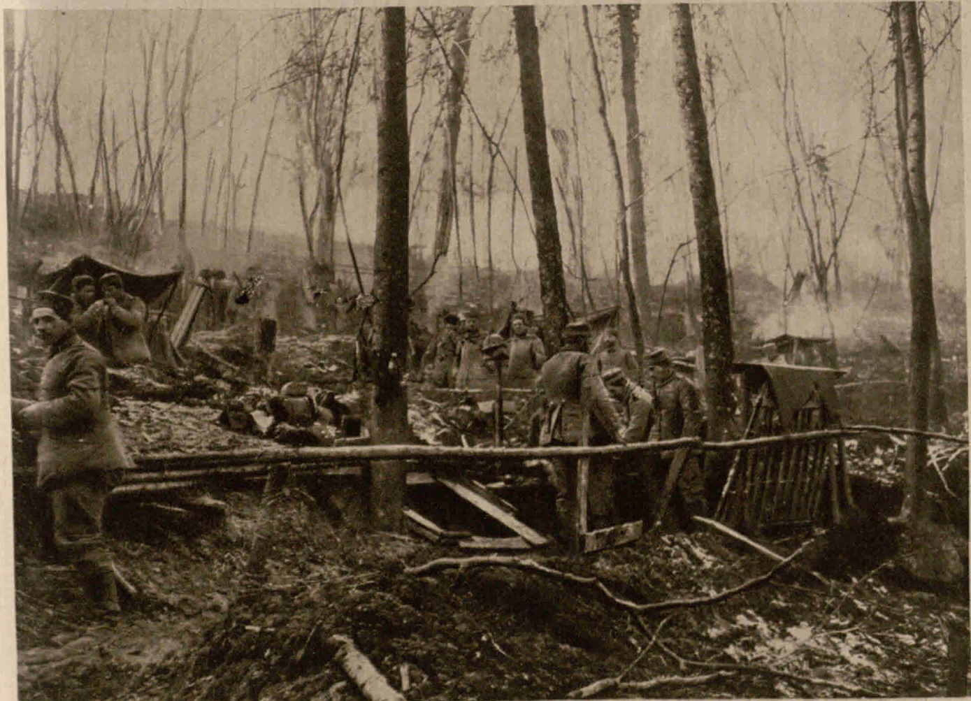
Deutsches Soldatenlager in Erdhöhlen bei Reuville