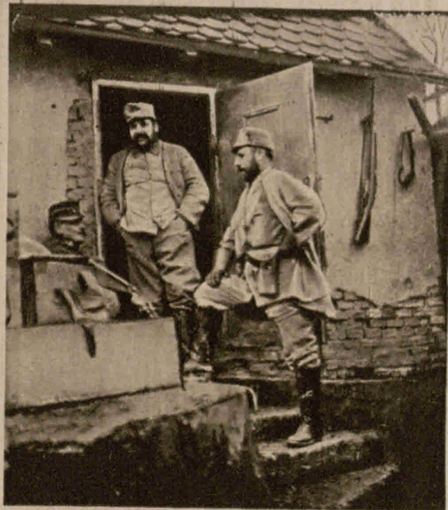
Ein idyllisches Quartier Österreich. Offiziere in einem ehemaligen Forsthaus in den Karpaten