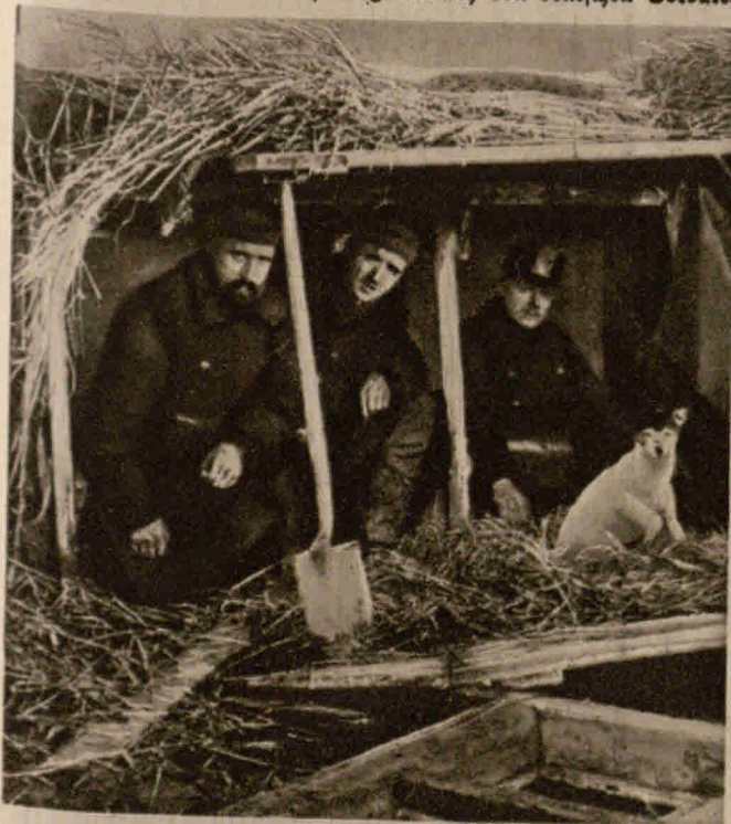
Bei der belgischen Armee: Ein geschützter Unterstand belgischer Soldaten