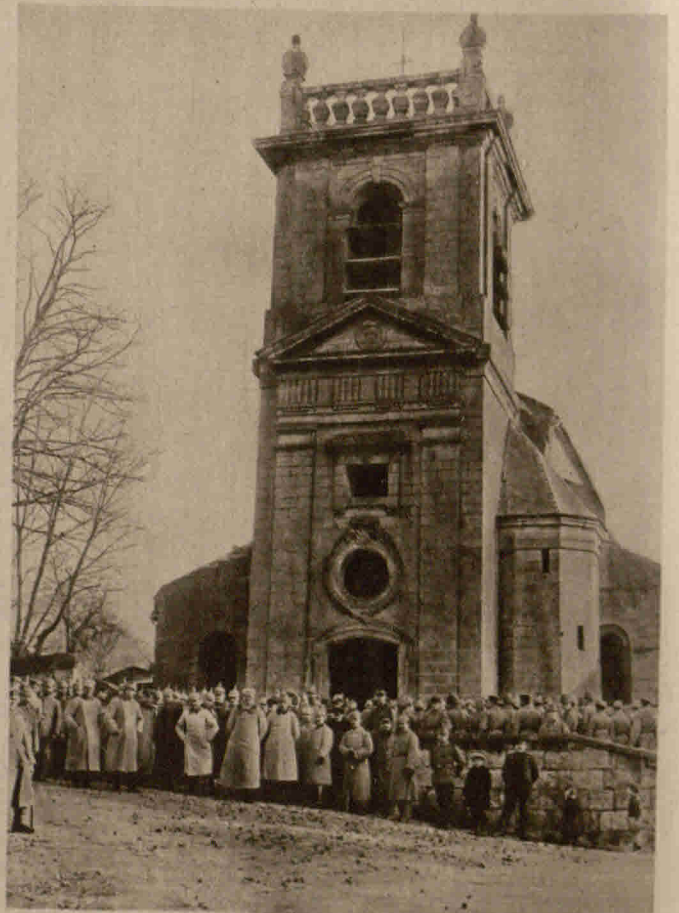
Strömgang deutscher Soldaten in Feindesland: Die hohen Offiziere mit der Mannschaft beim Verlassen der Kirche