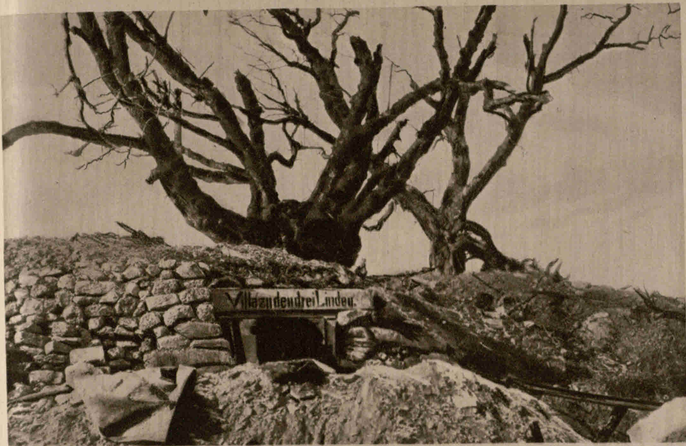
Unterstände der deutschen Truppen bei den historischen drei Linden nahe Reuville