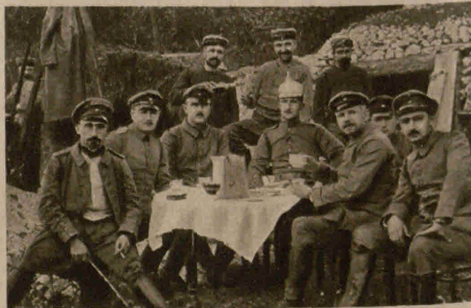
Eine Kaffeepause hinter der Front

Verantwortlich für die Redaktion: R. Langhoff, Berlin-Steglitz. — Verlag und Kupfertiefdruck Otto Elsner A.-G., Berlin S. 42, Oranienstraße 140/142. — Alleinvertrieb für Belgien und Frankreich: Alexander Steinmetz, Brüssel, Place Rogier 10. Sämtliche Bilder sind von der zuständigen Behörde zur Veröffentlichung genehmigt worden.