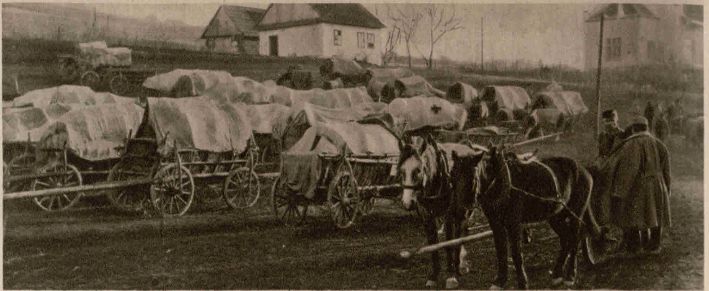
Oesterreichischer Sanitätstrain bei Limanova