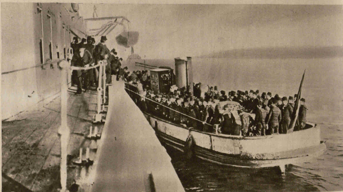
An Bord eines türkischen Kriegsschiffes: Matrosen fahren auf Urlaub nach Konstantinopel