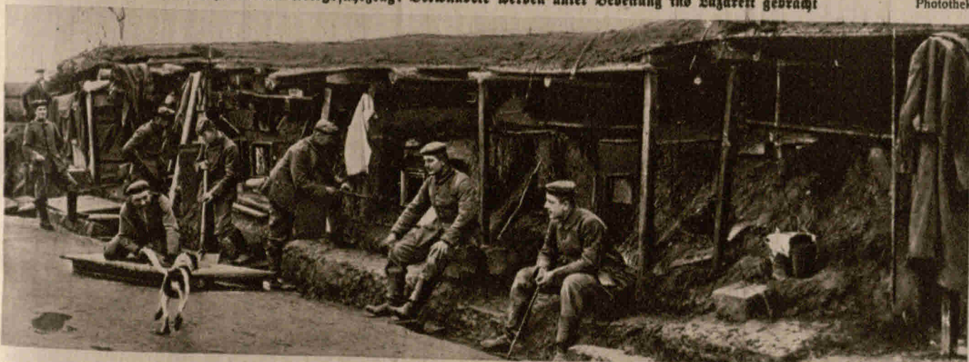
Die erste in Bailly in Frankreich von deutschen Soldaten erbaute Straße, die den Namen „Gättendorfstraße“ erhielt