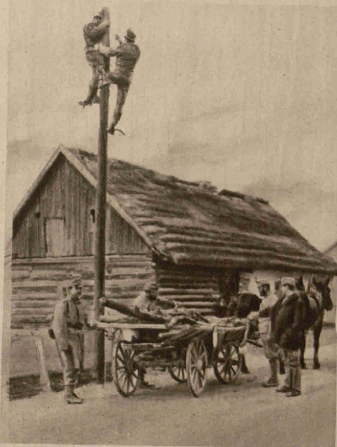
Wiederherstellung einer zerstörten Telegraphenleitung Kilophot G.m.b.H. durch die Oesterreicher an der Straße nach Neu-Sandec