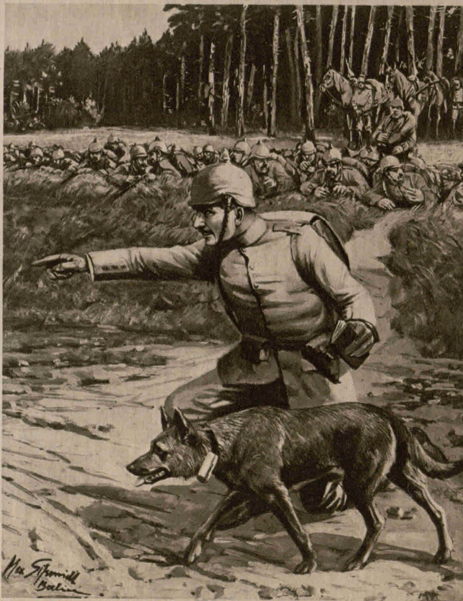
Abführung eines Kriegshundes mit wichtiger Meldung zur Front

Und sie stegten in den Jahren 1870/71 und 1914 und werden stegen 1915.