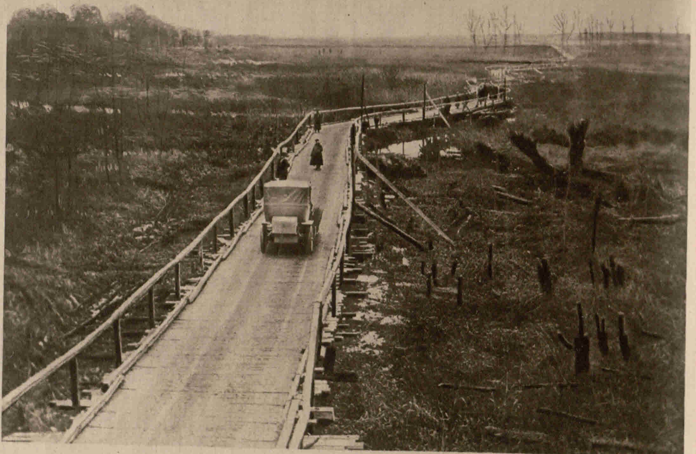
Ans H l a n d e r n: Im Ueberschwemmungsgebiet der Yser stellten deutsche Pioniere eine sich über das ganze Gelände erstreckende, binnen fünf Tagen passierbare Brücke her