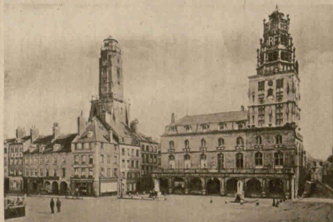
Calais wurde kürzlich von deutschen Luftfahrzeugen überflogen