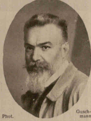
Professor Rudolf Schulte im Hofe, der berühmte Porträtmaler, feierte kürz- lich seinen 50. Geburtstag

Den Infanteristen Niediger aus Neubus traf bei einem Gefecht in Belgien eine französische Gewehrkugel, die durch das in seiner Tasche befindliche Portemonnaie hindurchging. Die Kugel drückte ein darin be- findliches Zweimarkstück völlig platt, während das andere Zweimarkstück nebst einem 5 Fig.-Stück auf der Rückseite des Portemonnaies herausging und dem Soldaten in den Oberschenkel drang. Das Zweimarkstück mußte in einem Breslauer Lazarett auf operativem Wege entfernt werden, während sich das kleine Geldstück noch im Körper des Verwundeten befindet