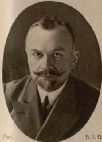
Mahmud Nuhfar Pascha , der türkische Gesandte in Berlin, wurde mit dem Roten Adlerorden ausgezeichnet