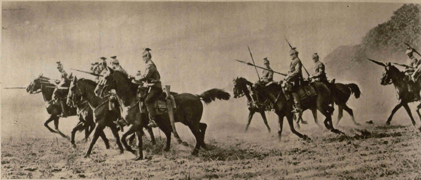
Ulanen im Vorgehen