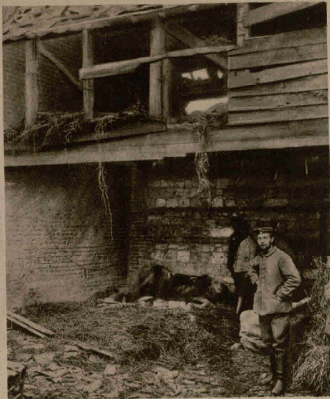
Einschlag und Wirkung einer französischen Granate, wodurch ein Pferd getötet wurde