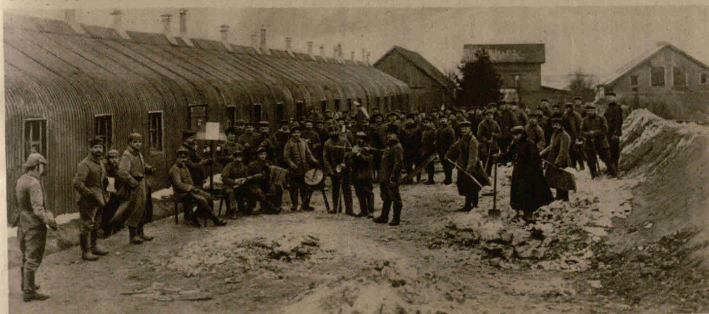
Die Hanseatische Landwehr beim Schneeschippen mit Musikbegleitung vor ihrer selbsterrichteten Wellblechbaracke an der ostpreussisch-russischen Grenze