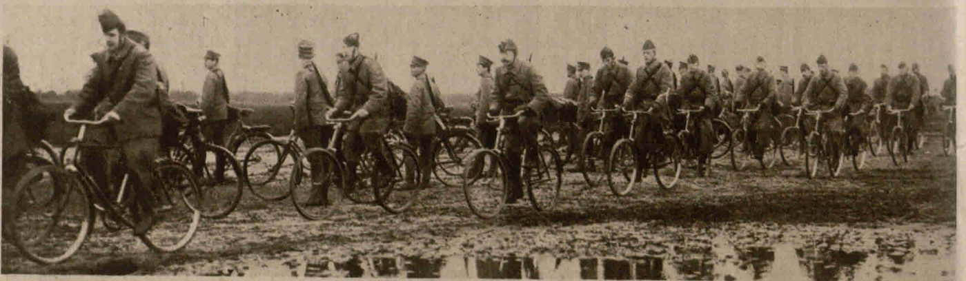
Übung holländischer Militär radfahrer