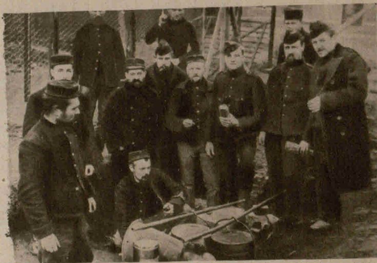
Auf holländisches Gebiet übergetretene Engländer in einem Internierungslager