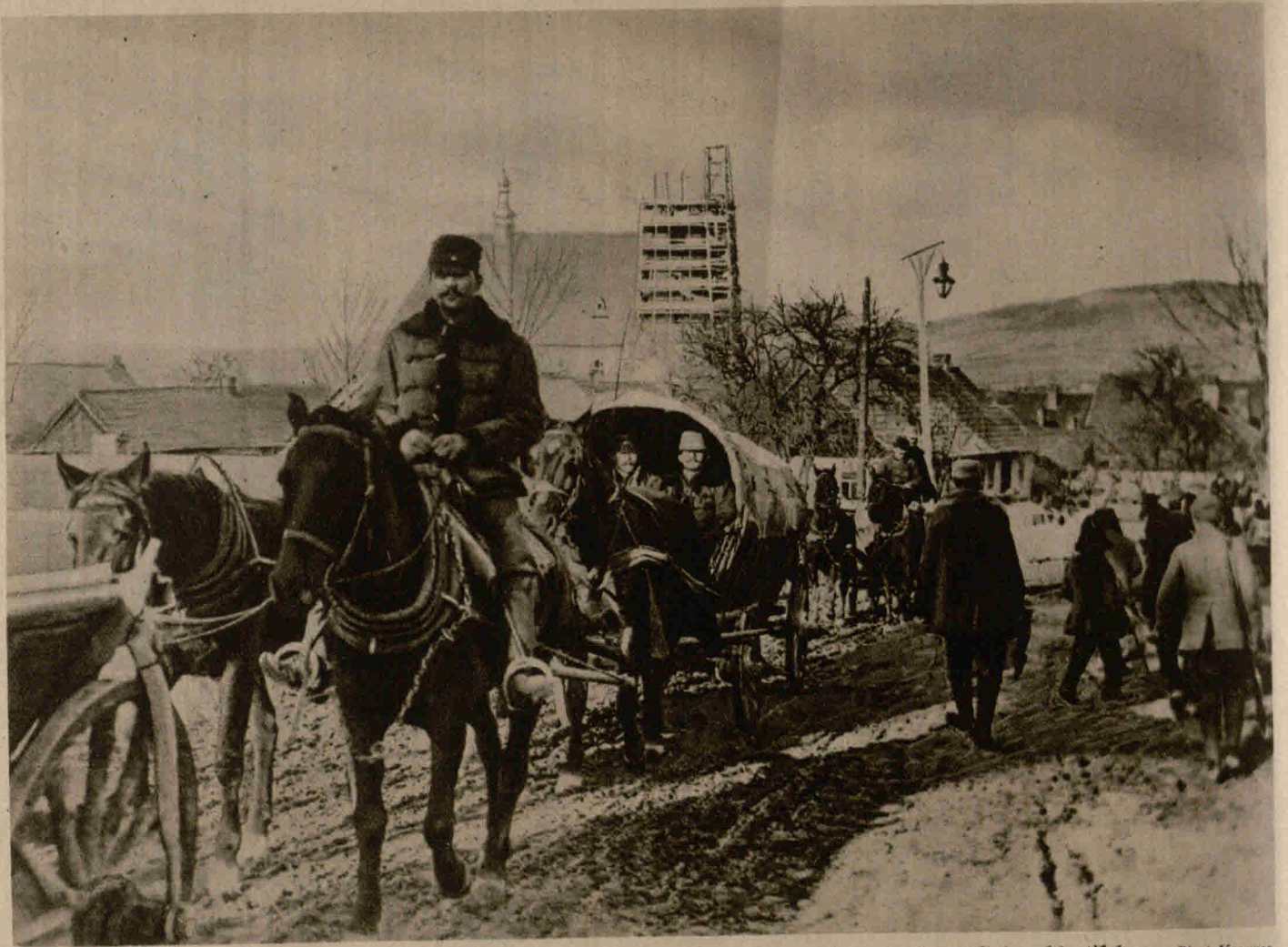
Trainwagen fahren der österreichischen Armee durch das eroberte Limanova Lebensmittel und Gebrauchsartikel zu