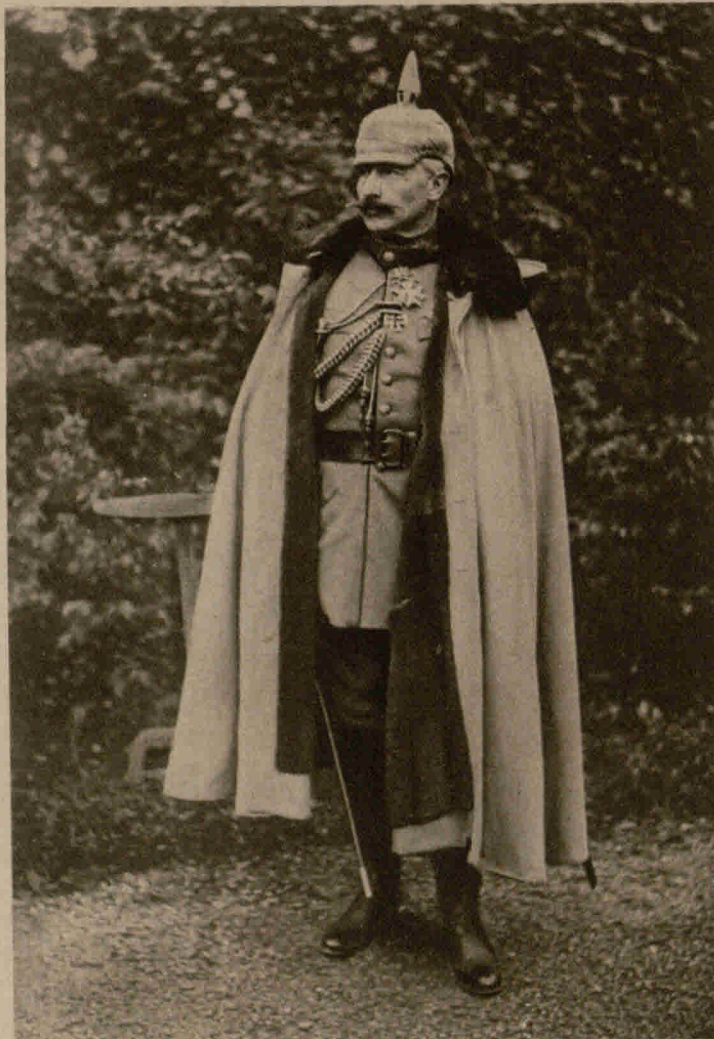
Neueste Feldaufnahme des Deutschen Kaisers

So weit war ich gestern gekommen, und da ich den Brief nicht los werden konnte, schreibe ich heute weiter. Wunderst du dich nicht über diesen langen Bericht? Ja, im Kriege lernt man eben alles, sogar Briefe schreiben, das war ja stets meine schwache Seite zu deinem größten Leidwesen. Aber weiter! Gestern saßen wir, sage und schreibe, in der Konditorei, das erste Glas Bier in der langen Zeit rann durch unsere Kehlen. Wie im tiefen Frieden lasen wir unsere Zeitung. Nein, das ist falsch gesagt. Wenn man die angstvollen Gesichter der Hiesigen betrachtet, dann weiß man, die Schrecken des Krieges haben ihre Runen darauf eingegraben. Viele sind schon geflohen, und alles drängt und hastet weiter. Wir sind in einem vornehmen Hause