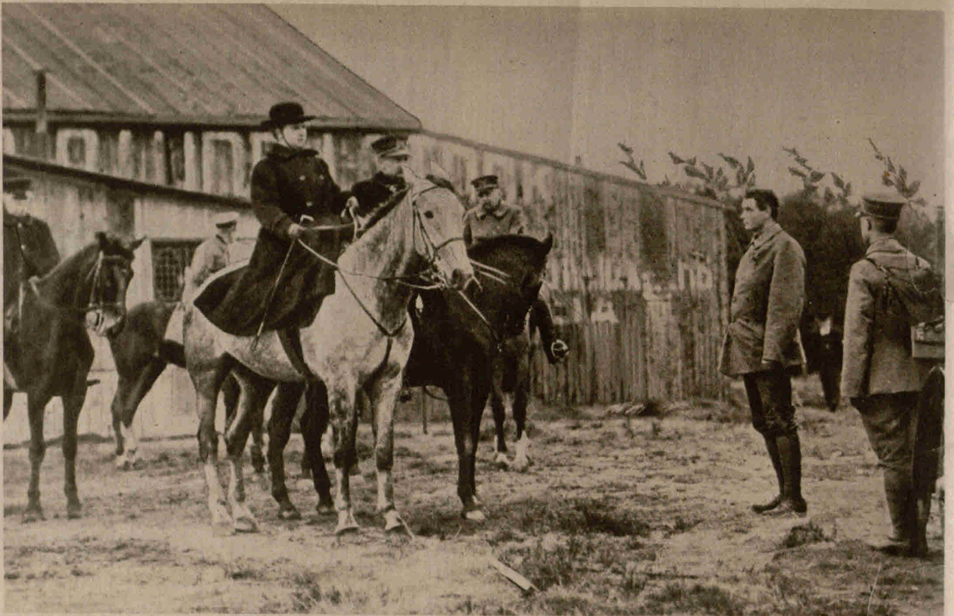
Königin Wilhelmina von Holland unterhält sich mit einem Fernentelegraphisten