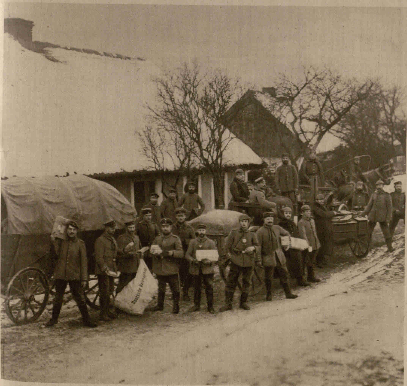
Ankunft eines Marktenderwagens an der russischen Grenze