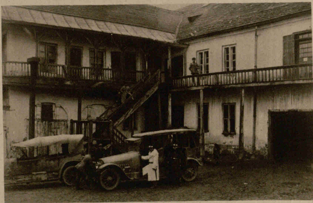
Typ eines russisch-polnischen Gutshofes. Das Gehöft ist von deutschen Soldaten besetzt