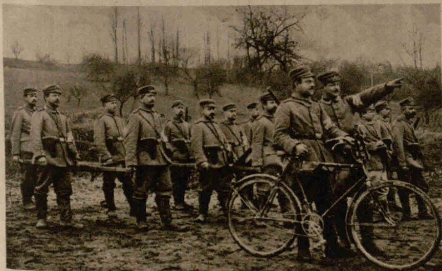
Eine Krankenträgerpatrouille auf dem Wege zum Schlachtfeld, um dieses nach Verwundeten abzusuchen

es gut geht, auf die doppelte Zeit!“ Der Fürst ließ den Advokaten sogleich festnehmen und verurteilte ihn zum Galgen.