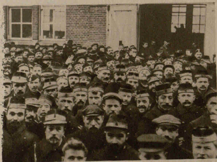
In Holland internierte belgische Soldaten in Erwartung ihrer wöchentlichen Löhnung