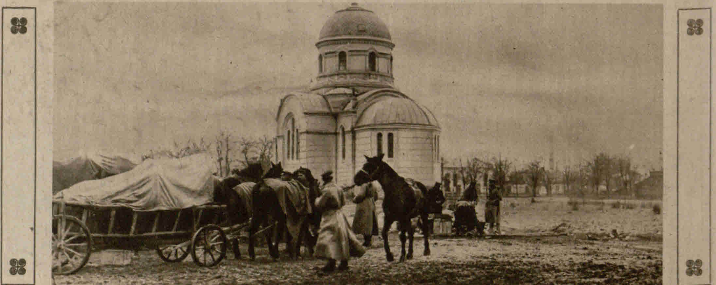
Die Kirche des von den Deutschen besetzten Ortes Sjeradz in Russisch-Polen; davor eine deutsche Munitionskolonne