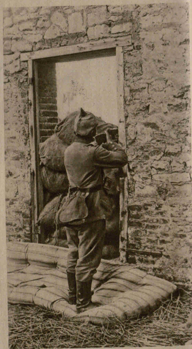
Ein Schütze an der verbarrikadierten Tür, die in den Garten führt, in dem sich die Schützenlinie hinter einer Mauer befindet