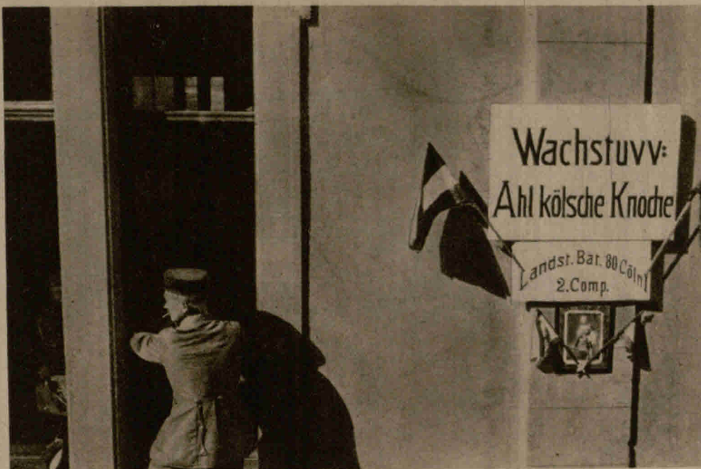
Wachstuvv: Ahl kölsche Knodie Landst. Bat. 80 Cöln 2. Comp.

Ein italienischer Fürst, der über das Treiben eines berühmten Advokaten sehr ungehalten war, ließ diesen zu sich kommen und teilte ihm mit, daß er einem seiner Bürger mehrere Hundert Zechinen schulde. Aus bestimmten Gründen wünsche er den Mann solange wie möglich hinzuhalten, und ersuchte dann den Advokaten ihm zu sagen, wie lange er den Prozeß in die Länge ziehen zu können glaube. „Wenigstens zehn Jahre,“ entgegnete dieser, „und wenn