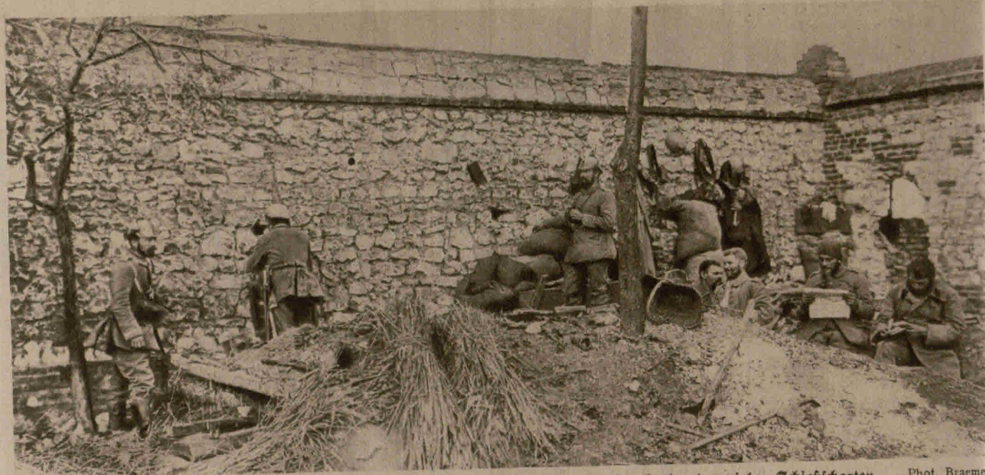
Teil einer westlichen Schützenlinie im Garten hinter einer Mauer. Durch eine der vielen Schießscharten in der Mauer wird der Feind ständig beobachtet