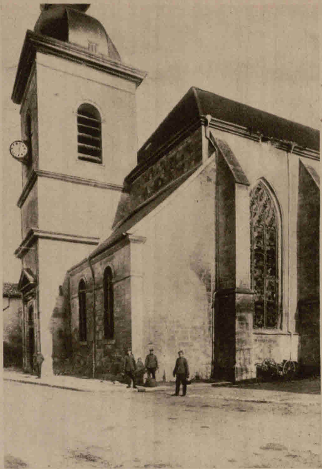
Die von den Franzosen beschossene Kirche St. Etienne in St. Mihiel