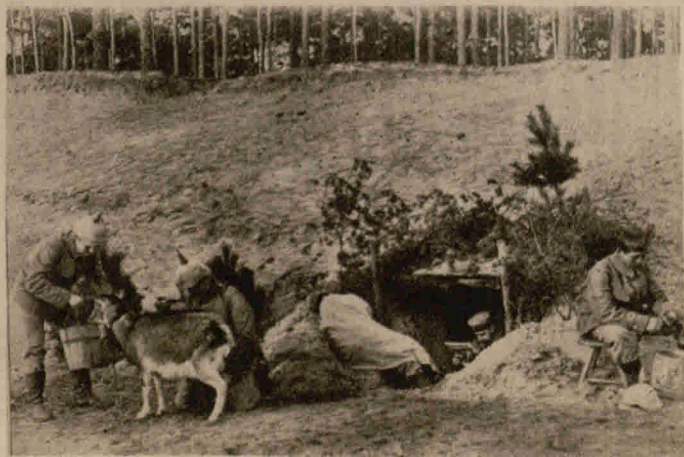
In den Kämpfen im Argonner Wald: Soldaten in einer Erdhöhle, die sicheren Schutz gegen feindliche Granaten bietet