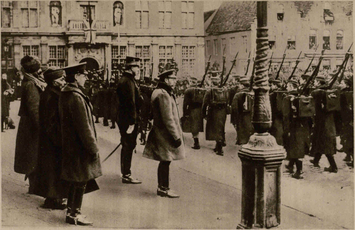
Der König von England und der König von Belgien mustern die belgischen Truppen in Flandern. Hinter dem König von England steht der Prinz von Wales und der indische Prinz Pertab Singh