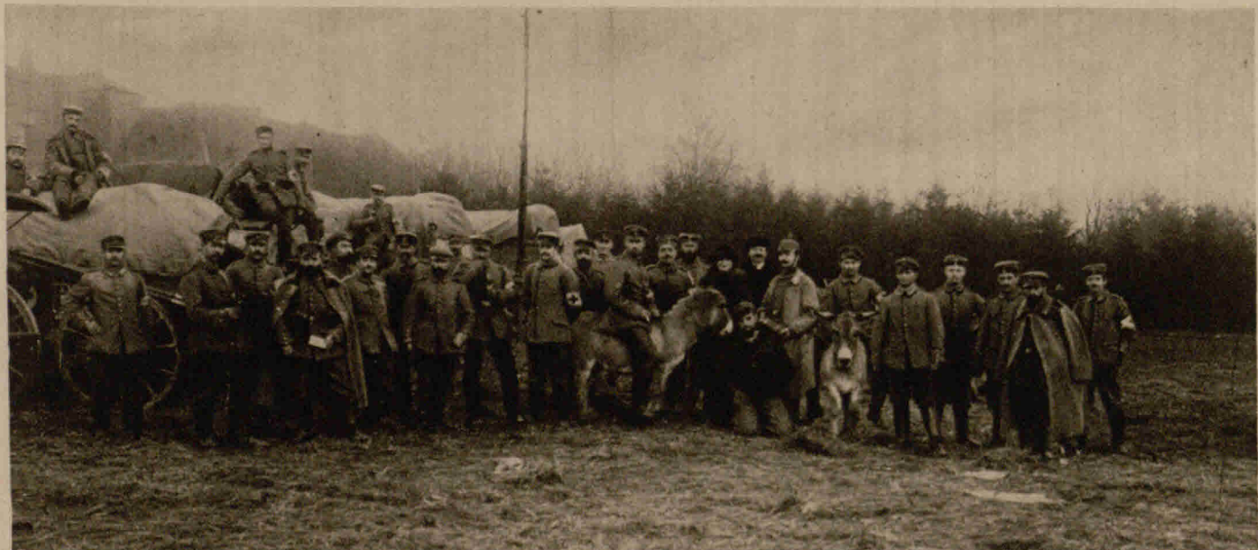
Lagerbild bei Kloster Langiewniki in Russisch-Polen: Eselreiten