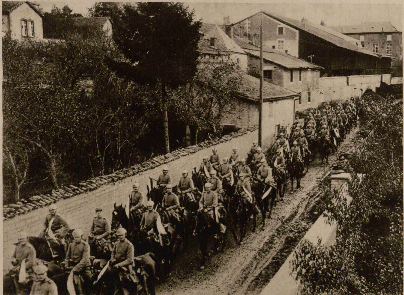
Ein deutsches Dragonerregiment passiert eine französische Stadt in der Nähe von Reims