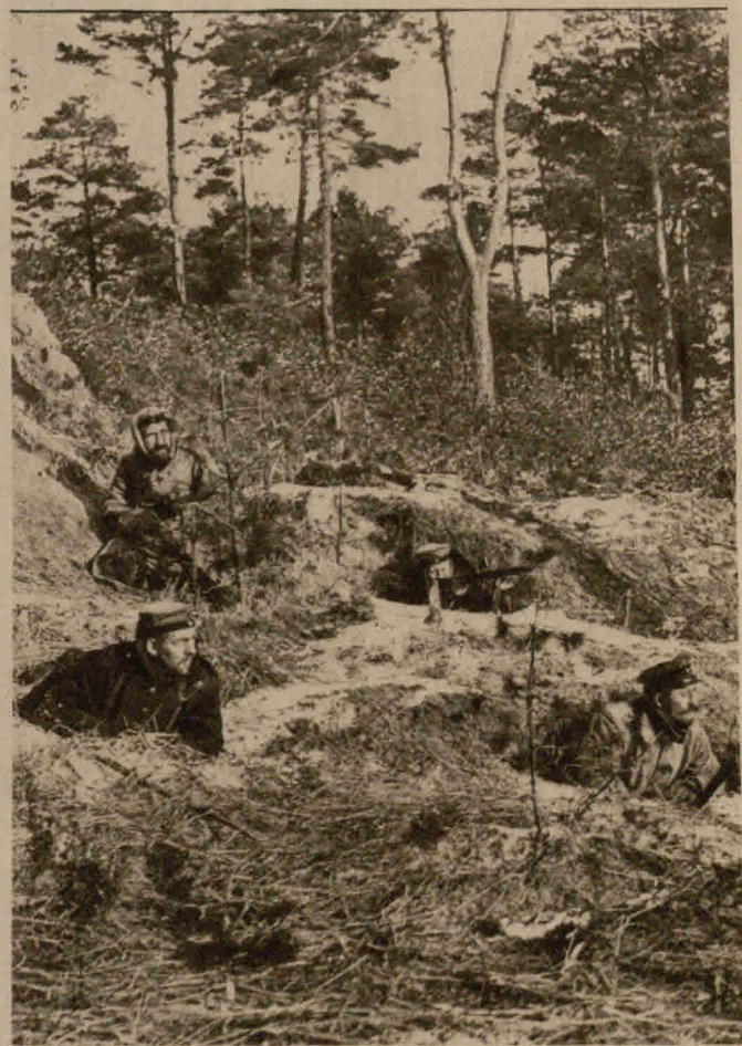
Aus Russisch-Polen: Deutsche Soldaten in den von den Russen bei ihrem Rückzug verlassenen Erdhöhlen