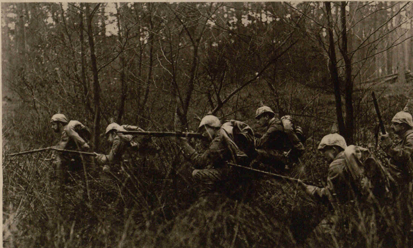
Eine Schleichpatrouille im Dickicht des Waldes

Aber endlich, endlich kamen wir wieder in unserer Stellung an. Raum nahmen wir uns Zeit zur Meldung, dann verfielen wir alle in einen tiefen, aber unruhigen Schlaf. Und währenddem ist draußen im Schützengraben unser lieber Feldwebel unter furchtbaren Schmerzen gestorben.