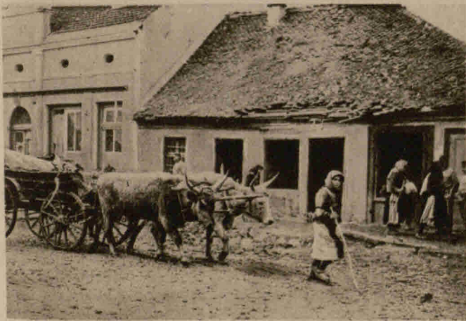
Serben, die von den eigenen Truppen weggejagt wurden, um diesen nicht zur Last zu fallen, auf der Flucht von Stadt zu Stadt