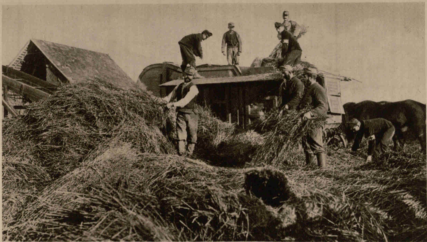
Österreichische Soldaten in Serbien holen sich Stroh für ihre Schutzhütten