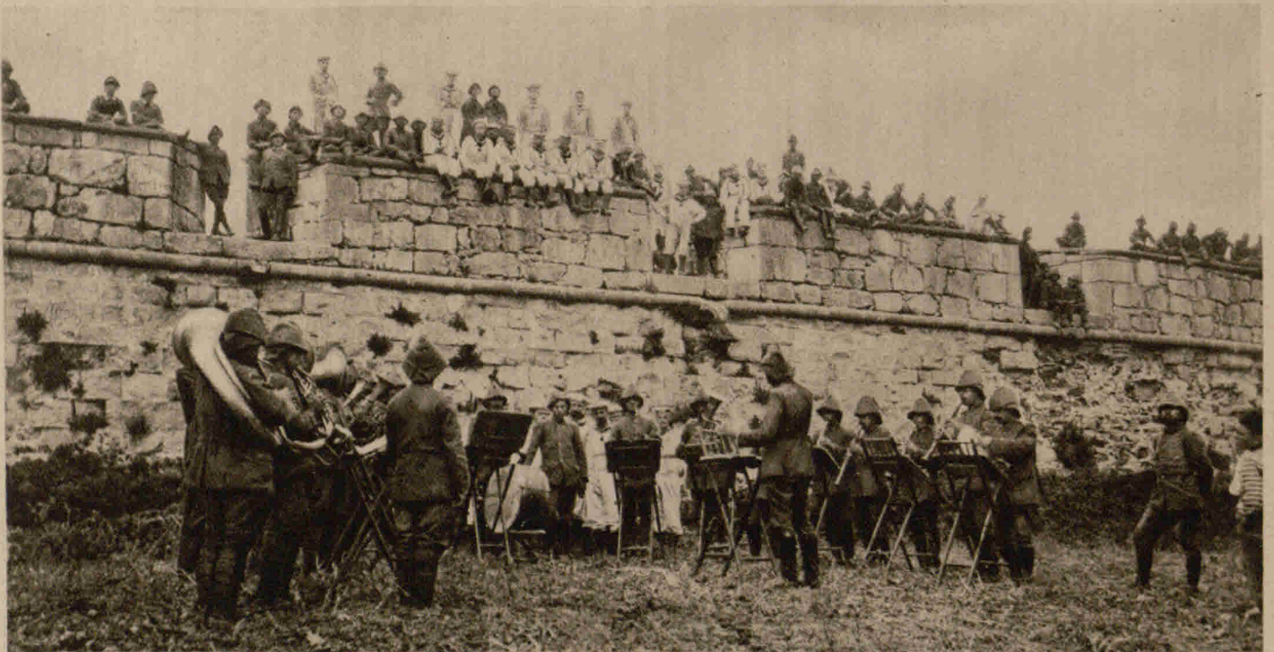
Deutsche Matrosen und Türken auf einer alten Befestigungsmauer an der Bosphoreneinfahrt als Zuhörer einer türkischen Militärkapelle