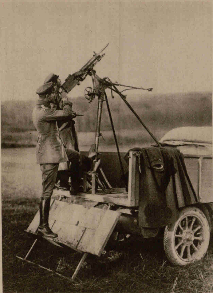
Ein erobertes französisches Maschinengewehr zur Abwehr feindlicher Flieger, fertig zum Feuern