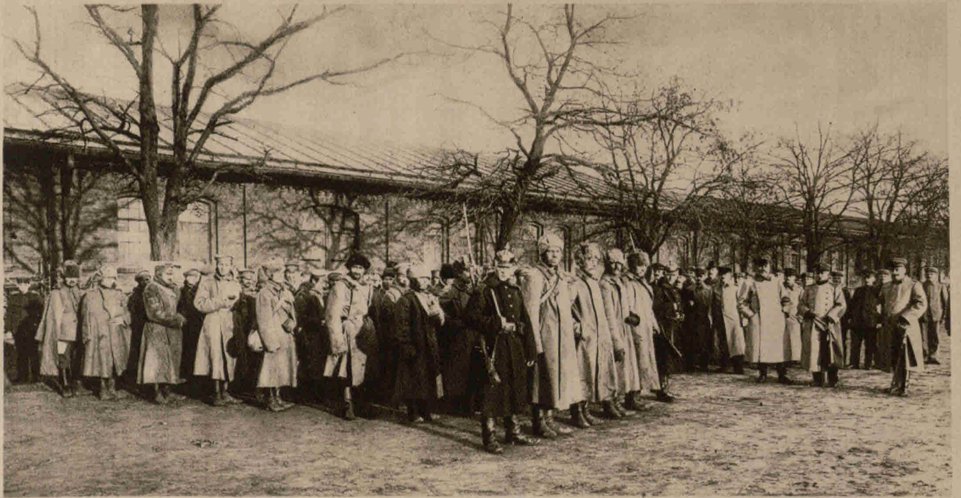
Sibirische Soldaten in deutscher Gefangenschaft