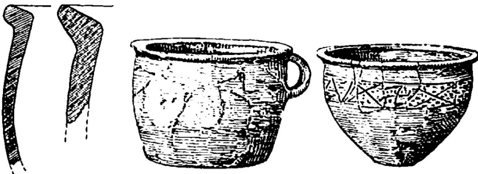
Odłamki naczyń używanych przez Wandalów z „Dobrego Zdroju” w kaplicy św. Anny