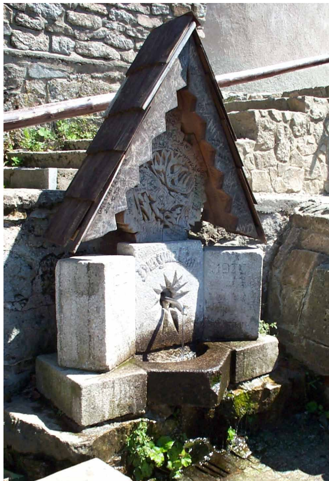
Dobry Zdrój na pocztówce sprzed 1945 roku (po lewej) i obecnie. Rzeźba pochodzi ze szkoły snycerskiej w Cieplicach-Zdroju