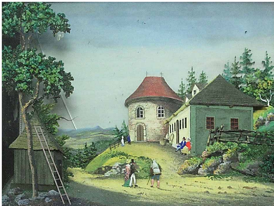
Kaplica św. Anny

Kaplica św. Anny należy do najstarszych świątyń w obrębie jeleniogórskiego grodu. Po raz pierwszy wspomniana została w dokumentach w roku 1366. Książę Bolko II ufundował w dzień św. Michała tegoż roku coroczną jałmużnę w wysokości trzech marek: dwie przeznaczone były na utrzymanie budowli, jedna zaś – dla proboszcza z Kauffung. Sosnówka posiadała już od roku