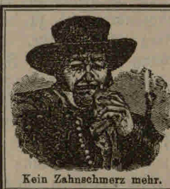
Kein Zahnschmerz mehr.

entfernt sofort jeden Schmerz cariöser Zähne, greift diese absolut nicht an, kann unbedenklich selbst bei Kindern ange- wandt werden, wirkt erhaltend auf die Zahn-Substanz und desinficirend auf die Mundhöhle.