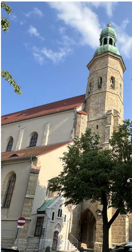
Kirchturm St. Pankratius und Erasmus