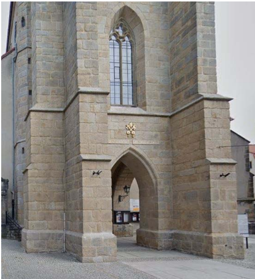
Stirnseitiger Eingang zur Turmhalle

Die vier Evangelisten laden zum Gottesdienst die Gläubigen ein und Jesus Christus, ganz oben, steht über allem.