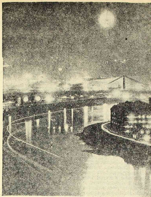
JEDEN Z BULWAROW W MOSKWI TONIE W POWODZI ŚWIATEŁ.