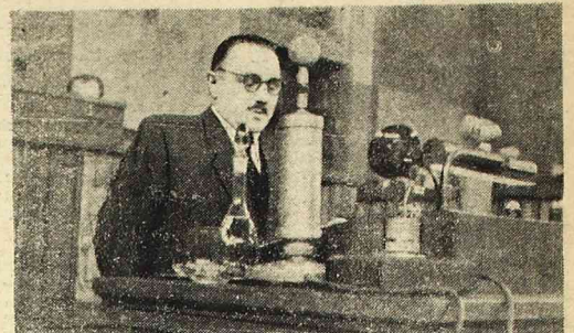
28. BM. NASTĄPIŁO OTWARCIE PIERWSZEGO POSIEDZENIA JESIENNEJ BUDGETOWEJ SESJI SEJMU. PREZYDENT R.P. B. BIERUT WYGLASZA PRZEMOWIENIE PODCZAS OTWARCIA SESJI

złóżyska ropy naftowej. W najbliższym czasie ma się udać do Abisynii grupa ekspertów naftowych w celu przeprowadzenia próbnych wierceń. Amerykanie kierują swe zainteresowanie również na eksploatację kruszców, który był przed wojną jednym z artykułów eksportowych Abisynii. W Londynie wizyta Rockefellera uciesza. Hailę Selasie wywołała po ważne zamieszanie. Przypuszcza się, że St. Zjedn. pragną wypęczyć W. Brytanię z pozycji gospodarczych, które udało się jej zdobyć po osadzeniu Negusa na tronie.