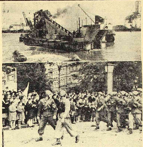
1. W PORCIE SZCZECIŃSKIM FOWSTAJE BAZEN KASZUBSKI, PRZEZNACZONY DO MASOWYCH PRZELADUNKÓW. 2. LUDNOŚĆ SZCZECINA ENTUZJASTYCZNIE WITAJĄ ODDZIAŁY WOJSK POLSKICH WRACAJĄCE Z M. NEWROW.