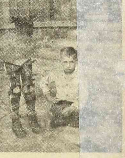
Dziecko — kaleka i jego długi

Przez muślinowe zasłony okien na stauracji widać wędrujące na stopy, coraz to nowe butelki.