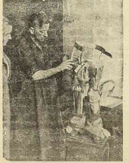
Tu się robi protezy

Brama zakładu jest szeroko otwarta i widać dużo małych figurek, poruszających się przed łarasem. Pochodzą bliżej i stwierdzam, że są między dziećmi również i starsi chłopcy i dziewczęta tylko, że nie